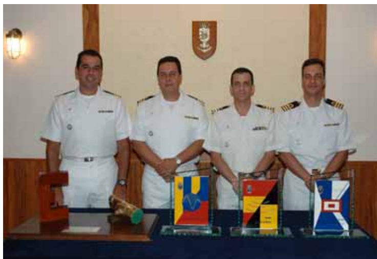
Comandantes dos navios premiados.