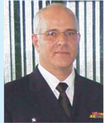
C Alte Gener