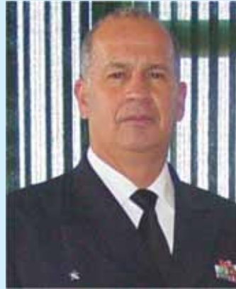
C Alte Garrone