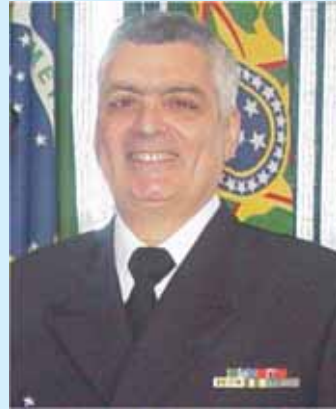
C Alte Aloysio