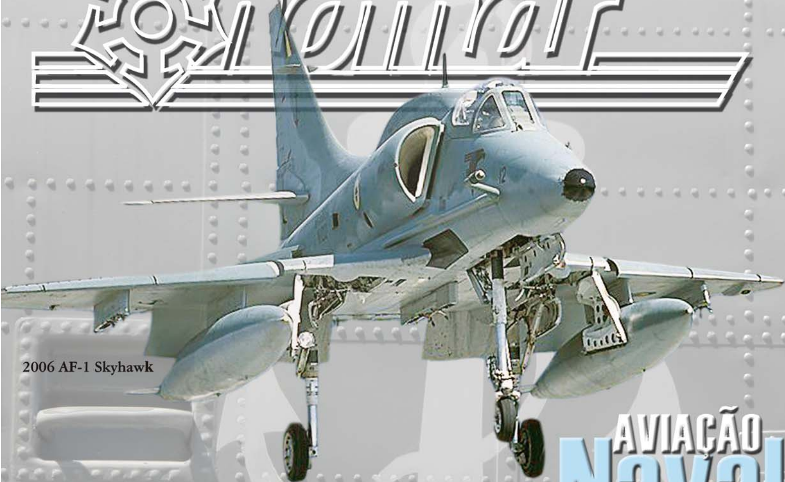
2006 AF-1 Skyhawk