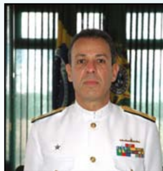
Contra-Almirante Bento Costa Lima Leite de Albuquerque Junior ComForS