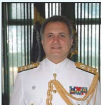
Contra-Almirante (IM) Anatalicio Risdén Junior CORM