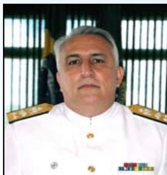
Contra-Almirante (IM) Francisco José de Araujo CCIM