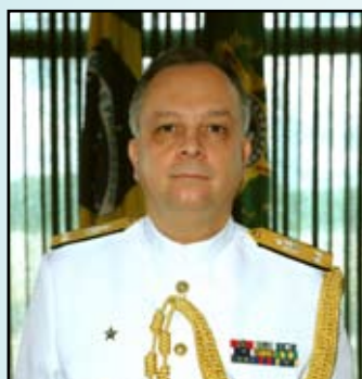
Contra-Almirante Domingos Savio Almeida Nogueira CCSM