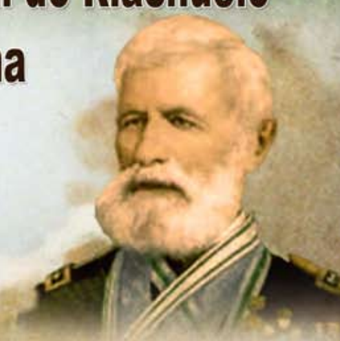
Almirante Barroso Comandante da Força Naval