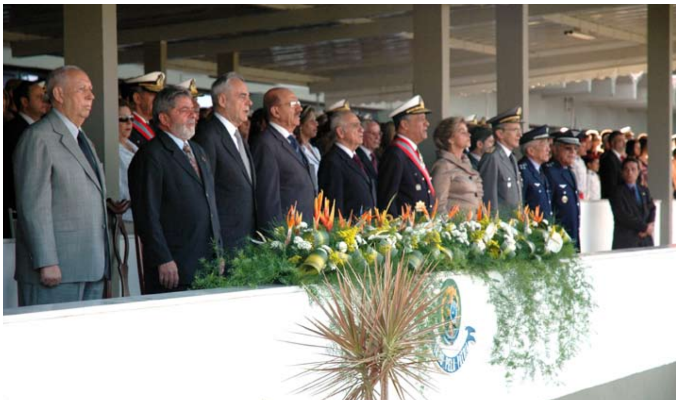
Palanque de Autoridades, Cerimônia de 11 de junho de 2008, em Brasília

A Batalha Naval do Riachuelo, a mais importante das batalhas navais travadas na Guerra da Tríplice Aliança (1864-1870), ocorreu em 11 de junho de 1865, às margens do Rio Riachuelo, um afluente do Rio Paraguai, na província de Corrientes, na Argentina. O aniversário dessa batalha é comemorado como a Data Magna da Marinha do Brasil.