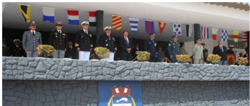
Palanque de Autoridades, Cerimônia de 11 de junho de 2008 em Natal

O Comando do 3º Distrito Naval realizou a cerimônia militar na Base Naval de Natal. A presença marcante de Soamirinos e de Oficiais da Reserva e Reformados que residem em Natal, trouxe um brilho especial à cerimônia. O Comandante do 3º DN, V Alte Edison Lawrence Mariath Dantas, realizou a imposição da Medalha da Ordem do Mérito Naval aos agraciados. A cerimônia foi encerrada com o tradicional desfile de tropas.