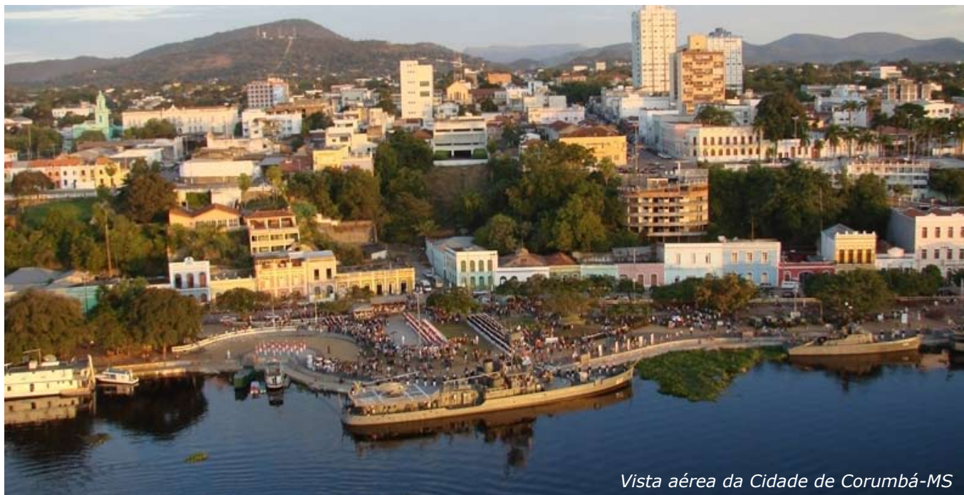
Vista aérea da Cidade de Corumbá-MS

O Comando do 6º Distrito Naval realizou as comemorações alusivas à Batalha Naval do Riachuelo, nas cidades de Corumbá e Ladário, com a participação da população, com intuito de estreitar os laços entre a Marinha do Brasil e a sociedade. O Navio-Transporte Fluvial "Paraguassu", o Navio-Patrolha "Penedo" e o Monitor "Parnaíba" permaneceram atracados no Porto Geral de Corumbá para visitação pública.