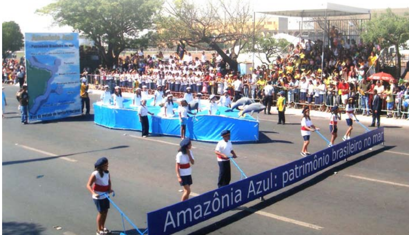
Alunos da Escola Classe 314 Sul, de Brasília, ressaltaram a importância da "Amazônia Azul"