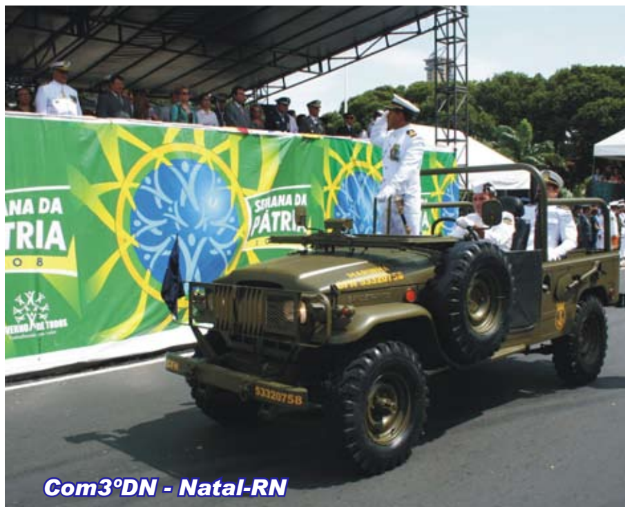
Com3ºDN - Natal-RN

Além das Forças Armadas e Auxiliares, desfilaram também a Guarda Municipal, a Secretaria de Trânsito e Tráfego Urbano e o Serviço de Atendimento Médico de Urgência. O desfile foi finalizado pelos Grupamentos Motorizados das três Forças Armadas e pela Cavalaria da Polícia Militar.