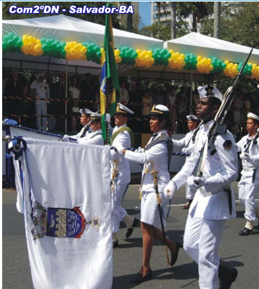
Com2ºDN - Salvador-BA

A Marinha do Brasil desfilou com um efetivo de 350 militares, entre marinheiros e fuzileiros navais, que servem no Comando do 2º Distrito Naval e nas Organizações Militares subordinadas, distribuídos em um pelotão de polícia, um pelotão feminino, duas companhias, banda de música e o pelotão Sargento Borges (executando evoluções e manobras), além de 30 adolescentes do Programa de Apoio ao Menor, do convênio firmado com o Juizado da Infância e Juventude.