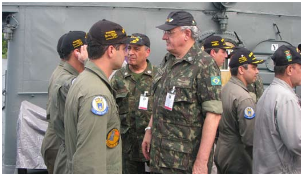
Ministro da Defesa e o Comandante da Marinha durante a Operação "Poraquê"

de 12 a 26 de setembro, no litoral dos estados do Rio de Janeiro, São Paulo e Espírito Santo, contando com a participação de mais de 10.000 militares e diversos meios navais e aeronavais. Essa Operação foi coordenada pelo Comando de Operações Navais (ComOpNav).