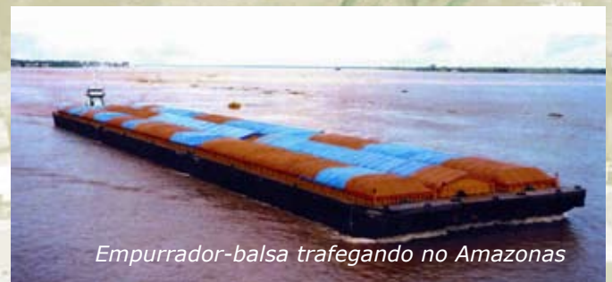
Empurrador-balsa trafegando no Amazonas

Dentro desse conceito, são produzidos, diretamente pelo Serviço de Sinalização Náutica do Norte (SSN-4), "bacalhaus provisórios" dos trechos levantados, os quais estão disponíveis para serem baixados e impressos pelos navegantes no site: www.mar.mil.br/dhn/chm/avgantes/folheto/pdf.htm ; link "Bacia Amazônica - Bacalhaus Provisórios", em um prazo não su-