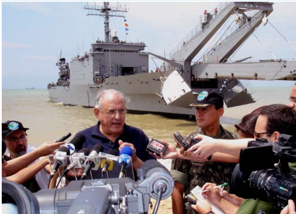
Ministro da Defesa concede entrevista durante a Operação "Atlântico"

A Operação "Atlântico" foi realizada no período