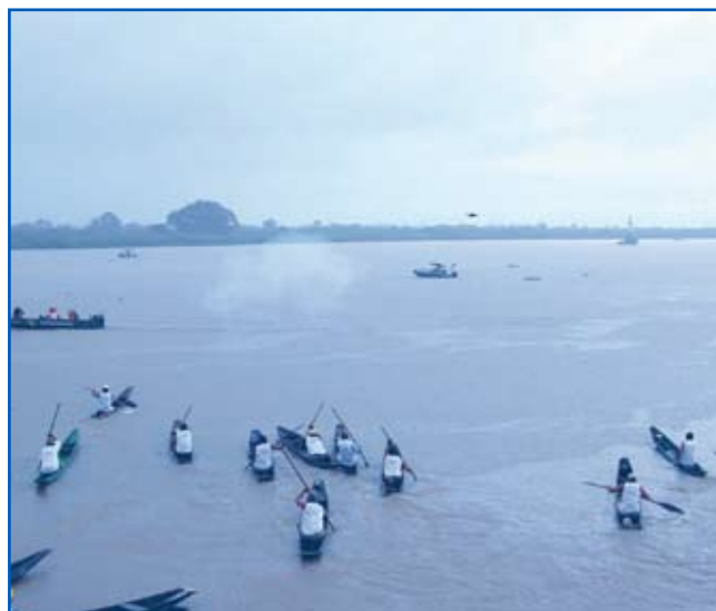
Largada da Categoria Master na Regata Canoinhas no Porto Geral de Corumbá

No período de 1 a 14 de dezembro de 2008, uma série de atividades abertas ao público marcaram o Dia do Marinheiro no Comando do 6º DN. As comemorações tiveram início com a inauguração da iluminação festiva do pórtico do 6º Distrito Naval, no dia 1º, e prosseguiram, em Corumbá e Ladário, com ações cívico-sociais e palestras para cerca de 1.300 alunos das escolas Almirante Tamandaré e Marques de Tamandaré. Como ponto alto dos eventos, no período de comemorações, houve apresentações de peça teatral encenada por filhos de militares, da oficina de dança de Corumbá e da Banda de Música do Grupamento de Fuzileiros Navais de Ladário. Além disso, foi realizada premiação dos concursos de fotografia, pintura e trabalho marinho. Outro evento promovido foi a XVI Regata de Canoinhas. O objetivo dessa disputa é resgatar um legado histórico deixado por antepassados pantaneiros que utilizavam a "canoa de um pau só" como meio de transporte e de pesca, desde a época dos índios Guató. No Museu de História do Pantanal, foram expostas peças do Acervo Cultural da Sala de Memória Tenente Maximiano, medalhas do acervo da Marinha e obras selecionadas nos três concursos realizados.