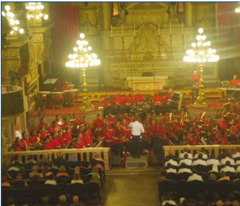
Apresentação da Banda Sinfônica do CFN na Igreja da Candelária

Já o Jôquei Clube Brasileiro homenageou a Marinha com a realização do Grande Prêmio Almirante Marquês de Tamandaré, ocorrido no dia 14 de dezembro. As comemorações foram encerradas, no dia 18, com o Concerto Sinfônico que contou com a presença da Banda Sinfônica do Corpo de Fuzileiros Navais (CFN), realizado na Igreja da Candelária, para um público de cerca de 800 pessoas.