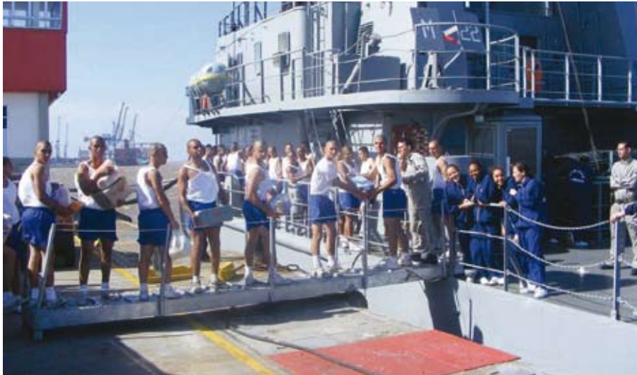
Transporte de donativos e apoio de militares

A Diretoria de Hidrografia e Navegação deslocou uma equipe, que realizava levantamento hidrográfico em Laguna durante o Curso de Hidrografia para Oficiais (CAHO), para sondar o Porto de Itajaí. Em dois dias, essa equipe prontificou a sondagem de aproximadamente 19 quilômetros, desde a entrada do canal de acesso ao porto até o interior do Rio Itajaí-Açu, o que possibilitou a reabertura do porto e o planejamento das futuras obras de dragagem, necessárias para a retirada da grande quantidade de sedimentos assoreados no canal de acesso.