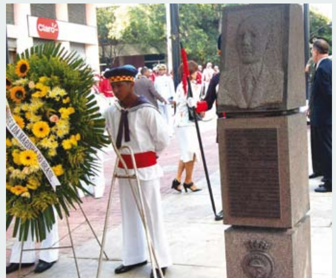
Memorial Dr. Raul Soares de Moura, em Belo Horizonte