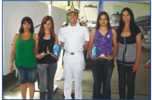
Premiação do concurso de redação da Operação Cisne Branco

Houve, ainda, a inauguração da nova sala de aula da Delegacia e o lançamento oficial da Revista "Sentinela", que tem o propósito de divulgar a Marinha do Brasil, suas atribuições e ações sociais ao longo dos 60 anos de presença no Oeste Paulista.