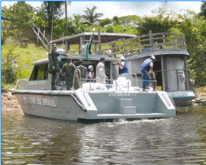
Distribuição de alimentos e brinquedos no Rio Cueiras

Como parte das comemorações da Semana da Marinha, o Comando do 9ºDN apoiou a realização do Projeto "Natal dos Ribeirinhos". Por meio desse projeto, foram doados brinquedos e cestas básicas às comunidades carentes do Rio Cueiras, afluente do Rio Negro, nas proximidades de Manaus (AM). A ação é coordenada, há 13 anos, por um grupo de Senhoras da Cidade de Manaus, denominado "Oficina do Amor". Para transportar e distribuir mais de 30 toneladas de donativos às comunidades beneficiadas, o Comando do 9ºDN disponibilizou o Navio de Assistência-Hospitalar "Carlos Chagas" e o Navio-Patrolha Fluvial "Pedro Teixeira". O material, entregue no período de 8 a 12 de dezembro de 2008, foi arrecadado pelo Grupo "Oficina do Amor" e pelo Comando do 9ºDN, que solicitou apoio às Federações e Associações de Classe das Empresas e do Comércio de Manaus. Durante a distribuição dos alimentos e brinquedos, foram realizados atendimentos médico-odontológicos e farmacêuticos, além de palestras de educação sanitária.