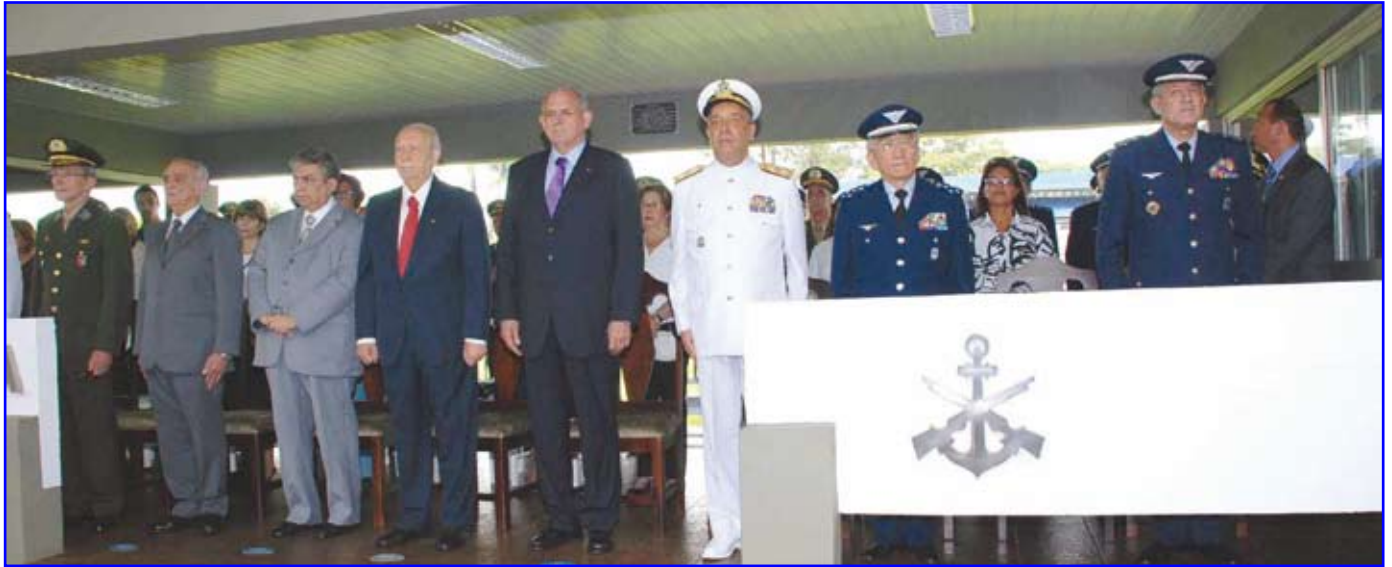
O Vice-Presidente da República, José Alencar, o Ministro da Defesa, Nelson Jobim, e os Comandantes da Marinha, do Exército e da Aeronáutica presentes no evento em Brasília, sede do 7º Distrito Naval

No dia 11 de dezembro de 2008, no Grupamento de Fuzileiros Navais de Brasília (GptFNB), foi realizada a cerimônia militar em comemoração ao Dia do Marinheiro e de imposição da Medalha Mérito Tamandaré, presidida pelo Vice-Presidente da República, José Alencar Gomes da Silva. O evento contou com a presença de autoridades militares e civis.