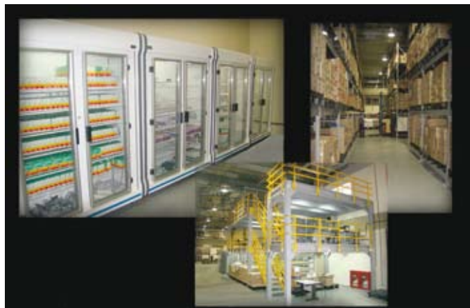
Área adequada para armazenagem

A conclusão das obras de adequação de parte das instalações do Depósito de Material de Eletrônica da Marinha no Rio de Janeiro permitiu a criação de uma área de armazenagem específica para o Material de Saúde, com 975 metros quadrados. A nova área de armazenagem responde por uma economia mensal de 58 mil reais, valor do aluguel que deixou de ser pago a uma empresa terceirizada. Nessa nova área, o material de saúde é armazenado com total controle das condições de umidade,