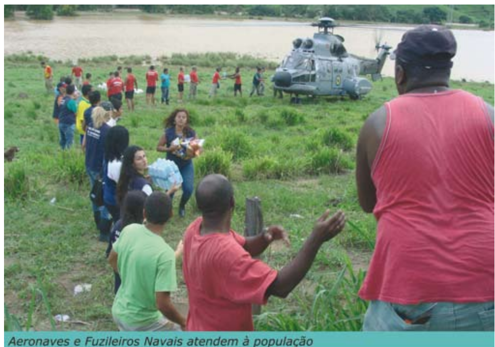
Aeronaves e Fuzileiros Navais atendem à população

Cerca de 100 pessoas, entre médicos, enfermeiros, bombeiros e funcionários estaduais, que participaram das ações de apoio à população das comunidades afetadas, também foram transportadas pelas aeronaves.