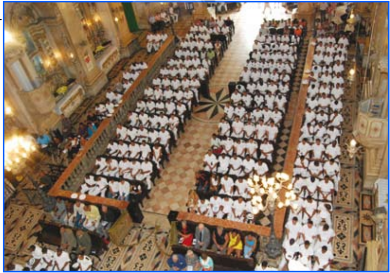
Igreja Nossa Senhora da Conceição da Praia