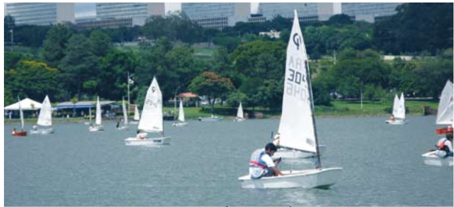
Evento realizado no Lago Paranoá, em Brasília

Fruto de parceria do Ministério do Esporte e do Ministério da Defesa, esse programa assiste a 200 crianças e jovens de comunidades de baixa renda, os quais recebem transporte, alimentação, assistência médico-odontológica, reforço escolar e orientação moral e cívica. Participam, também, de diversas