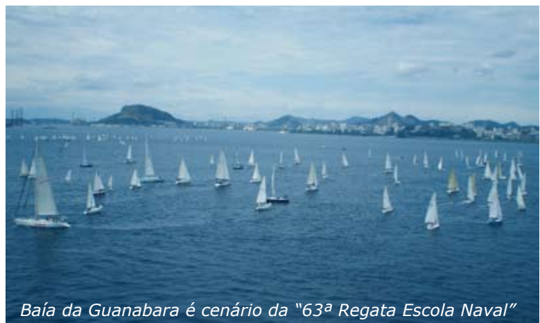
Baía da Guanabara é cenário da "63ª Regata Escola Naval"

Velejaram, também, crianças atendidas por projetos sociais, como: "Navega São Paulo", com os núcleos de Santos, Praia Grande e Guarujá;