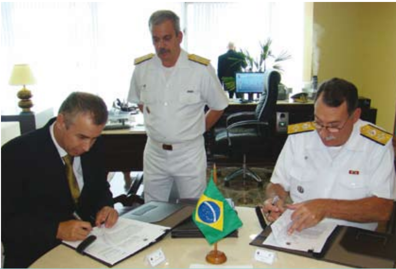
Presidente do INSS e o Chefe do Estado-Maior da Armada

Para levar os serviços e os benefícios da Previdência Social à população ribeirinha da Região Amazônica, a Marinha, por intermédio do Estado-Maior da Armada (EMA), e o Instituto Nacional do Seguro Social