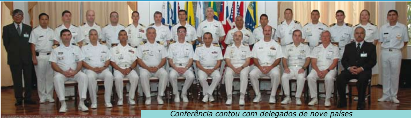
Conferência contou com delegados de nove países

No período de 17 a 21 de novembro de 2008, o Comando do Controle Naval do Tráfego Marítimo coordenou a realização da "VIII Conferência Naval Interamericana Especializada em Controle Naval do Tráfego Marítimo". Pela primei-