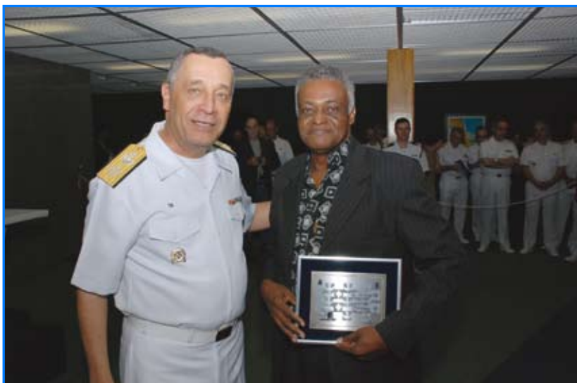
Comandante da Marinha parabeniza o 1º colocado do XXXIII Salão de Artes Brasília-Marinhas

Por ocasião das comemorações do Dia do Marinheiro, o Comando do 7º Distrito Naval promoveu o XXXIII Salão de Artes Brasília-Marinhas, no período de 11 a 19 de dezembro, no Espaço Cultural Zumbi dos Palmares, da Câmara dos Deputados. Os classificados receberam nove mil reais em espécie, com patrocínio da POUPEX e da Petrobrás.