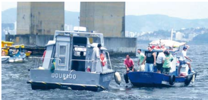
Inspeção na Baía da Guanabara

O propósito da operação foi fiscalizar os aspectos relacionados à segurança da navegação, salvaguarda da vida humana no mar e prevenção da poluição hídrica. Os proprietários e condutores das embarcações receberam orientações e folhetos explicativos, relacionados à segurança da navegação. Na ocasião, os aspirantes receberam adestramentos e tiveram a oportunidade de acompanhar as ações de Inspeção Naval. Essa atividade também faz parte da Operação Verão, realizada de novembro de 2008 a março de 2009. No Estado do Rio de Janeiro, além da capital, as principais ações acontecem em Cabo Frio, Arraial do Cabo, Búzios, Angra dos Reis, Itacuruçá e Paraty.