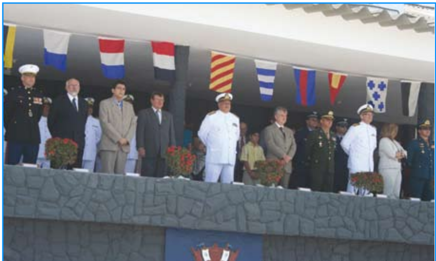
Palanque de autoridades no 3º Distrito Naval, em Natal (RN)

Uma sessão solene na Câmara de Vereadores da cidade do Natal (RN), no dia 4 de dezembro de 2008, homenageou o Dia do Marinheiro e o Bicentário do Corpo de Fuzileiros Navais na área do Comando do 3º DN. Na mesma data, foi iniciado, pela Capitania dos Portos de Alagoas, em Maceió (AL), o Salão de Artes, no Shopping Iguatemi. A Capitania dos Portos da Paraíba comemorou a data, no dia 12 de dezembro, com abertura da II Mostra de Nautimodelismo, da exposição sobre o Brasil na Antártica e da Amazônia Azul, entre outras exposições. Dentre as cerimônias organizadas nos cinco Estados da jurisdição do Com 3º DN, no dia 12 de dezembro, o Comandante do 3º Distrito Naval, V Alte Edison Lawrence Mariath Dantas, presidiu solenidade na Base Naval de Natal.