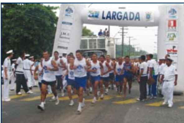
Realização da VI Corrida Rústica do Marinheiro

O Comando do 4º DN realizou, na Semana da Marinha, no período de 7 a 14 de dezembro de 2008, uma vasta programação de eventos militares e esportivo-sociais. No dia 7 de dezembro, ocorreu a VI Corrida Rústica do Marinheiro. O evento contou com cerca de 1.500 atletas. Nos dias 8, 12 e 14 de dezembro, a Banda do Grupamento de Fuzileiros Navais de Belém realizou apresentações públicas em shoppings centers de Belém.