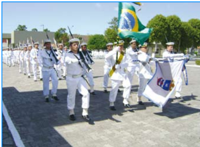
Desfile Militar no 5º Distrito Naval