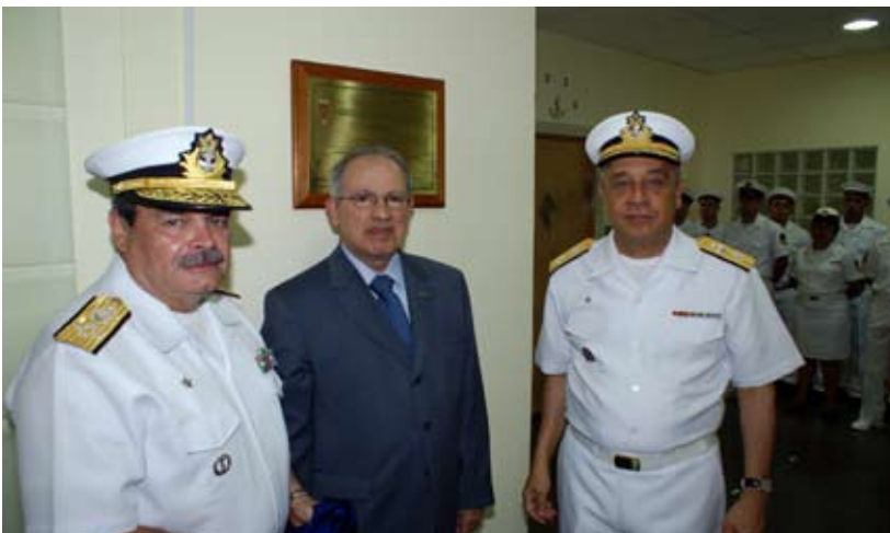
Cerimônia de inauguração das instalações da COGESN

Em 21 de janeiro de 2009, foram inauguradas as instalações da Coordenadoria-Geral do Programa de Desenvolvimento de Submarinos com Propulsão Nuclear (COGESN), situadas no Edifício nº 26 do Arsenal de Marinha do Rio de Janeiro.