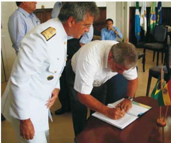
Presidente da República, Luiz Inácio Lula da Silva, assina o livro de Estabelecimento do Com6ºDN

O Comando do 6º Distrito Naval sediou, no dia 15 de janeiro de 2009, o Encontro de Fronteiras entre o Presidente do Brasil, Luiz Inácio Lula da Silva, e o Presidente da Bolívia, Evo Morales Ayma, ocorrido após a inauguração de trechos do corredor Bioceânico na Bolívia, rodovia que ligará a fronteira à Santa Cruz.