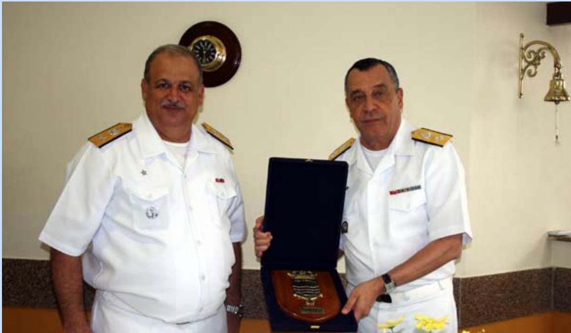
Comandante da Marinha recebe o brasão do Com 3ºDN