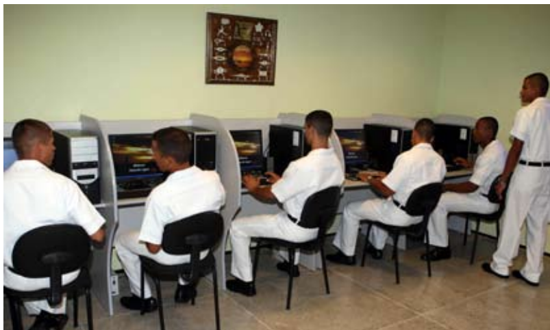
Sala da biblioteca com computadores conectados à Internet

Edificada em um local silencioso e com vista para o mar, a biblioteca conta com salas para estudo individual e em grupo, computadores conectados à Internet, acervo de 4 mil livros e vídeos educativos e de lazer, proporcionando ao seus usuários um ambiente de estudo e leitura agradável.