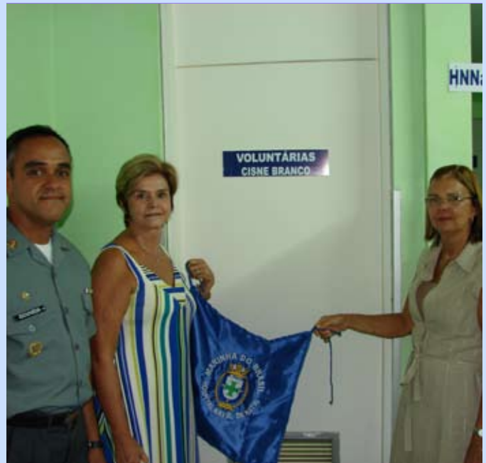
Inauguração da Sala das "Voluntárias Cisne Branco" no Hospital Naval de Natal