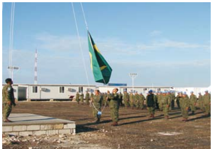
Cerimônia de hasteamento da Bandeira do Brasil

uma faina dessa envergadura, ocorrendo sob condições ímpares decorrentes do afastamento do Brasil e do trato com organismos internacionais. Esse êxito só foi possível devido à organização adotada em Grupamento Operativo, cuja estrutura permitiu que o seu Componente de Apoio de Serviços ao Combate conduzisse os trabalhos logísticos da mudança da base, enquanto o seu Componente de Combate Terrestre cumpria as atividades táticas.