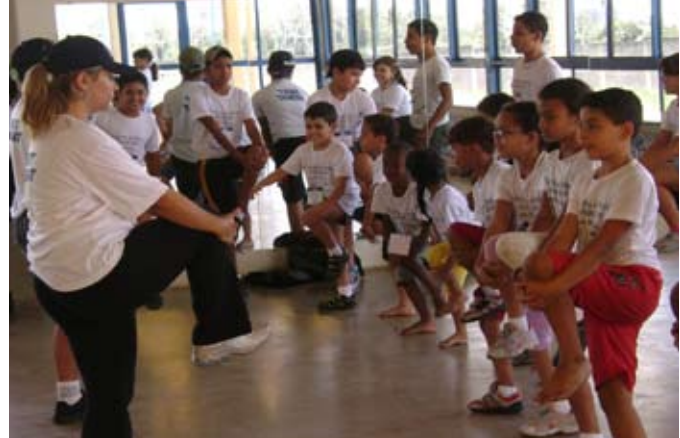
Aula de ginástica na Colônia de Férias do Com7ºDN

Também no período de 12 a 23 de janeiro, foi realizada a Colônia de Férias "SER PAI" (Sociedade, Educação e Recreação – Programa de Atividades Infantis), no Clube Naval de Brasília. Aproximadamente 50 crianças entre 2 e 13 anos foram ao cinema, teatro e à exposição "Arte para Crianças", no Centro Cultural do Banco do Brasil. No encerramento, houve uma grande festa de confraternização com a presença dos pais.