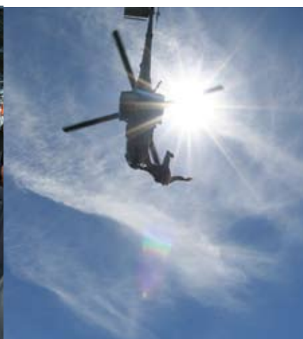
UH-14 apoiando salto de PQD no C-EXP-SAL 2009