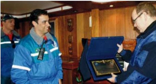
Príncipe Albert II recebe placa alusiva à visita

O Príncipe esteve na Antártica, a convite da comunidade científica, visitando 26 estações de 18 países. Ao final das atividades houve o descerramento de uma placa comemorativa à visita do Príncipe às instalações brasileiras na Antártica.