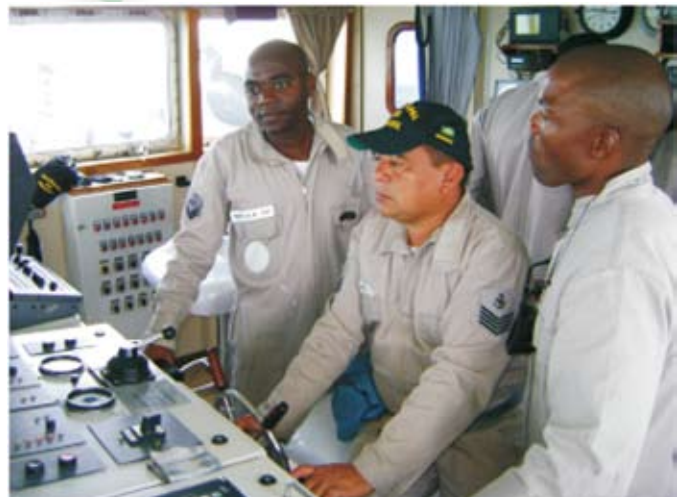
Programa de adestramento dos militares namibianos a bordo do Navio-Patrolha "Guanabara"

O detalhamento dos adestramentos realizados a bordo do NPa "Guanabara", o que, para esse fim, no âmbito do Com4ºDN, é pioneiro, demonstra a preocupação da Marinha do Brasil em bem formar a futura guarnição namibiana do NPa "Brendan Simbwaye".