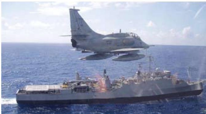
Aeronave AF-1 em exercício de ataque ao NDD "Rio de Janeiro"

No período de 26 a 30 de janeiro de 2009, o Esquadrão VF-1 participou, com duas aeronaves AF-1, da Operação ASPIRANTEX, realizada no litoral da região Nordeste.