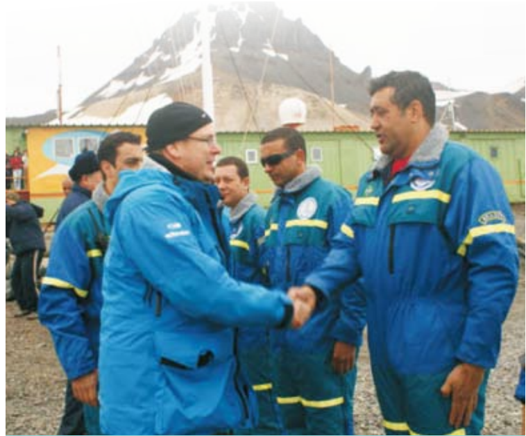
Príncipe Albert II é recebido na EACF