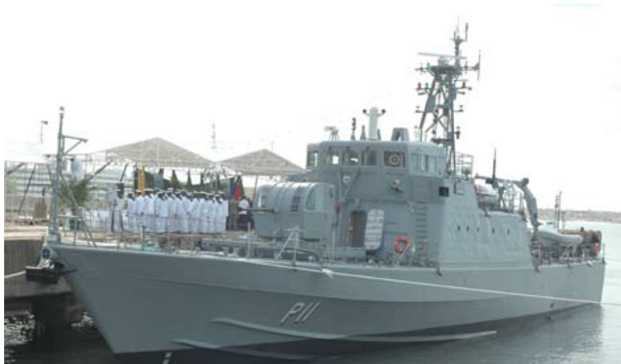
Navio-Patrulha "Brendan Simbwaye"

Está prevista, também, a ativação de um Grupo de Apoio Técnico de Fuzileiros Navais, composto de 5 oficiais e 16 praças da Marinha do Brasil que, pelo período de um