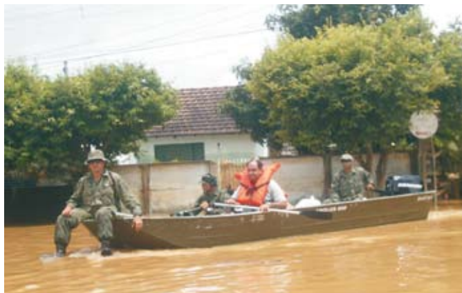
Resgate de vítima em Campos dos Goytacazes

A Marinha do Brasil ajudou a Defesa Civil na manhã de 29 de janeiro de 2009, quando foi solicitada pelo Batalhão da Brigada Militar de Rio Grande e Pelotas,