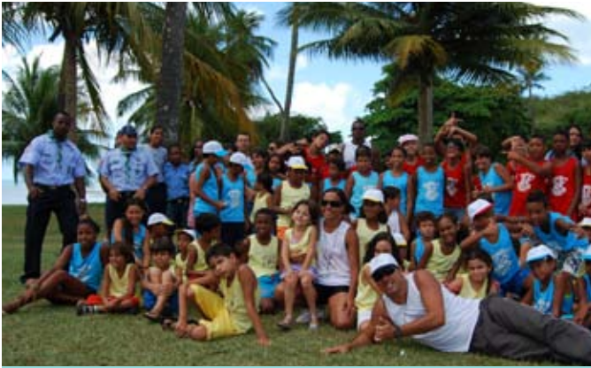
Participantes da Colônia de Férias do Com2ºDN

Entre os dias 19 e 30 de janeiro de 2009, 82 crianças, dependentes de militares e servidores civis, participaram da Colônia de Férias do Com2ºDN, na praia de Inema – Base Naval de Aratu.