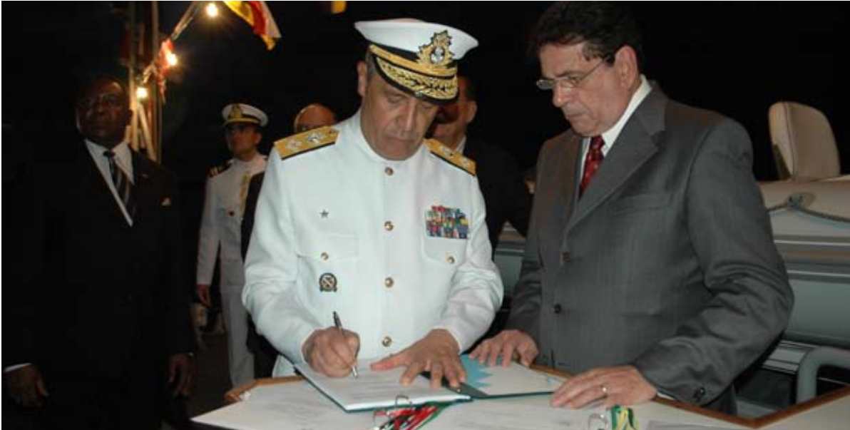
Assinatura do livro do Navio-Patrolha "Brendan Sinbwaye"

gráfico realizado pelo NHi "Sirius" e a consultoria nos trabalhos do estabelecimento do limite exterior da plataforma continental daquele país, contemplando a aquisição de dados, o processamento, a confecção de relatório e a preparação do pessoal para apresentação da proposta à Comissão de Limites da ONU.