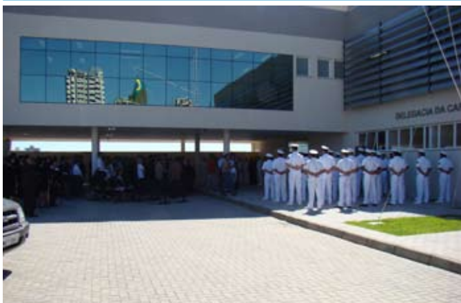
Inauguração do novo prédio da DELITAJAI

A Delegacia da Capitania dos Portos em Itajaí (DELITAJAI) inaugurou o Prédio Principal de sua nova sede, em cerimônia militar realizada no dia 12 de janeiro de 2009. Essa é a primeira fase das obras localizadas às margens do rio Itajaí, próximas ao Mercado Público da cidade.