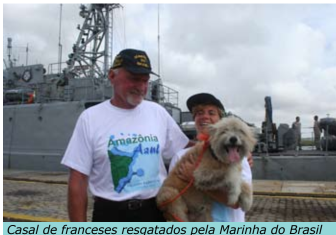
Casal de franceses resgatados pela Marinha do Brasil

para ajudar no resgate de 30 pessoas que se refugiaram nos telhados de suas residências. Enquanto isso, dois caminhões e um jipe com 16 militares do Grupamento de Fuzileiros Navais do Rio Grande deslocaram-se para o Capão do Leão, transportando material de apoio e três botes infláveis da Capitania dos Portos do Rio Grande do Sul.