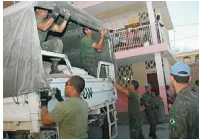
Desembarque do material doado

A chegada do navio aos portos estrangeiros foi cercada de expectativa e reconhecimento da população local. Cuba foi o país mais afetado nessa última temporada de ciclones, tendo sido atingido por três fortes furacões: "Ike", "Gustav" e "Paloma".