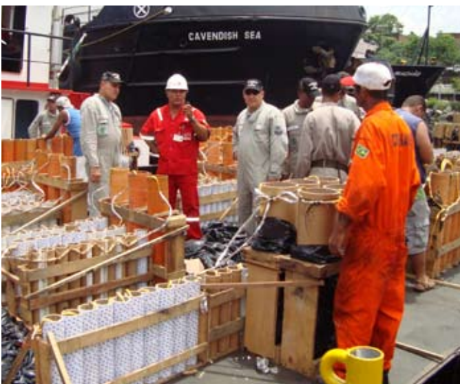
Inspeção das balsas com os fogos de artifício