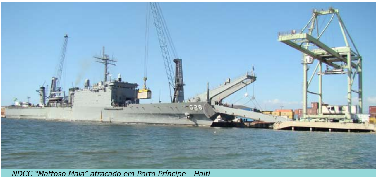
NDCC "Mattoso Maia" atracado em Porto Príncipe - Haiti

No período em que o navio esteve no Haiti, foi concluída a distribuição dos alimentos doados pelo Governo do Brasil e o desembarque dos equipamentos para o contingente militar brasileiro que atua no país.