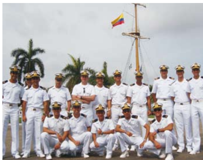
Grupo de Guardas-Marinha e Oficiais no Porto de Cartagena

A tripulação do NE "Brasil" foi composta por 31 Oficiais, 219 Praças e 163 GM, além de 1 Oficial do Exército Brasileiro e outro da Força Aérea Brasileira, 2 integrantes da Marinha Mercante Nacional, 1 diplomata do Ministério das Relações Exteriores e 15 representantes de Marinhas amigas, como convidados.