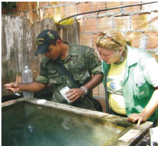
Militar visita residência em ação de combate à dengue

No Com9ºDN, uma equipe de 18 militares atua em parceria com a Fundação de Vigilância em Saúde do Estado do Amazonas, desde o dia 26 de janeiro, com previsão de término em 30 de abril. Até o momento, foram visitadas 4.404 residências, eliminando-se 5.604 criadouros do mosquito.