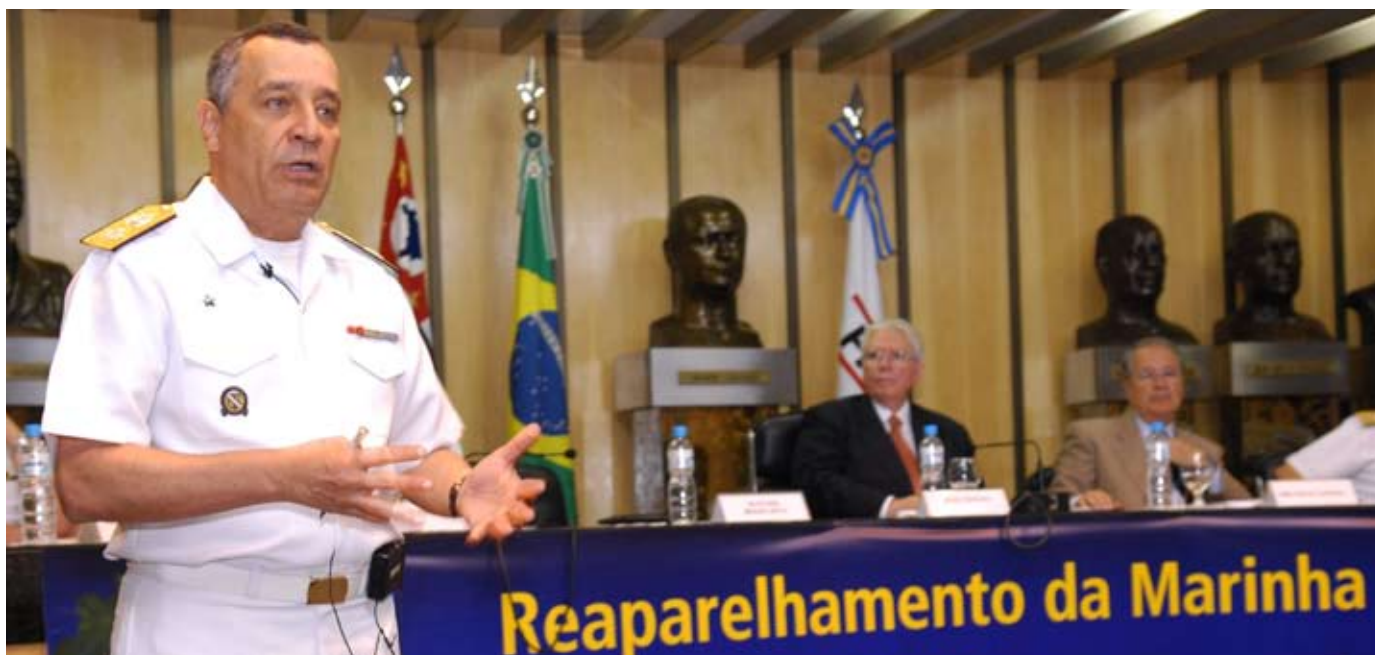
Comandante da Marinha, Alte Esq Moura Neto, discursa no Seminário

A Federação das Indústrias do Estado de São Paulo (Fiesp), por meio do Departamento da Indústria de Defesa, promoveu o Seminário de Reaparelhamento da Marinha do Brasil, no dia 26 de outubro de 2009, para um público formado por 150 empresas, de 18 setores industriais brasileiros.