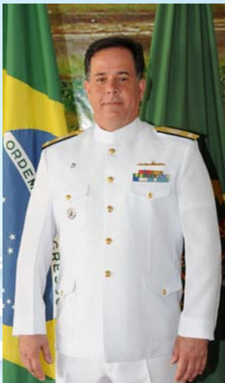
Contra-Almirante Afrânio de Paiva Moreira Junior

O Contra-Almirante Afrânio de Paiva Moreira Junior é natural do Rio de Janeiro. Foi declarado Guarda-Marinha em 13 de dezembro de 1979.