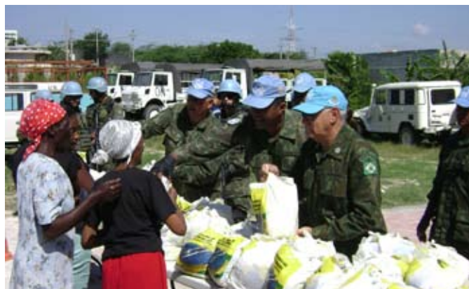
Comandante de Operações Navais participa da distribuição de alimentos doados

O Grupamento Operativo realizou Ação Cívico Social, no dia 29 de setembro, na sua área de responsabilidade, durante a qual, foram doados 50 Kg de leite em pó, 250 Kg de arroz e 100 Kg de feijão à instituição haitiana denominada "Coalizão para o Desenvolvimento de DELMAS 4".