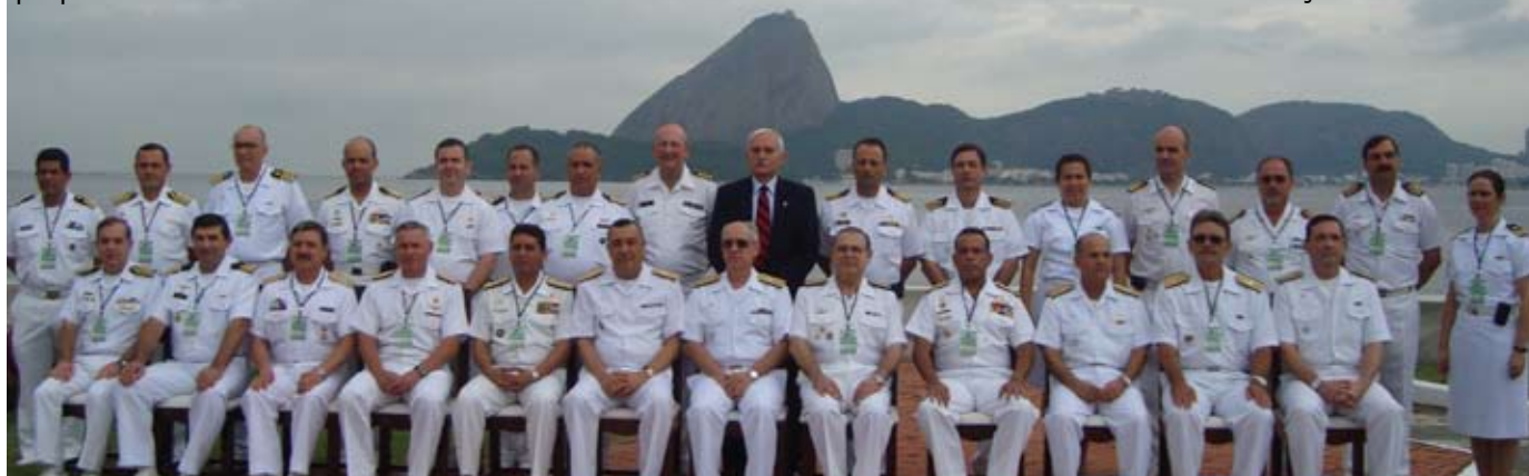
Participantes posam para foto histórica, no pátio da Escola Naval

de Educação à Distância", para administrar ofertas acadêmicas das Marinhas das Américas e de outras entidades afins. O sistema será implementado com o intuito de gerar conhecimento e competências que contribuam para a coordenação hemisférica, permitindo a participação de todas as Marinhas, maximizando o emprego dos recursos existentes e respeitando as visões e os interesses de cada instituição.