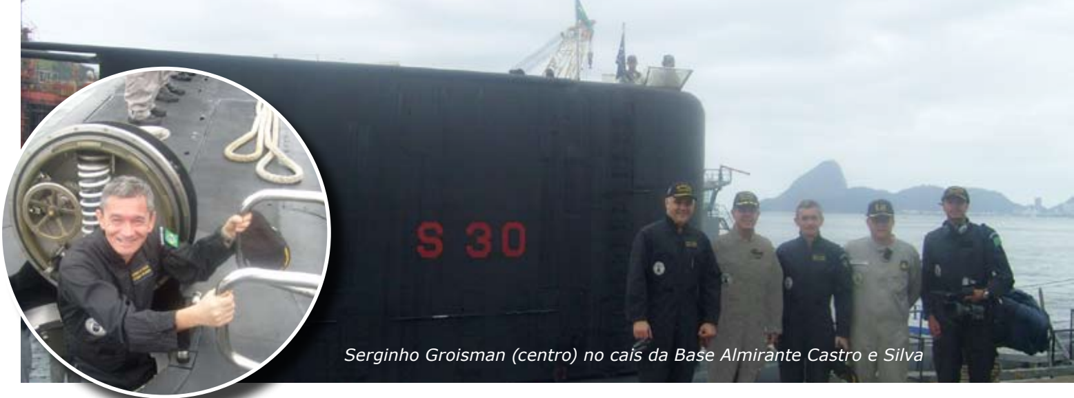
Serginho Groisman (centro) no cais da Base Almirante Castro e Silva

No dia 7 de outubro de 2009, ainda como parte das gravações da matéria a ser veiculada, o helicóptero da Rede Globo de Televisão, ("GloboCop"), fez tomadas do submarino vindo à superfície em emergência e navegando na superfície, enquanto demandava a entrada da Baía de Guanabara. A matéria foi exibida no programa "Altas Horas" no dia 31 de outubro.