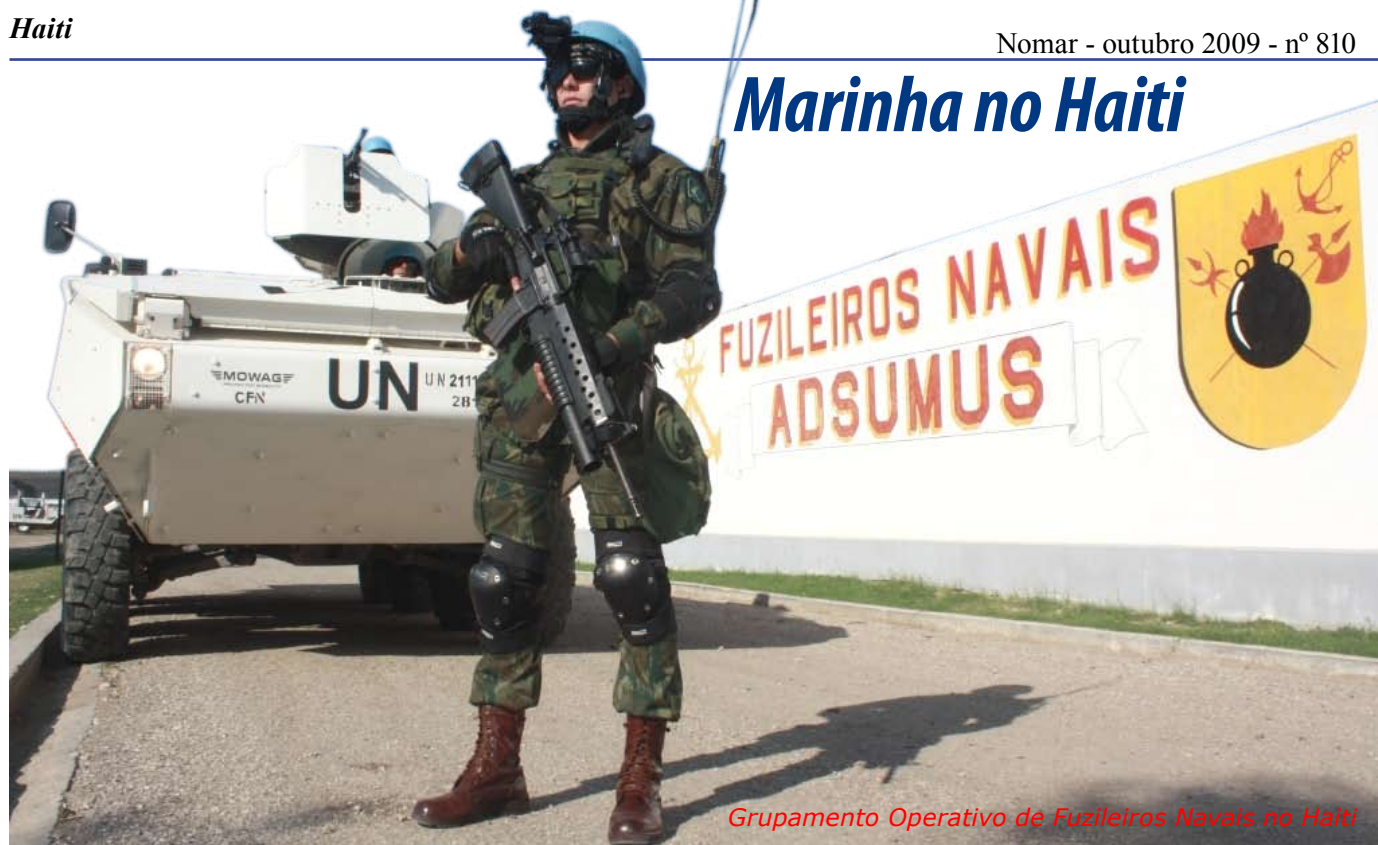
Grupamento Operativo de Fuzileiros Navais no Haiti

Em 1º de junho de 2004, foram instituídas as Forças de Estabilização e Manutenção da Paz da Organização das Nações Unidas no Haiti (MINUSTAH) e, desde então, as tropas brasileiras estão presentes nas áreas mais conflituosas do país, com a responsabilidade de manter um ambiente estável e seguro, garantindo à população o exercício pleno dos direitos humanos.