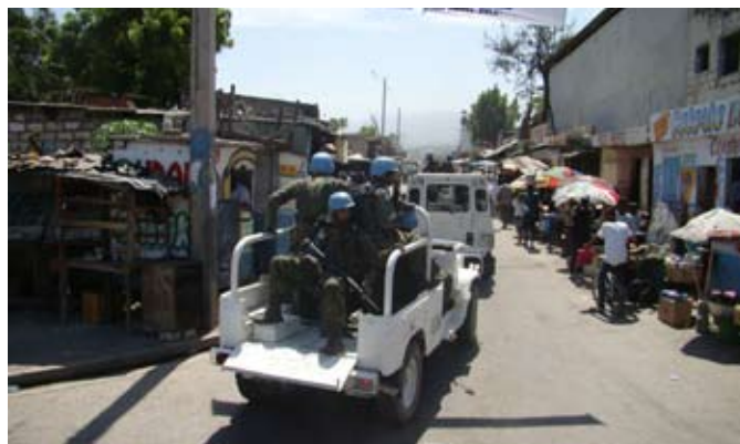
Patrulha Motorizada no Interior da área de responsabilidade do GptOpFuzNavHaiti-XI