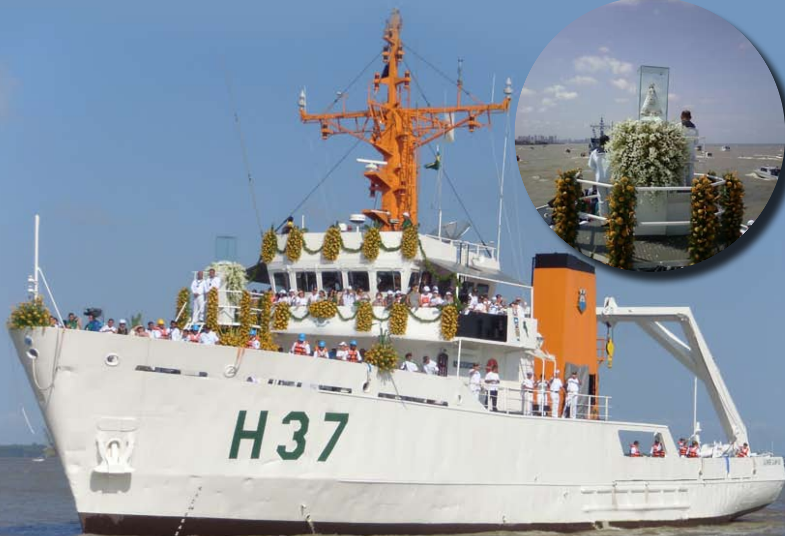
NHo "Garnier Sampaio" com a imagem de Nossa Senhora de Nazaré