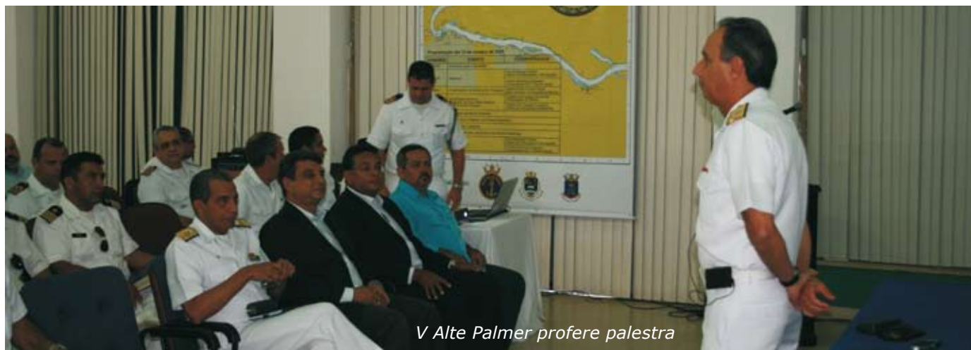
V Alte Palmer profere palestra

A Diretoria de Hidrografia e Navegação e o Comando do 6º Distrito Naval realizaram, no dia 13 de outubro de 2009, o I Seminário de Segurança da Navegação, com o tema "A Cartografia e a Sinalização Náutica na Bacia do Rio Paraguai". O evento teve por objetivo discutir aspectos relacionados à navegação na Hidrovia Paraguai-Paraná; a produção de cartas náuticas em papel e em mídia digital; o estabelecimento e a manutenção dos sinais náuticos nos rios Paraguai e Cuiabá; e a divulgação de informações de segurança para a navegação.