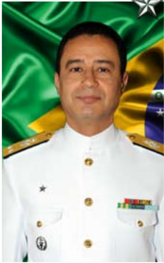
Contra-Almirante Almir Garnier Santos

★ ★ O Contra-Almirante Almir Garnier Santos é natural do Rio de Janeiro. Foi declarado Guarda-Marinha em 13 de dezembro de 1981.