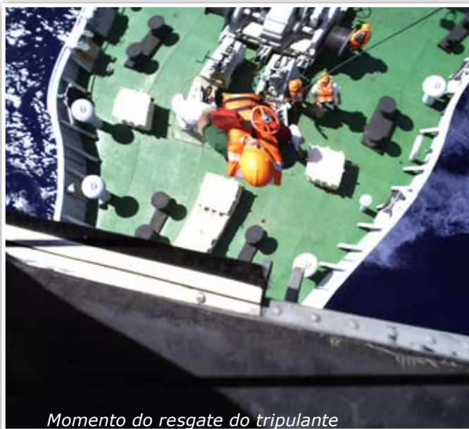
Momento do resgate do tripulante

A Fragata "Independência", em deslocamento para participar da Operação "Joint Warrior 2010", realizou, no dia 12 de março de 2010, a Evacuação Aeromédica (EVAM) de um tripulante do Navio "Professor Logachev", de bandeira russa, a cerca de 70 milhas náuticas (130 quilômetros) de Vitória (ES).