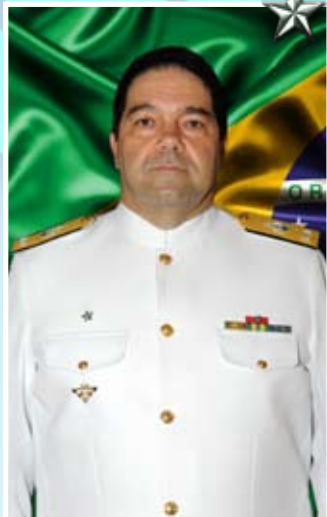
Contra-Almirante Rodolpho Arpon Marandino

O Contra-Almirante Rodolpho Arpon Marandino é natural do Rio de Janeiro. Foi declarado Guarda-Marinha em 13 de dezembro de 1980.