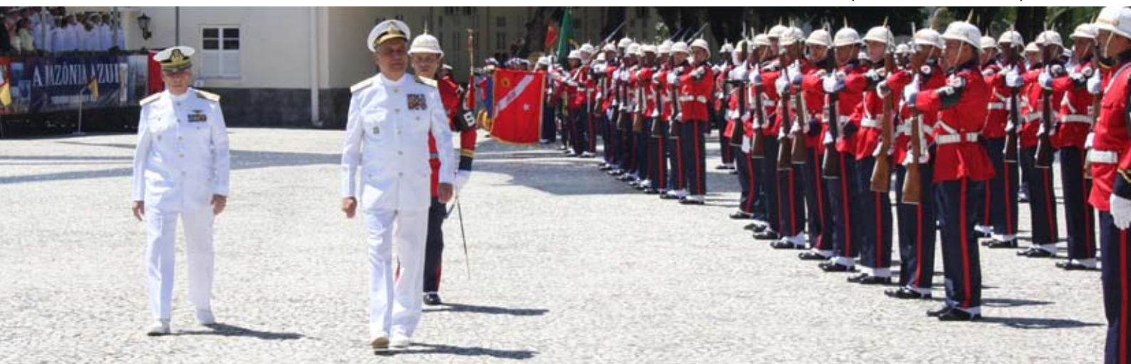
Comandante da Marinha passa em revista a tropa

conduzidas pela Marinha. Sua atuação no exterior, quer seja na segurança das embaixadas ou em operações humanitárias e de paz, em especial o desempenho do Grupamento Operativo de Fuzileiros Navais no Haiti, tem evidenciado o elevado conceito do soldado brasileiro.