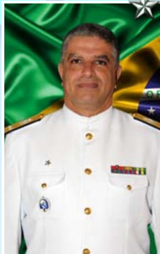
Contra-Almirante Rodolfo Frederico Dibo

★ ★ O Contra-Almirante Rodolfo Frederico Dibo é natural do Rio de Janeiro. Foi declarado Guarda-Marinha em 13 de dezembro de 1980.