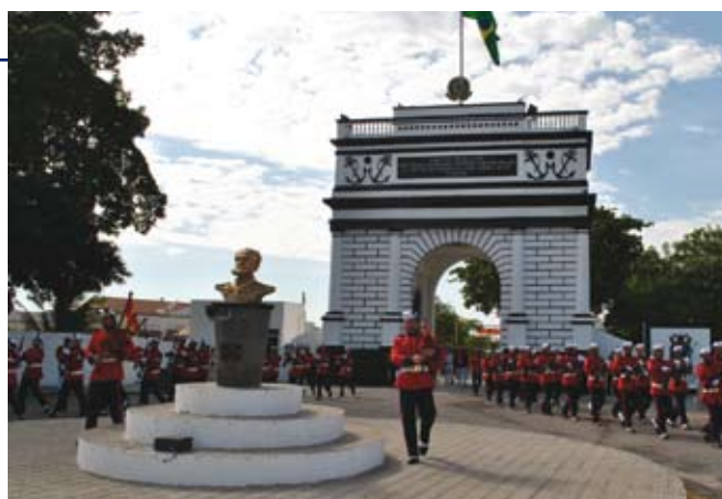
Cerimônia na Praça do Pórtico da Fortaleza Naval de Ladário

Na programação do evento, houve a condecoração com a Ordem do Mérito Naval e a Troca de Guarda Comandante Cunha Couto, formada por militares do Corpo de Fuzileiros Navais, localizada no interior da Fortaleza Naval de Ladário.