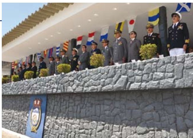
Autoridades assistem à cerimônia no pátio do Com3ºDN

Em 10 de junho, foi realizada a cerimônia cívico-militar em homenagem à Batalha Naval do Riachuelo, com imposição da Ordem do Mérito Naval, na Base Naval de Natal. A solenidade foi presidida pelo Comandante do 3º DN e contou com a presença de autoridades civis