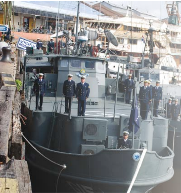
Navios da Comissão "Platina - 2010" atracados em Assunção

A Flotilha de Mato Grosso realizou, no período de 4 a 25 de maio de 2010, a Comissão "Platina", no trecho compreendido entre as cidades de Ladário, no Mato Grosso do Sul e Assunção, na República do Paraguai. A comissão teve o propósito de contribuir para o incremento do adestramento dos navios da Flotilha, exercer ação de presença e estreitar as relações de amizade com a Armada do Paraguai.