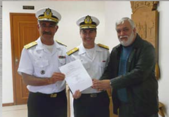
Entrega da doação de peças de vestuário ao Secretário de Cidadania e Assistência Social do Rio Grande