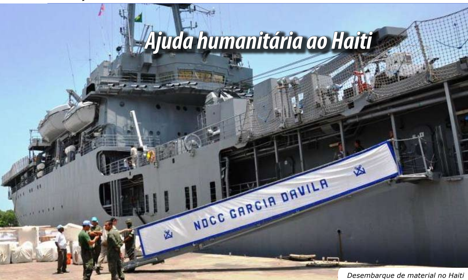
Desembarque de material no Haiti

O Navio de Desembarque de Carros de Combate (NDCC) "Almirante Saboia" retornou de sua segunda comissão de Ajuda Humanitária ao Haiti - "Haiti X", no dia 9 de junho de 2010. Nessa comissão, o navio transportou cerca de 600 toneladas de material doado por instituições públicas e privadas, como barracas para desabrigados, medicamentos, alimentos, água, leite e fraldas.