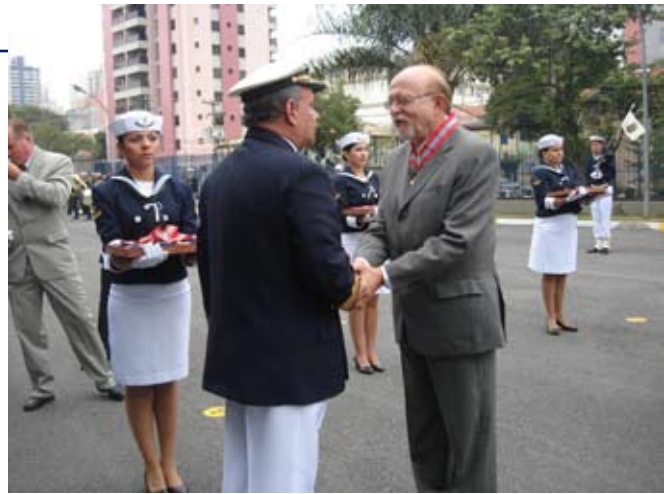
Condecoração do Governador Alberto Goldman