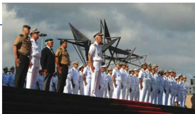
Cerimônia no Monumento Nacional aos Mortos da 2ª Guerra

Dando continuidade às atividades, a Banda Sinfônica do Corpo de Fuzileiros Navais participou do Concerto Sinfônico em homenagem à Marinha do Brasil, no dia 16 de junho, na Igreja da Candelária. O evento foi aberto ao público e reuniu centenas de espectadores.