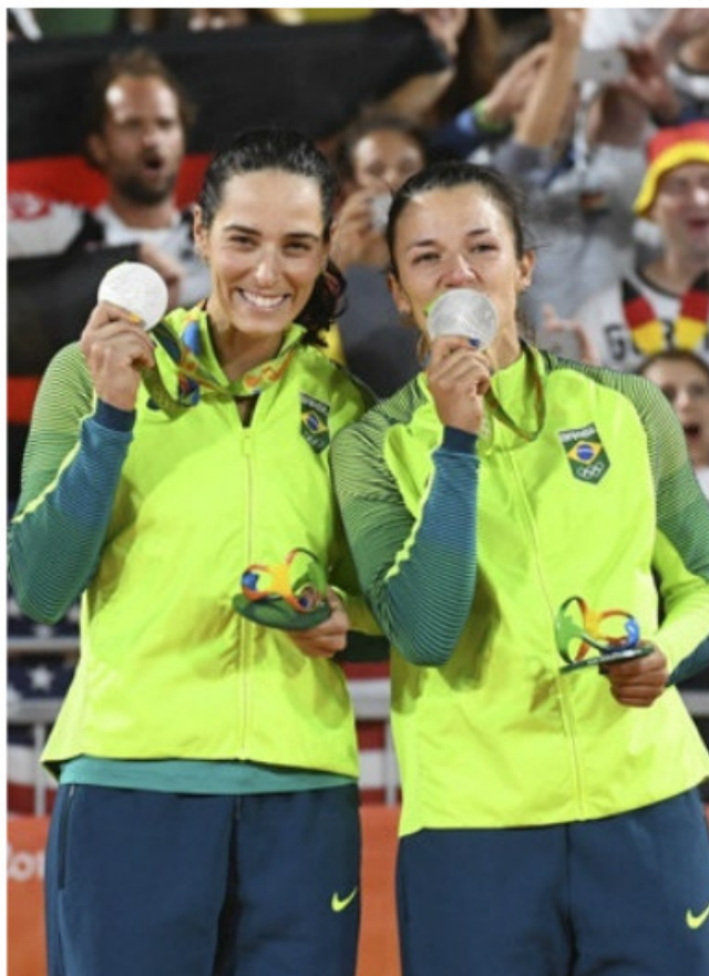
3 SG Ágatha e 3 SG Bárbara