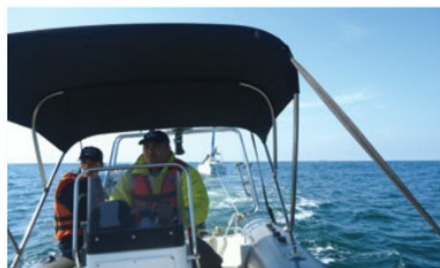
Veleiro "Taipan" foi rebocado por embarcação da Capitania dos Portos de Santa Catarina

O Com5ºDN empregou uma aeronave do 5º Esquadrão de Helicópteros de Emprego Geral e um Navio Patrulha nas buscas. A Força Aérea Brasileira também auxiliou com uma aeronave P-95.