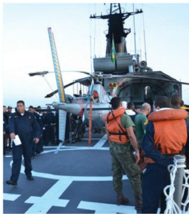
Exercício de crache no convoo do NPaFlu "Raposo Tavares"

avarias operacionais; sinais por bandeiras e holofotes; operações aéreas, com pick up nos três navios; acidente com aeronave a bordo; perda de governo; e crache no convoo do NPaFlu "Raposo Tavares".