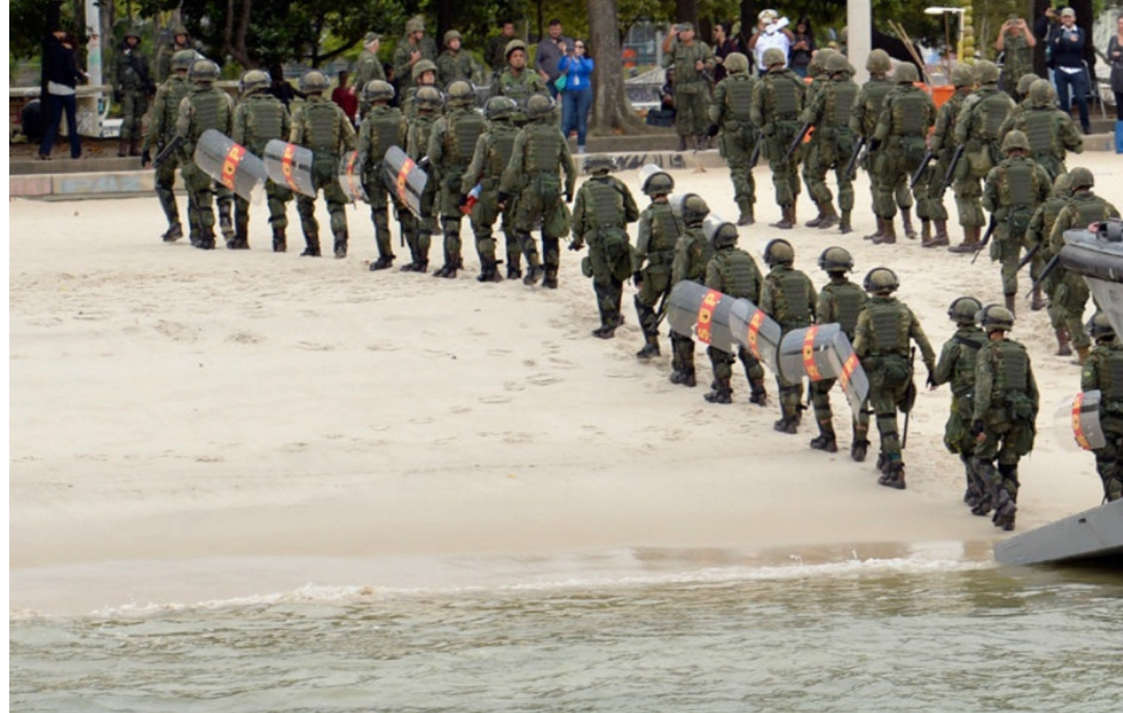
Militares desembarcam na praia do Flamengo durante exercício de simulação de distúrbio

Aproximadamente 22 mil militares das Forças Armadas atuando na segurança e defesa dos Jogos Olímpicos e Paralímpicos 2016. As ações são conjuntas com os órgãos de inteligência e segurança pública e estão sendo realizadas no Rio de Janeiro (RJ), sede das competições, e em cidades que recebem delegações ou sediam partidas de Futebol.