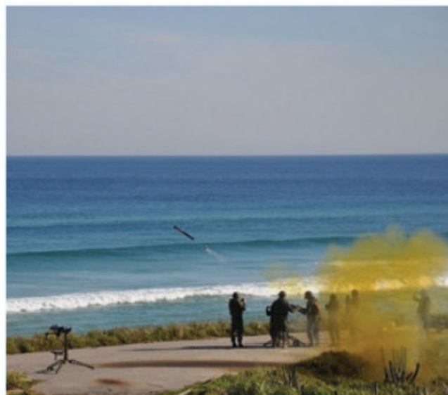
Lançamento de Míssil Superfície/Ar Mistral em treinamento

SABER M-60 e Postos de Vigilância estabelecidos pela própria Unidade. As ações contaram ainda com