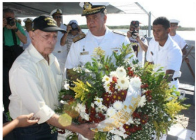
Coroa de Flores sendo lançada na Baía do Guajará

No Com9ºDN, o evento foi promovido a bordo do Navio Patrulha "Raposo Tavares". Uma coroa de flores foi lançada no rio Solimões.