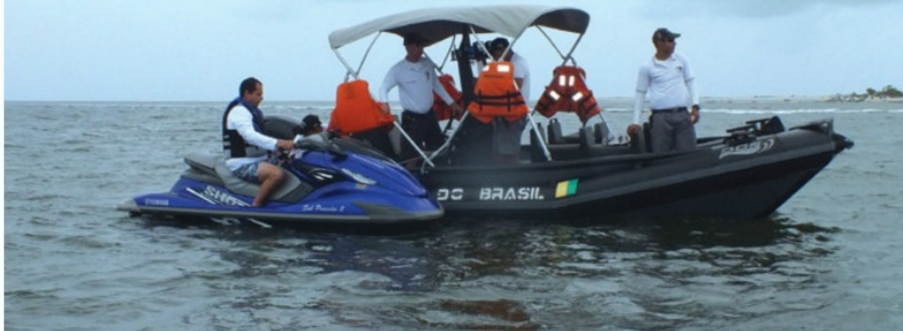
Equipe de fiscalização da Marinha do Brasil

A Superintendência de Segurança do Tráfego Aquaviário da Diretoria de Portos e Costas (DPC) registrou uma queda significativa de acidentes envolvendo motos aquáticas durante o primeiro semestre de 2016, em comparação ao mesmo período de 2015. Até o momento foram notificados 11 casos, contra 29 ocorridos nos primeiros seis meses do ano passado, o que representa uma redução de 60%. Cabe ressaltar que no período houve um acréscimo de inscrições de mais de 3% no quantitativo desse tipo de embarcação. Atualmente estão inscritas no Sistema de Gerenciamento de Embarcações (SIGGEMB) da DPC um total de 89.566 motos aquáticas em todo o Brasil.