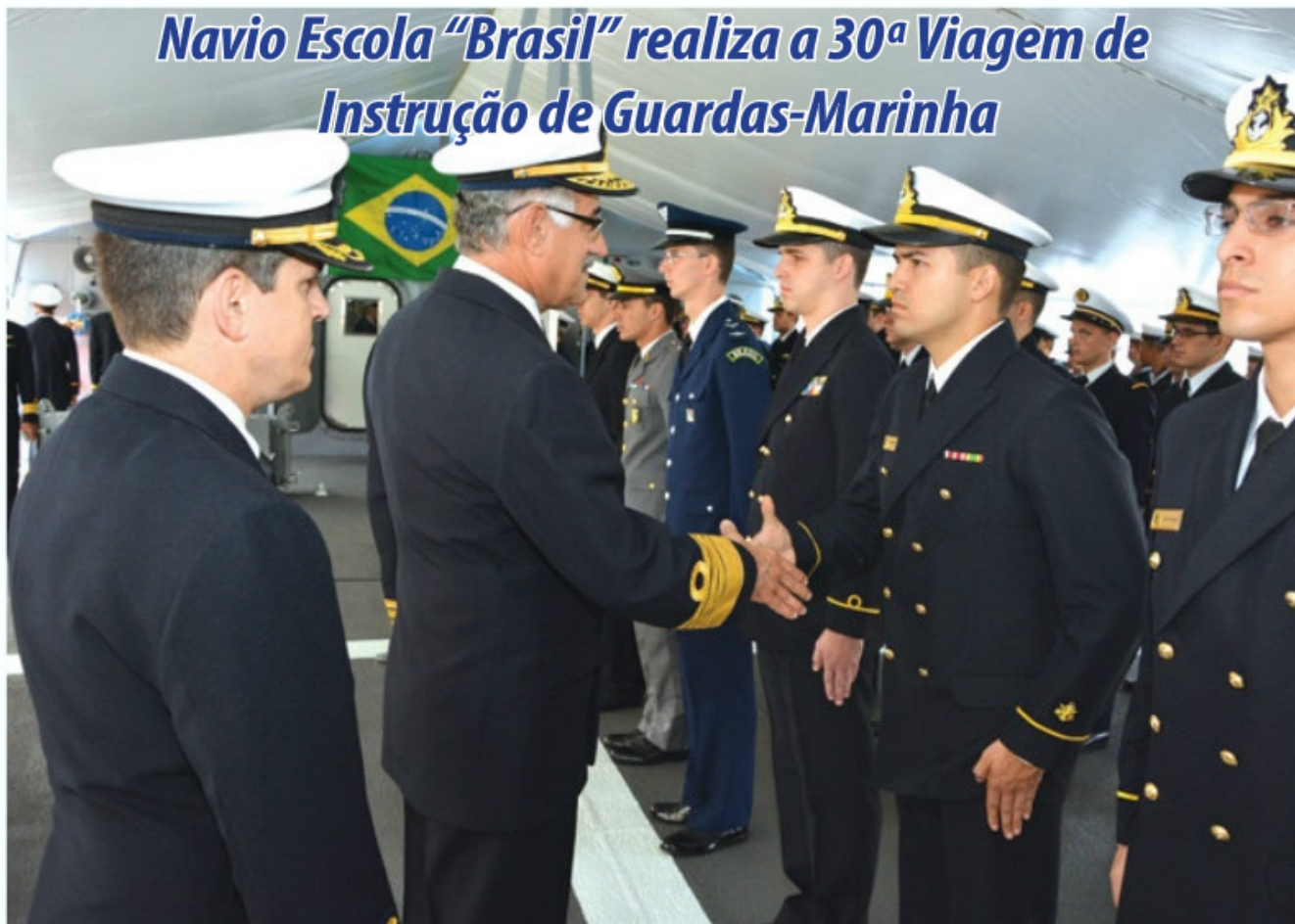
Comandante de Operações Navais cumprimenta os Guardas-Marinha que fazem a viagem de instrução