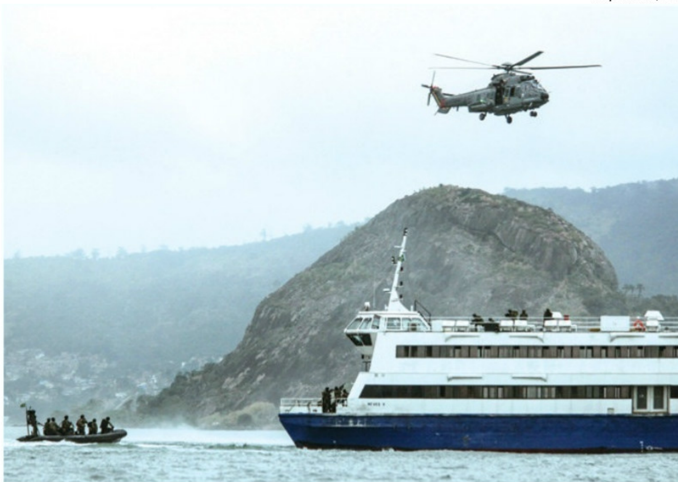
Treinamento simulado de sequestro de uma embarcação de passageiros na Baía de Guanabara