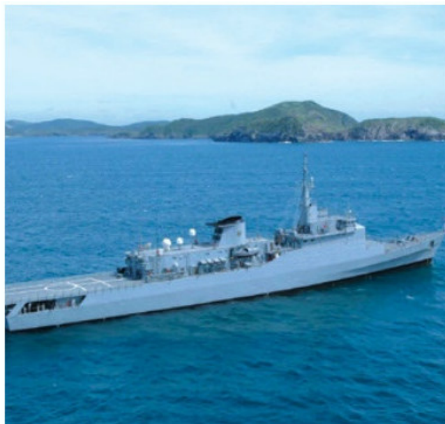
Navio Escola Brasil

Neste ano, o navio visitará 19 portos em 14 países. Ao todo serão 148 dias de viagem, passando por Salvador (BA), Las Palmas (Espanha), Sète (França), Mônaco, Civitavecchia (Itália), Barcelona (Espanha), Lisboa (Portugal), Londres (Inglaterra), Hamburgo (Alemanha), São Petesburgo (Rússia), Estocolmo (Suécia), Amsterdã (Holanda), Le Havre (França), Baltimore (EUA) e Jacksonville (EUA), Havana (Cuba), Kingston (Jamaica), Cartagena (Colômbia) e Fortaleza (CE).