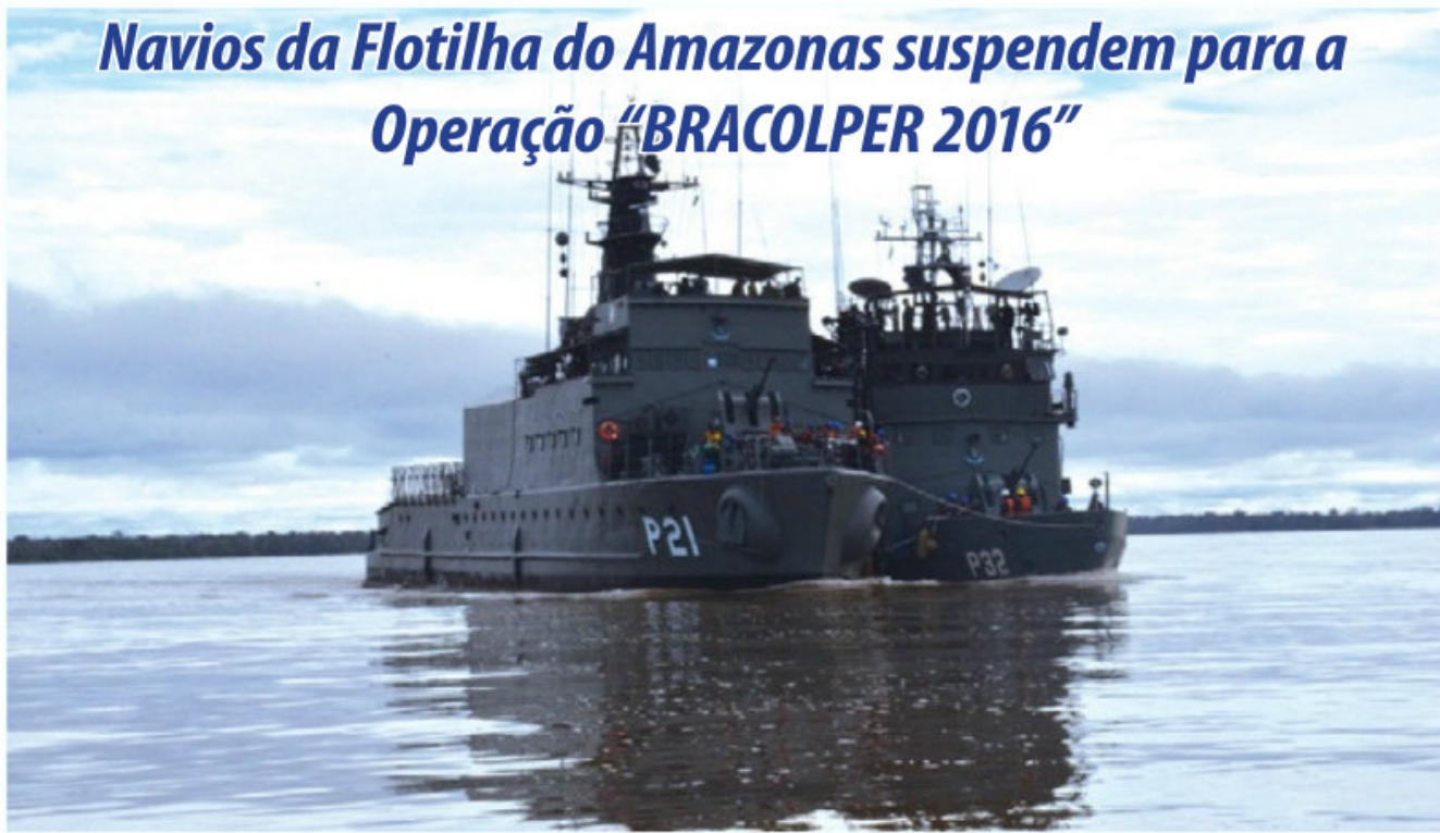
Exercício de Transferência de carga entre os NPaFlu "Raposo Tavares" e "Amapá"

Os Navios Patrulha Fluvial (NPaFlu) "Raposo Tavares" e "Amapá", o Navio de Assistência Hospitalar "Carlos Chagas" e uma aeronave UH-12 do 3º Esquadrão de Helicópteros de Emprego Geral, subordinados ao Comando do 9º Distrito Naval, desatracaram, no dia 8 de julho, do Cais da Estação Naval do Rio Negro, em Manaus (AM), para realizarem a Operação "BRACOLPER 2016". Participaram do Grupo-Tarefa 62 militares da Marinha do Brasil, além de um Oficial destacado do Exército Brasileiro.