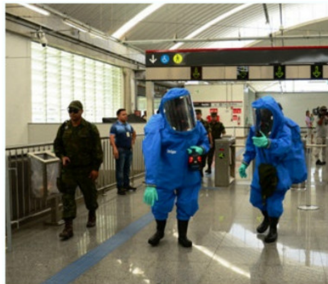
Simulação de atentado no metrô de Salvador

Participaram do exercício, o Navio Patrulha Fluvial "Pedro Teixeira", uma aeronave do 3º Esquadrão de Helicópteros de Emprego Geral, uma Lancha de Ação Rápida, uma Lancha de Apoio ao Ensino e Patrulha da Capitania Fluvial da Amazônia Ocidental (CFAOC), e cerca de 100 militares.