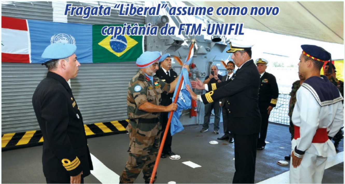
Handover do navio capitânia da FTM-UNIFIL

Dando continuidade à liderança brasileira na Força-Tarefa Marítima (FTM) da Força Interina das Nações Unidas no Líbano (United Nations Interim Force in Lebanon – UNIFIL), a Fragata "Liberal" tornou-se, em 15 de setembro, o novo capitânia da Força, em substituição à Fragata "Independência", que concluiu um período de seis meses na missão.