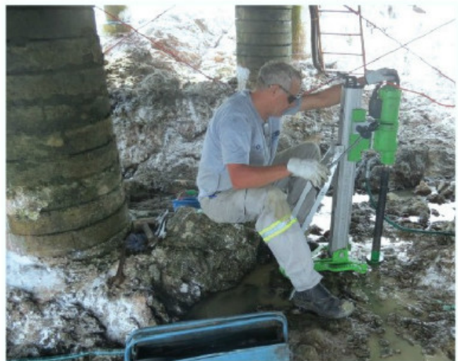
Técnico da Ekiye-C trabalha na análise do solo do arquipélago

do ano de 1998. Em virtude de ser danificada pelo poder das ondas do oceano Atlântico, a segunda estação científica foi erguida no ano de 2008, em local um pouco mais ao centro da ilha principal, a fim de ficar mais protegida da fúria do mar. Essa última mantém-se no local até os dias atuais.