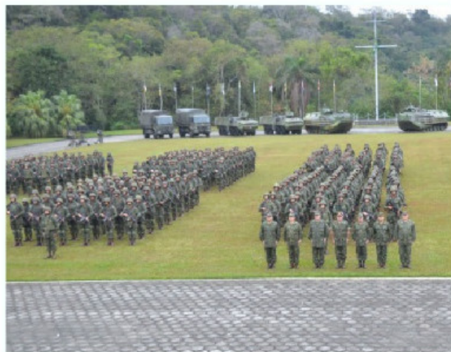
Tropas que atuaram na segurança dos jogos olímpicos em cerimônia de encerramento de operação

Os Centros de Coordenação Tático Integrado do CDS-Copacabana e o de Salvador tiveram como propósito potencializar o esforço interagências de enfrentamento ao terrorismo durante os jogos.