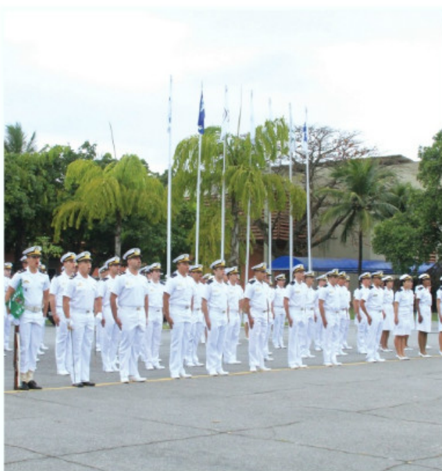
Cerimônia militar no Centro de Instrução Almirante Graça Aranha

Ensino Fundamental Visconde de Mauá estiveram presentes.