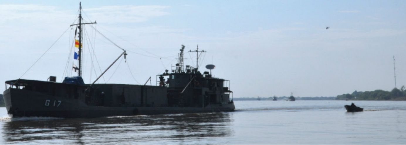
Navio de Apoio Logístico Fluvial "Potengi" durante a Operação Fronteira Sul

Os navios da Marinha do Brasil (MB) subordinados ao Comando da Flotilha de Mato Grosso desatracaram, no dia 5 de outubro, em direção a Porto Murtinho (MS), iniciando a Operação "Fronteira Sul".