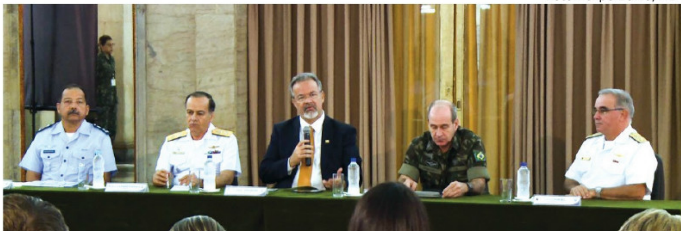
Ministro da Defesa e representantes das Forças Armadas falam sobre a atuação nos Jogos Rio-2016

O Ministro da Defesa, Raul Jungmann, e representantes da Marinha, do Exército e da Força Aérea Brasileira reuniram-se no Comando Militar do Leste, no Rio de Janeiro (RJ), para apresentar à mídia os resultados das atividades de segurança e defesa realizadas durante os Jogos Olímpicos.