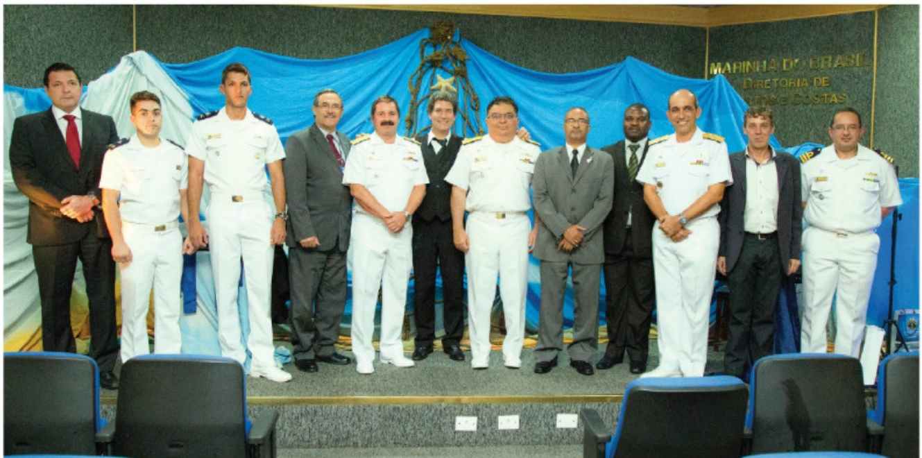
Militares e autoridades prestigiaram a apresentação

A peça enalteceu os descobrimentos portugueses pelos mares e apresentou uma lição para se encarar os desafios da vida. A apresentação foi uma viagem pelos feitos históricos dos navegadores, realçados pela poesia de Fernando Pessoa, Manuel Bandeira, Carlos Drummond de Andrade e Camões.