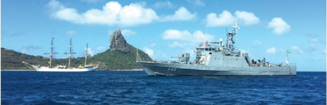
O "Grajaú" e o veleiro dinamarquês próximos à ilha de Fernando de Noronha

O Navio Patrulha "Grajaú", subordinado ao Comando do Grupamento de Patrulha Naval do Nordeste, realizou, no período de 5 a 14 de setembro, a comissão "PATNAV NORTE VIII", quando desenvolveu ações de patrulha e inspeção naval por uma vasta área da Zona Econômica Exclusiva, implementando e fiscalizando o cumprimento das leis e regulamentos em Águas Jurisdicionais Brasileiras, passando pelo Atol das Rocas e chegando a aproximadamente 200 milhas náuticas a nordeste do Arquipélago de Fernando de Noronha.