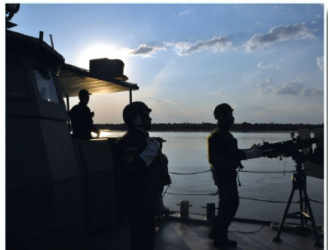
Exercício na região de Porto Murtinho

A Operação encerrou-se no dia 21 de outubro, com a atracação dos navios no Complexo Naval de Ladário, no Mato Grosso do Sul.