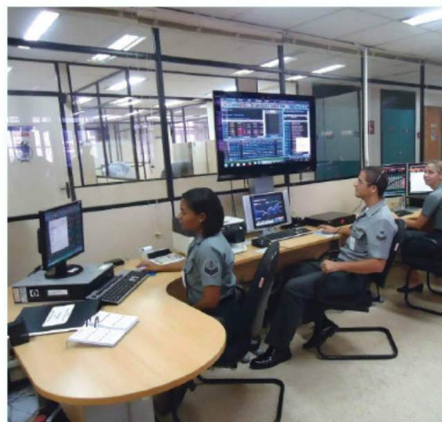
Mesa de Operações Financeiras

na capacitação profissional dos militares que atuam na Mesa de Operações Financeiras, permitindo que nosso pessoal esteja ambientado e sempre atualizado em relação às regras de mercado e às oportunidades por ele oferecidas.