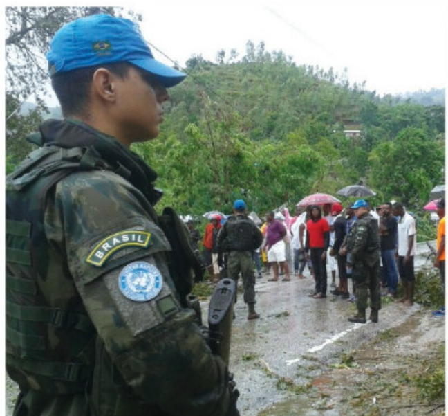
Militares da Marinha em área atingida pelo furacão

Estabelecidos na capital Porto Príncipe, os Fuzileiros Navais participantes da Missão das Nações Unidas para Estabilização do Haiti receberam a missão de se encaminhar até a região mais atingida. Com sua capacidade expedicionária, a tropa de Fuzileiros Navais, atuando em conjunto com a Companhia de Engenharia do Exército Brasileiro, já chegou às cidades mais afetadas como Petit Goave, onde a ponte que dá acesso ao sul do país foi danificada. Eles trabalham intensamente na ajuda humanitária e no controle da população local.