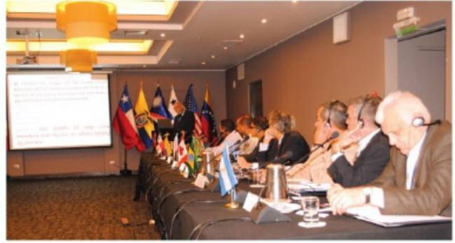
Membros dos países participantes durante reunião

dos países membros, tais como Argentina, Canadá, Chile, Equador, Estados Unidos, Panamá, Peru e Ilhas Marshall (este como convidado), que participaram do encontro por meio de seus representantes da Autoridade Marítima.