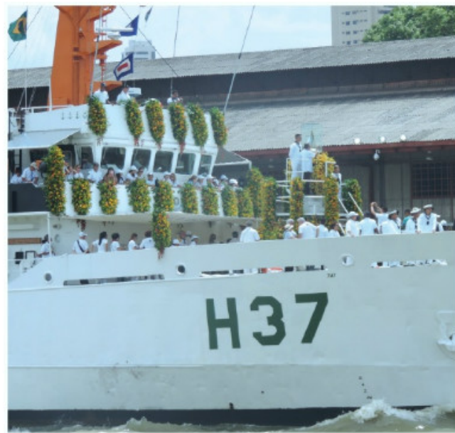
Navio Hidroceanoográfico (NHo) "Garnier Sampaio" conduz imagem peregrina de Nossa Senhora de Nazaré