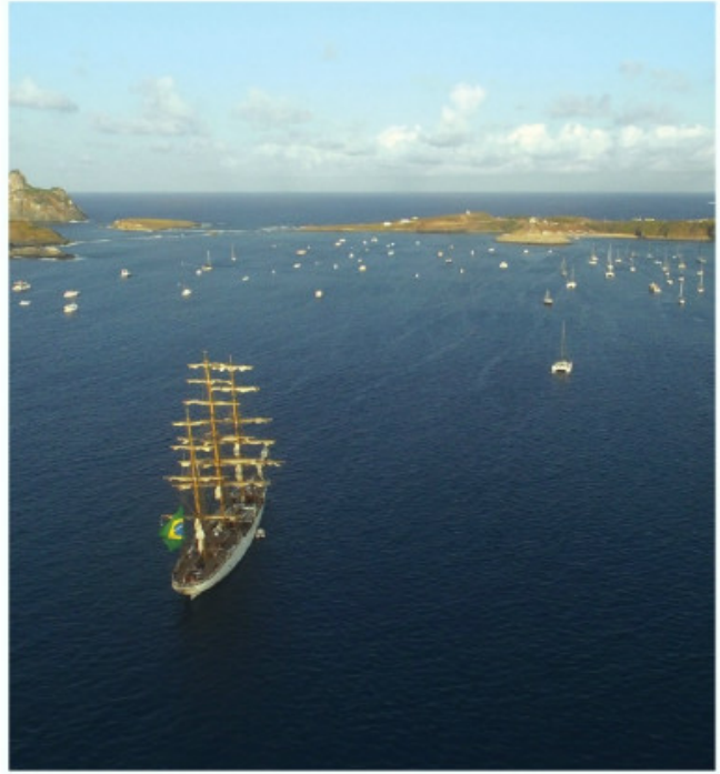
Navio Veleiro "Cisne Branco" acompanhou a regata até Fernando de Noronha

sagrou-se tricampeão da Refeno. A regata é promovida pelo Cabanga Iate Clube de Pernambuco e tem nove classes. O percurso entre o Recife e o Arquipélago de Fernando de Noronha é equivalente a 545 quilômetros.