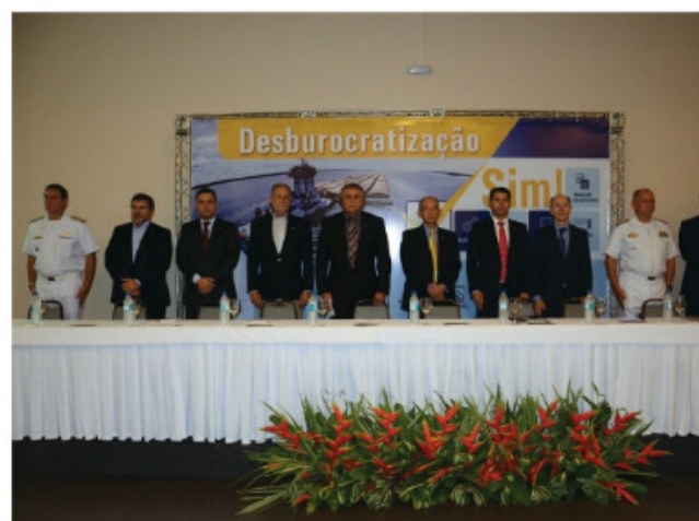
Autoridades participantes do evento