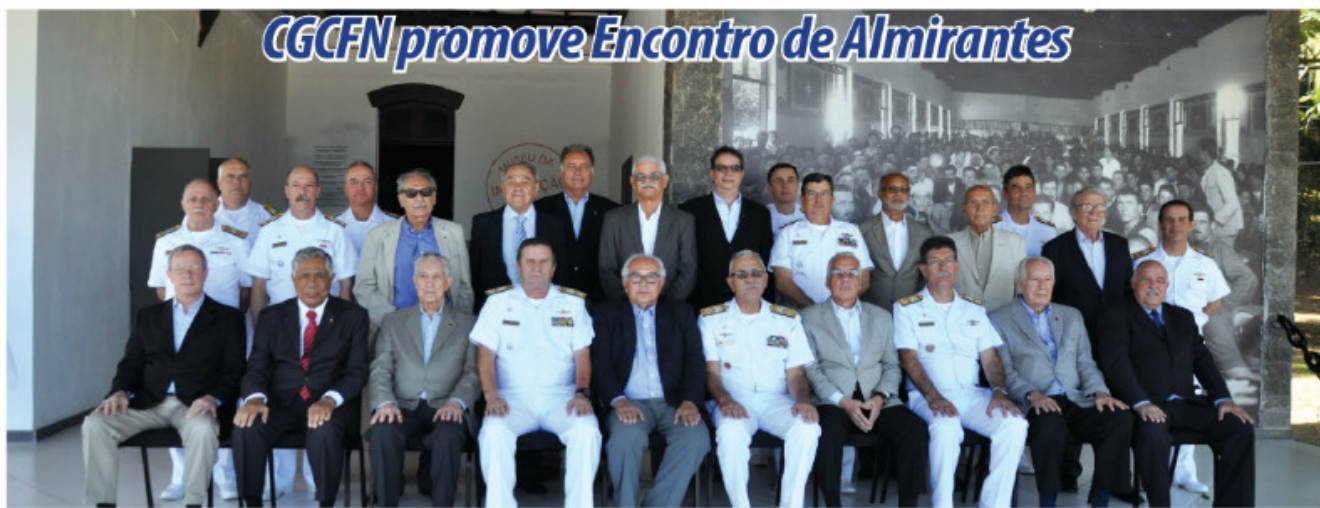
Encontro reuniu Almirantes no Comando da Tropa de Reforço

O Comando-Geral do Corpo de Fuzileiros Navais promoveu, no dia 22 de setembro, no Comando da Tropa de Reforço, na Ilha das Flores (RJ), o Encontro de Almirantes, com a presença de 28 Oficiais-Generais da ativa, da reserva e reformados. O objetivo do evento anual é atualizar os militares quanto à situação do Corpo de Fuzileiros Navais, nas suas diferentes áreas de atuação.