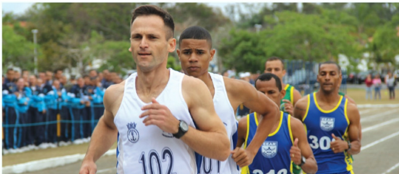
Marinha do Brasil conquistou primeiro lugar geral na MAREXAER

Realizada em Guaratinguetá (SP), no período de 24 a 30 de setembro, a XXI MAREXAER, competição esportiva entre as escolas de formação de sargentos das Forças Armadas, teve a Marinha do Brasil (MB) como vencedora.