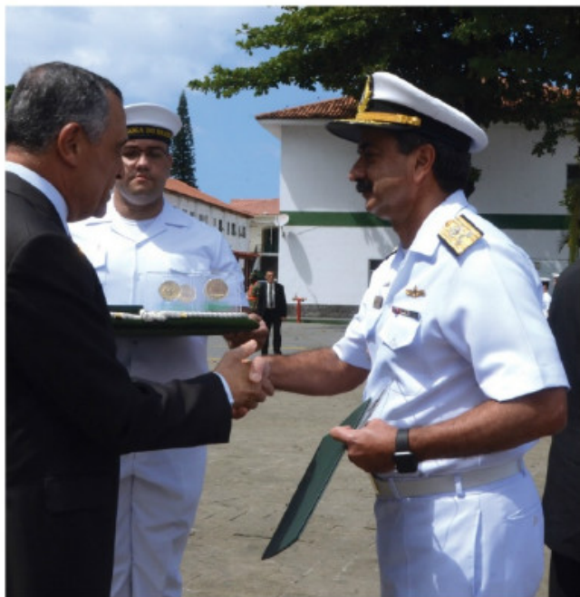
Entrega de títulos de Hidrógrafos Honorários

Houve ainda, os lançamentos dos Anais Hidrográficos de 2015, do Terceiro Plano Cartográfico Náutico Brasileiro e da Carta Náutica do Porto de Itajaí, nas suas versões em papel e eletrônica.