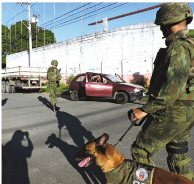
Fuzileiros Navais em abordagem a veículo, em Vitória (ES)

Os Fuzileiros Navais receberam como área de atuação o município de Serra, distante 33 km da capital, bem como de áreas próximas ao Porto de Vitória e à Escola de Aprendizes-Marinheiros. A ação mobilizou mais de 400 militares, que atenderam 68 ocorrências, entre elas, denúncias de invasões a domicílio, arrastões, apreensões de drogas e furtos a estabelecimentos comerciais.