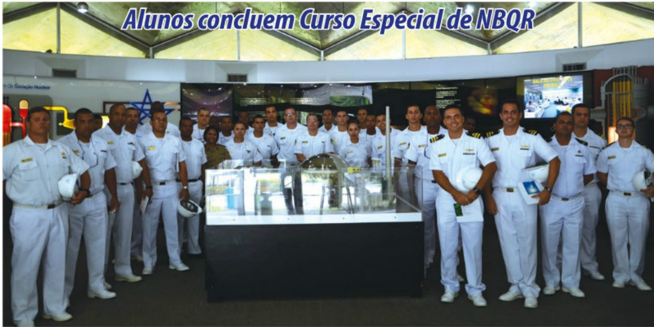
Alunos visitam as usinas de Angra I e II

No dia 24 de março, 30 alunos, sendo quatro oficiais e 26 praças, formaram-se no Curso Especial de Defesa Nuclear Biológica Química e Radiológica (NBQR). Coordenado pelo Centro de Adestramento Almirante Marques de Leão, o curso teve início no dia 23 de janeiro, com o objetivo de preparar oficiais e praças da Marinha do Brasil e das outras Forças Armadas e Auxiliares, bem como militares de países estrangeiros, para o exercício de funções relacionadas à defesa nuclear, biológica, química e radiológica.