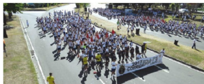
Rio de Janeiro (RJ)

Em Guarujá (SP), a Capitania dos Portos de São Paulo contou com a presença de mais de 300 participantes. A largada foi na Praça das Bandeiras, fazendo um percurso de 3 km.