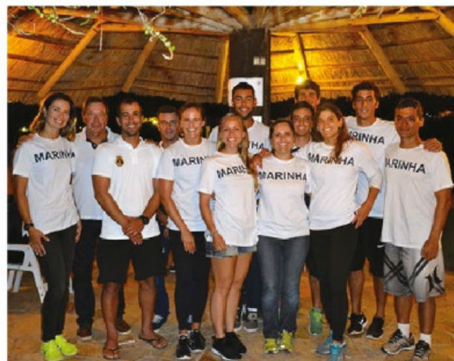
Atletas da Marinha que participaram da competição

A Capitania Fluvial de Porto Alegre participou do evento com a fiscalização do tráfego aquaviário e das normas de segurança da navegação.