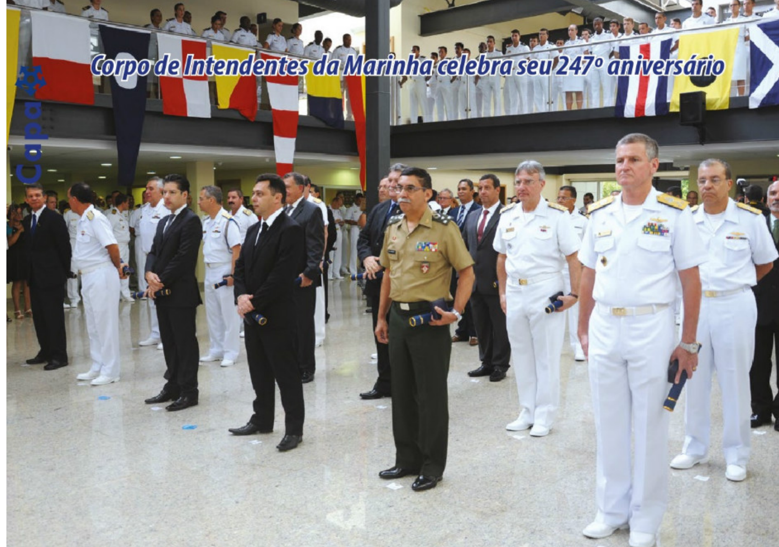
Solenidade de comemoração ao 247º aniversário do Corpo de Intendente da Marinha

Foi no Centro de Instrução e Adestramento Almirante Newton Braga (CIANB) que, no dia 9 de março, comemorou-se o 247º aniversário do Corpo de Intendentes da Marinha (CIM). Reunindo Oficiais Intendentes, da ativa e da reserva, a cerimônia militar foi presidida pelo Comandante da Marinha, Alte Esq Eduardo Bacellar Leal Ferreira.