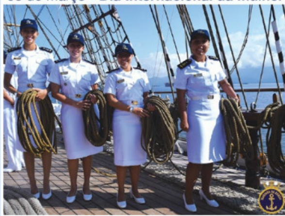
08 de Março - Dia Internacional da Mulher