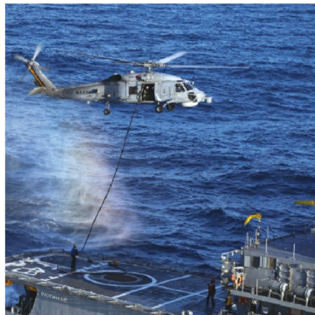
Reabastecimento em Voo

Durante a fase de porto, nos dias 18 e 19 de fevereiro, os navios ficaram abertos a visitação pública e mais de duas mil pessoas puderam conhecer os navios e aeronaves da MB, além de participarem do cerimonial à Bandeira Nacional, por ocasião do pôr do sol.