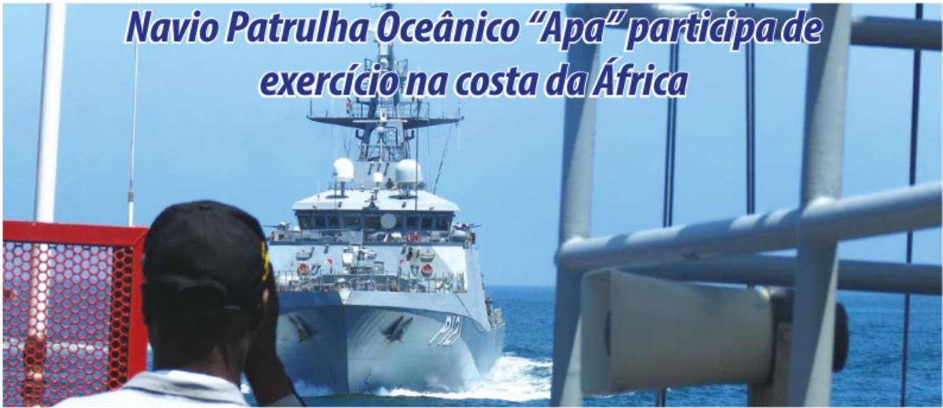
NPaOc "Apa" durante os exercícios

O Navio Patrulha Oceânico (NPaOc) "Apa", partiu, no dia 20 de fevereiro, da Base Naval do Rio de Janeiro, para participar do exercício "Obangame Express/2017", que envolve militares de países da África, Américas e Europa. O objetivo do treinamento é capacitar os países participantes para prover a segurança marítima da área do Golfo da Guiné contra as ações de pirataria, tráfico de drogas e armas, sequestro, pesca ilegal e outros ilícitos praticados na região.