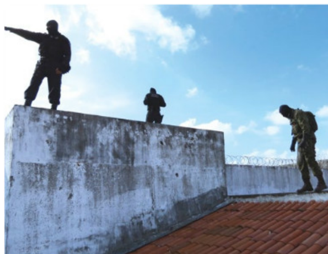
Militares inspecionam telhado em presídio no RN

Reguladas pela Constituição Federal, as operações de GLO concedem, provisoriamente, aos militares das Forças Armadas a faculdade de atuar com poder de polícia em graves situações de perturbação da ordem. Essas atuações são autorizadas exclusivamente pelo Presidente da República e ocorrem em casos que há o esgotamento das forças tradicionais de segurança pública.