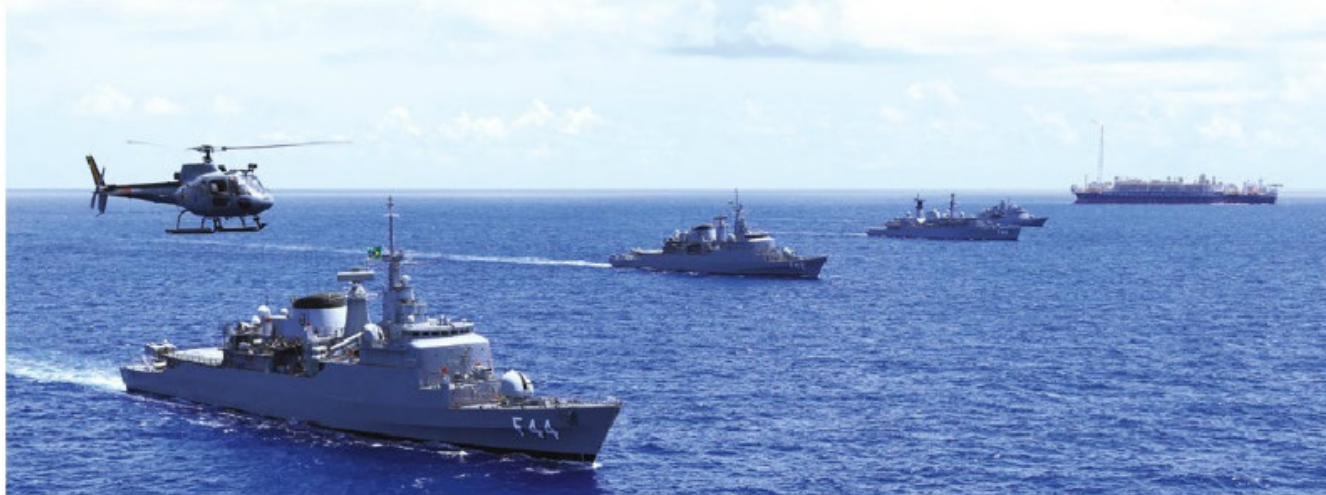
Exercício de manobras táticas

A Marinha do Brasil (MB) realizou, na área marítima compreendida entre o Rio de Janeiro (RJ) e Santos (SP), a Operação "ADEREX I 2017", no período de 14 a 22 de fevereiro. Sob a coordenação do Comando da 1ª Divisão da Esquadra, foram conduzidos exercícios envolvendo meios navais e aeronavais, com o propósito de aperfeiçoamento dos militares e das unidades da Esquadra.