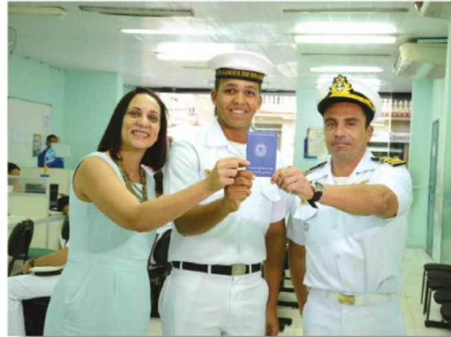
Marinheiro recruta recebe carteira de trabalho

mecânico de motor de popa e brigada de incêndio. O projeto é desenvolvido pelo Serviço de Recrutamento Distrital do Com9ºDN.