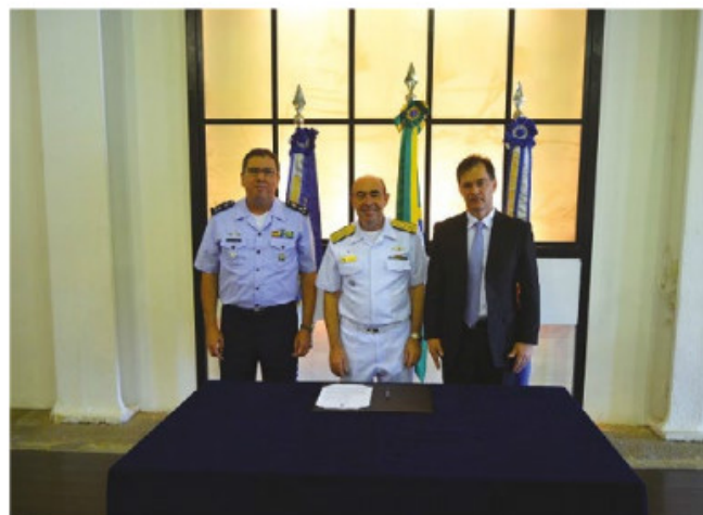
Autoridades selam acordo para operacionalização do Projeto Espacial

importância do acordo: "O setor espacial, destacado na Estratégia Nacional de Defesa, alcança um novo patamar com esse projeto, com impactos positivos para a defesa do País", afirmou. Ele também falou sobre estabelecer parcerias em grandes projetos e o orgulho da Marinha em estar contribuindo para essa conquista.