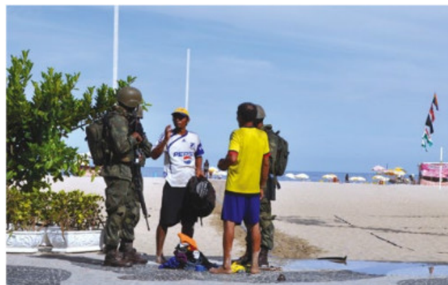
Abordagem na orla carioca

A ação na cidade do Rio de Janeiro foi uma solicitação do Governador do estado. Para atender ao pedido, foi constituído um Grupamento Operativo de Fuzileiros Navais, com poder de polícia para patrulhar as áreas do Caju, Cais do Porto, aeroporto Santos Dumont, Marina da Glória, Aterro do Flamengo, Copacabana, Lagoa, Leblon e Ipanema. As atividades nas ruas envolveram mais de mil homens, que realizaram o patrulhamento dos bairros, montando pontos de bloqueio, bem como outras atividades de segurança pública. Foram atendidas mais de 50 ocorrências, entre elas, abordagens a elementos suspeitos, apreensões e prisões.