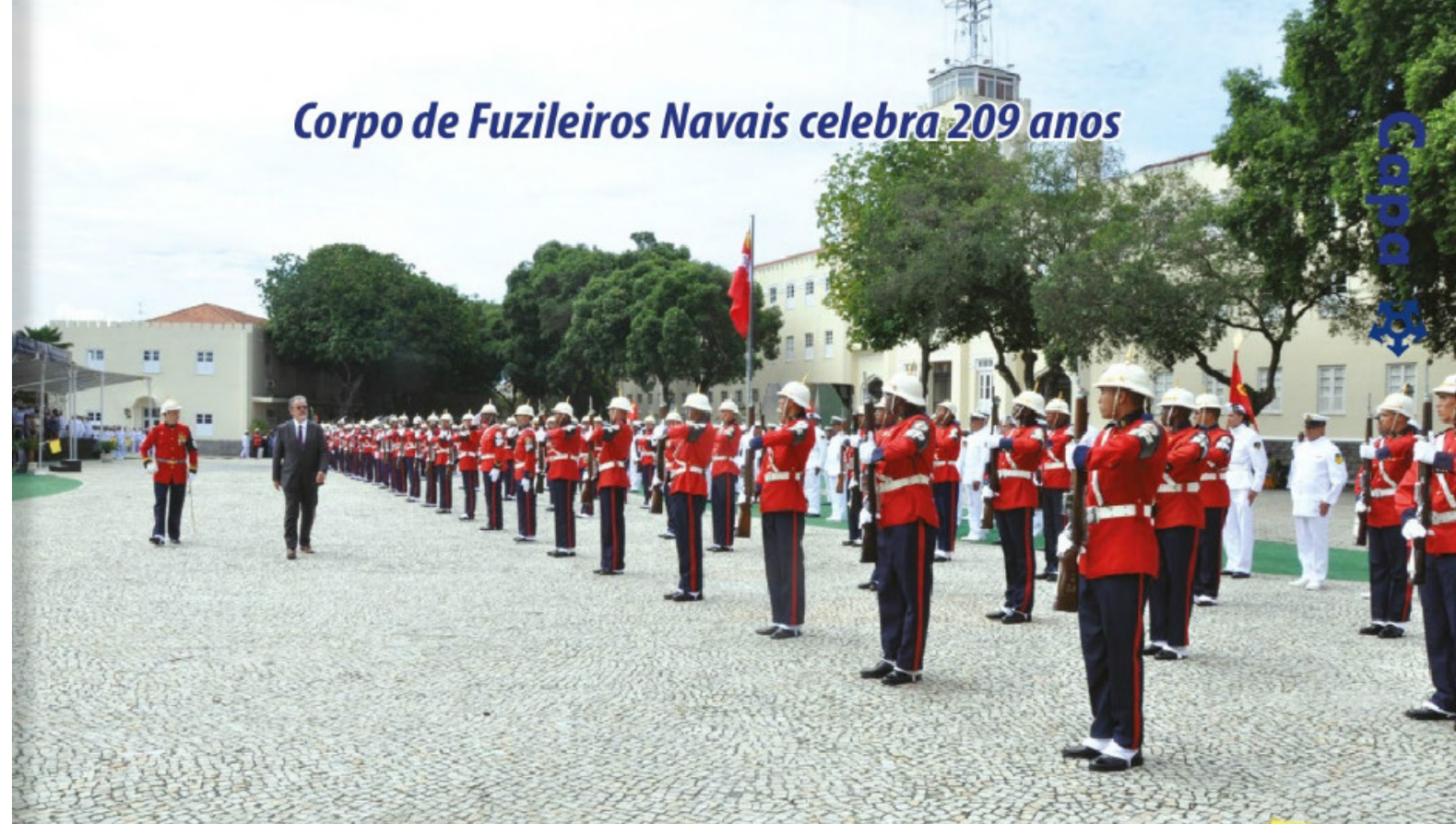
Ministro da Defesa em revista à tropa

A cerimônia alusiva aos 209 anos do Corpo de Fuzileiros Navais (CFN) foi realizada pelo Comandante-Geral do Corpo de Fuzileiros Navais (CGCFN), no dia 7 de março, na Fortaleza de São José da Ilha das Cobras, no Rio de Janeiro (RJ). Presidida pelo Ministro da Defesa, Raul Jungmann, a cerimônia foi marcada pela realização de homenagens, a começar pela entrega da Medalha Mérito Anfíbio a 76 militares da Marinha do Brasil, entre oficiais e praças. Essa condecoração é concedida como reconhecimento àqueles que, em exercícios e operações, distinguiram-se pela exemplar dedicação à profissão e pelo interesse no aprimoramento de sua condição de combatente anfíbio.