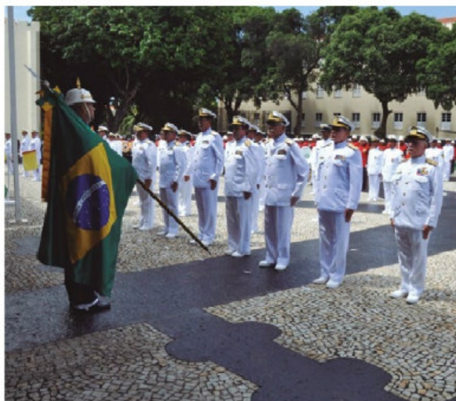
Autoridades prestigiaram a solenidade

Dentre as principais atividades exercidas pelos Fuzileiros Navais, atualmente, destacam-se: a Missão das Nações Unidas para a Estabilização no Haiti e a Força Interina das Nações Unidas no Líbano; a segurança das Embaixadas do Brasil no Paraguai, na Bolívia e no Haiti; operações de Garantia da Lei e da Ordem, em diversos pontos do País; e à retomada da execução das Operações Anfíbias, com a realização de uma "UanfEx" e o retorno da "Operação Dragão", na sua XXXVII edição, realizada no litoral capixaba com a presença de aproximadamente quatro mil militares.