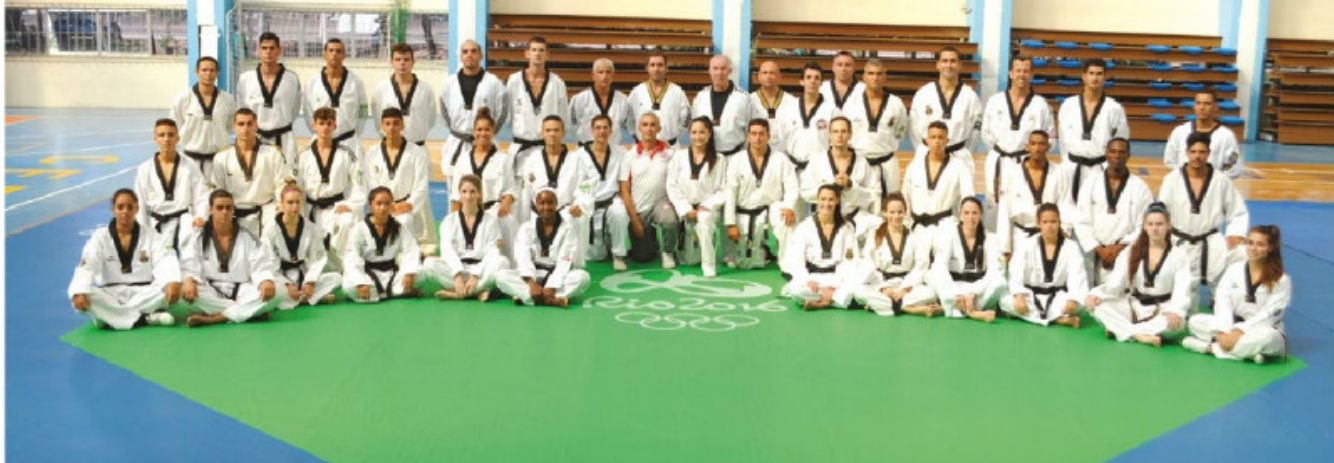
Atletas que participaram do Training Camp, no CEFAN

Com o intuito de proporcionar a atletas o contato com o novo sistema moderno de colete eletrônico utilizado nos Jogos Olímpicos Rio 2016, o Centro de Educação Física Almirante Adalberto Nunes (CEFAN) recebeu, entre os dias 13 e 17 de fevereiro, 35 atletas e 10 técnicos para o Training Camp Brasileiro de Taekwondo, visando elevar o nível técnico da modalidade.