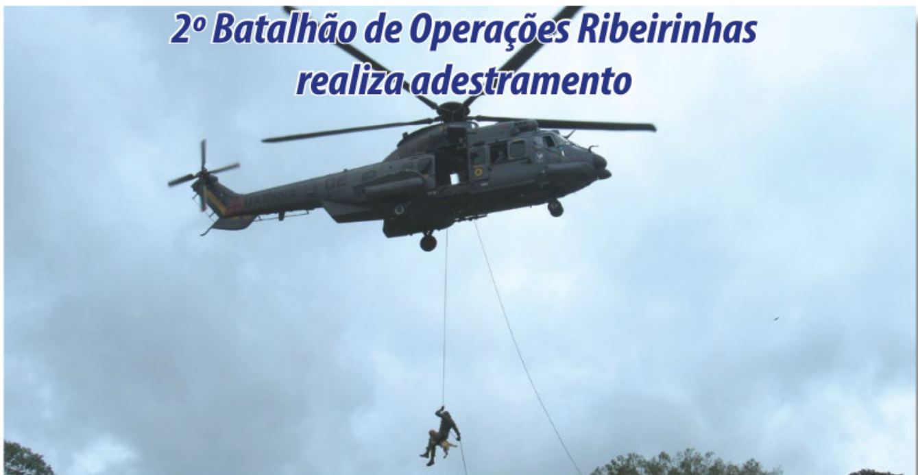
Militar do 2ºBtlOpRib executando o rapel com a cadela Hidra

Entre os dias 21 de fevereiro e 3 de março, o 2º Batalhão de Operações Ribeirinhas (2ºBtlOpRib) realizou o Adestramento para Mestre de Lançamento (ADEST-ML) com o emprego da aeronave UH-15 "Super Cougar", do 2º Esquadrão de Helicópteros de Emprego Geral, na área de instrução do Centro de Formação de Praças, da Polícia Militar do Pará.