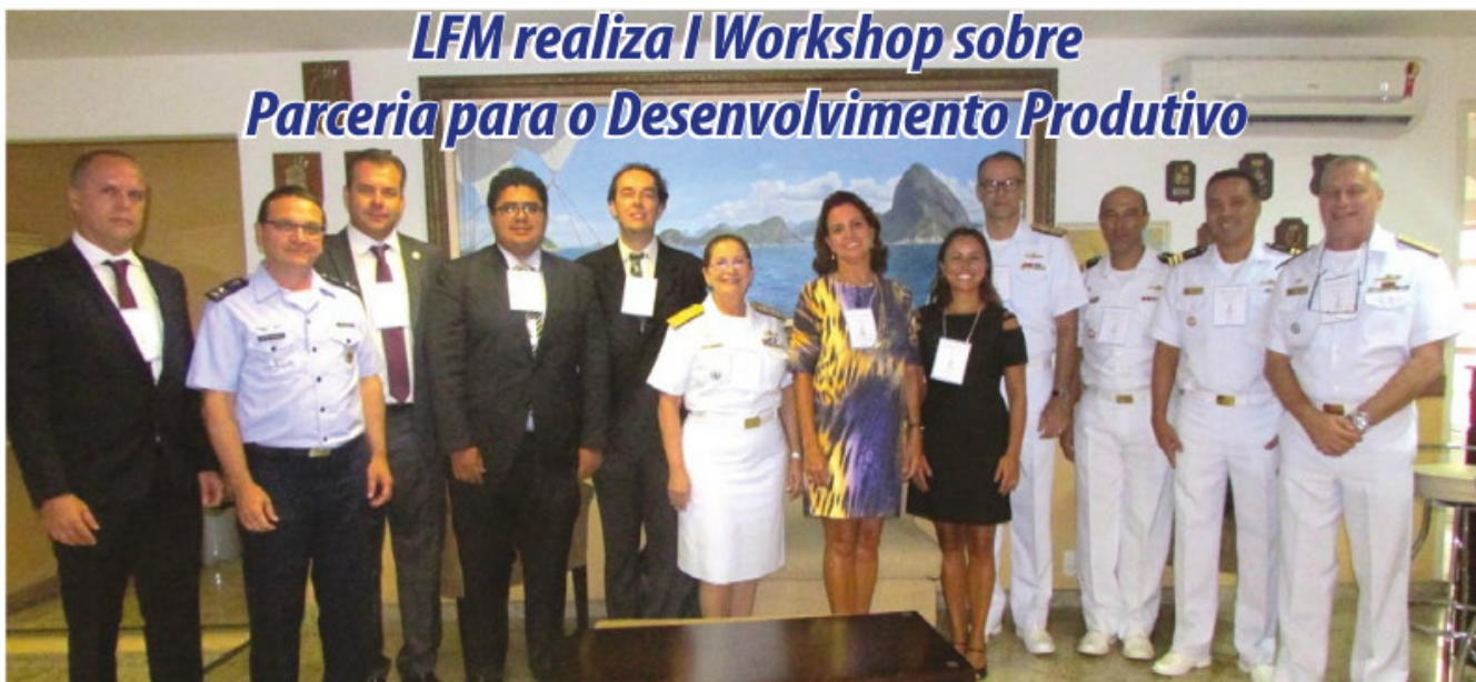
Militares e civis participaram do workshop

O Laboratório Farmacêutico da Marinha (LFM) realizou, no mês de fevereiro, o I Workshop sobre Parceria para o Desenvolvimento Produtivo (PDP). O evento teve como propósito abordar aspectos positivos e negativos da política de PDP, a visão jurídica dos contratos e a experiência dos laboratórios nesse tipo de parceria. Foram apresentadas palestras do Ministério da Saúde, da Consultoria Jurídica da União do Estado do Rio de Janeiro e do Laboratório Farmacêutico de Pernambuco.