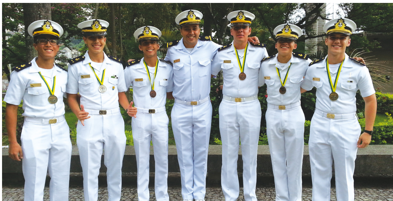
Premiação ocorreu na UERJ

No dia 5 de maio, uma delegação de alunos do Colégio Naval participou da cerimônia de premiação da Olimpíada Brasileira de Física das Escolas Públicas 2017 (OBFEP), realizada na Capela Ecumênica da Universidade do Estado do Rio de Janeiro (UERJ).