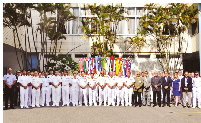
Integrantes do exercício multinacional

A coordenação do exercício permitiu estreitar o relacionamento da Marinha do Brasil com os países e órgãos participantes e, principalmente, aprimorar a coordenação internacional nos assuntos relativos à segurança marítima no Atlântico Sul.