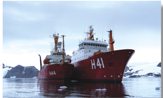
Navio de Apoio Oceanográfico "Ary Rongel" (H-44) e Navio Polar "Almirante Maximiano" (H-41)

emprego de meios têm contribuído para marcar a presença brasileira no continente, de forma pacífica e em consonância com a preservação do ambiente antártico. A missão é coordenada pela Comissão Interministerial para Recursos do Mar e tem a finalidade de contribuir para a consecução do Programa Antártico Brasileiro, iniciado em 1982, pela adesão do Brasil ao Tratado Antártico.