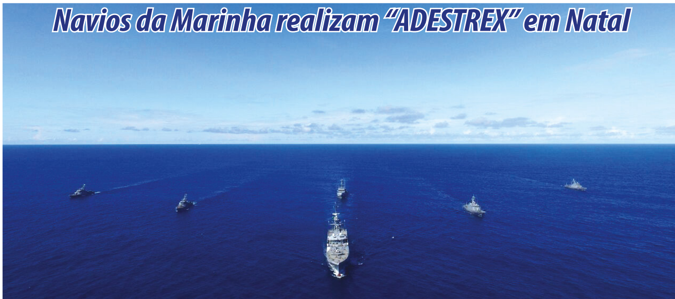
Navios em formatura

O litoral de Natal (RN) ficou movimentado nos dias 11 e 12 de abril. O Navio Patrulha Oceânico "Araguari", o Rebocador de Alto-Mar "Triunfo" e os Navios Patrulha "Macau", "Guaíba", "Grajaú" e "Graúna", subordinados ao Comando do Grupamento de Patrulha Naval do Nordeste, participaram da "ADESTREX". A atividade tem como principal propósito o adestramento das tripulações e a verificação do aprestamento dos meios navais, sendo realizada uma vez a cada semestre.