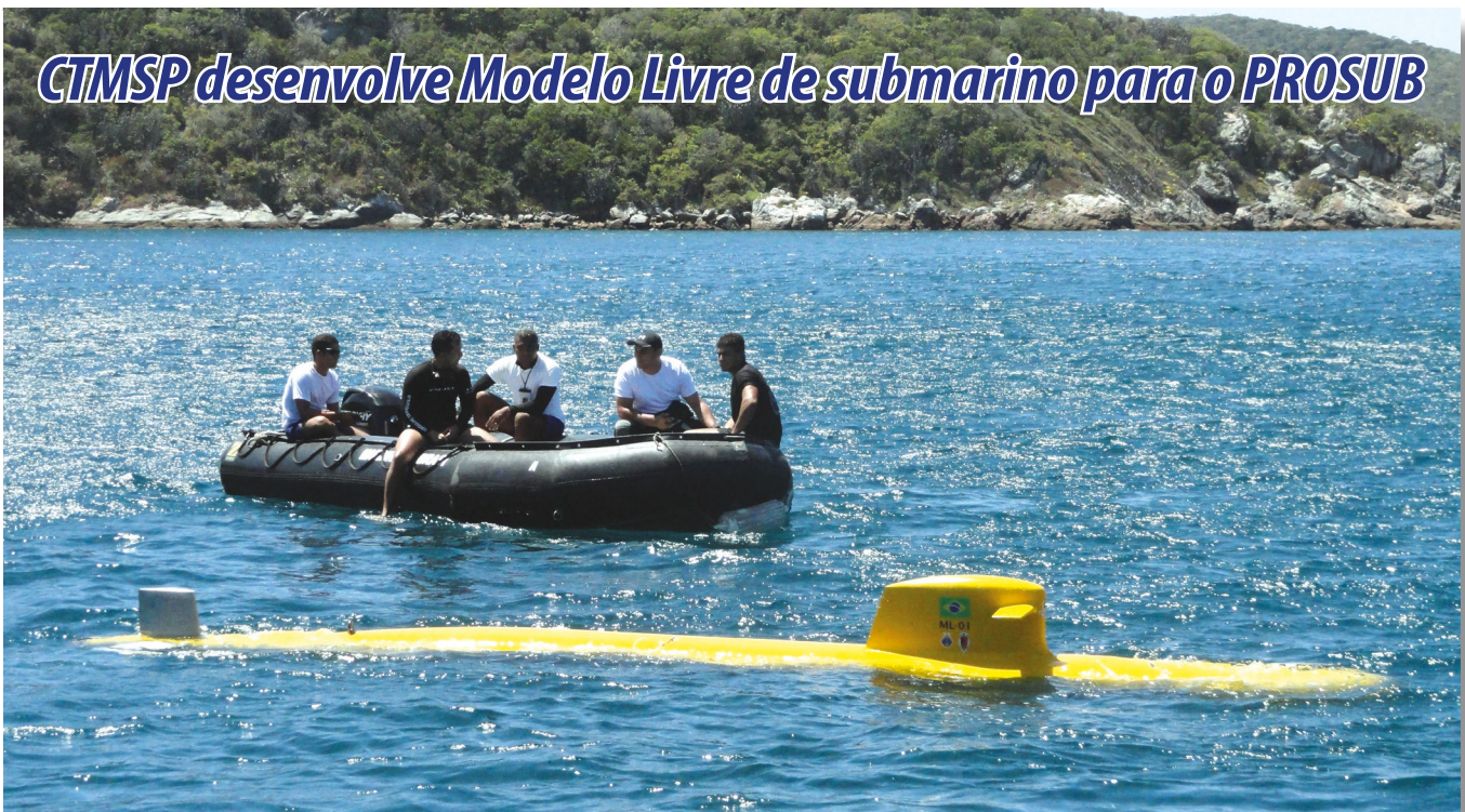
Teste do Modelo Livre em Arraial do Cabo (RJ)

O Centro Tecnológico da Marinha em São Paulo (CTMSP) desenvolveu e testou recentemente o Modelo Livre (ML) para apoio às atividades de projeto hidrodinâmico do Submarino de Propulsão Nuclear (SN-BR). Esse modelo integra as atividades de desenvolvimento e pesquisa para sistemas e equipamentos de propulsão naval.