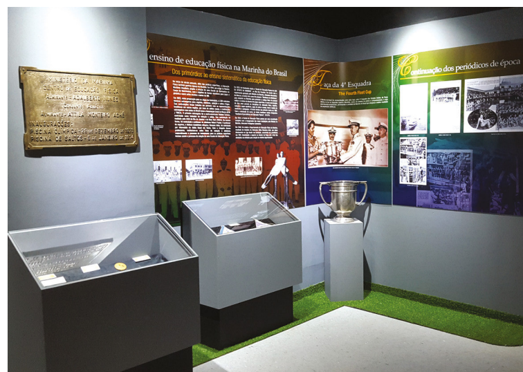
Museu do Esporte na Marinha

A Marinha do Brasil é uma das principais fomentadoras do desporto nacional, por meio do Programa Olímpico da Marinha, que tem como propósito principal contribuir para a transformação do País em potência olímpica. Em seu contingente conta, atualmente, com 224 atletas de alto rendimento, em 22 modalidades esportivas.