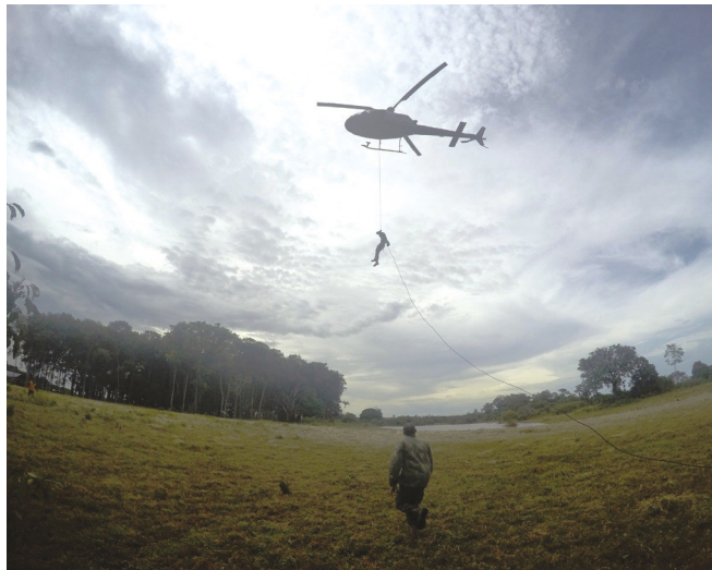
Exercício de rapel com aeronave

uma ação cívico-social direcionada às famílias da comunidade, quando foram disponibilizados serviços básicos de saúde.