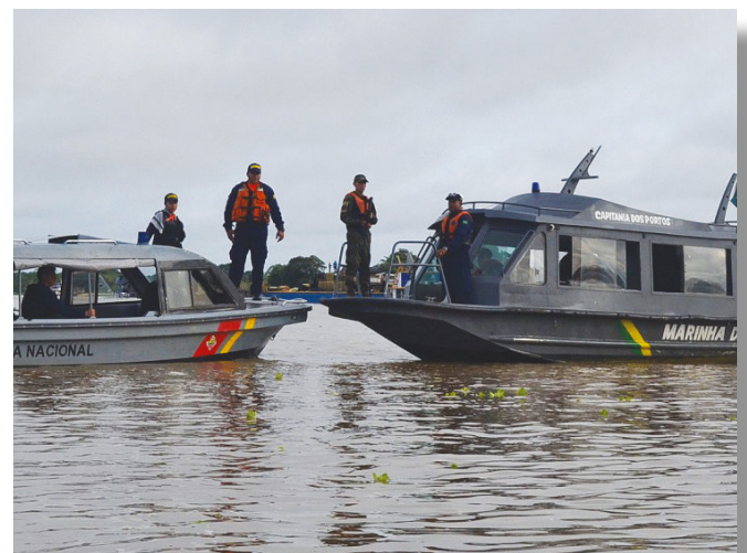
Fiscalização foi intensificada na região da tríplice fronteira, no rio Solimões

Mais de 50 embarcações foram vistoriadas. Entre as irregularidades encontradas, destacaram-se: ausência de documentação; problemas com as estruturas da embarcação; falta de coletes salva-vidas; e condutor não habilitado. Ao final, foi realizada uma reunião para verificação dos principais aspectos quanto à operacionalidade dos meios empregados.