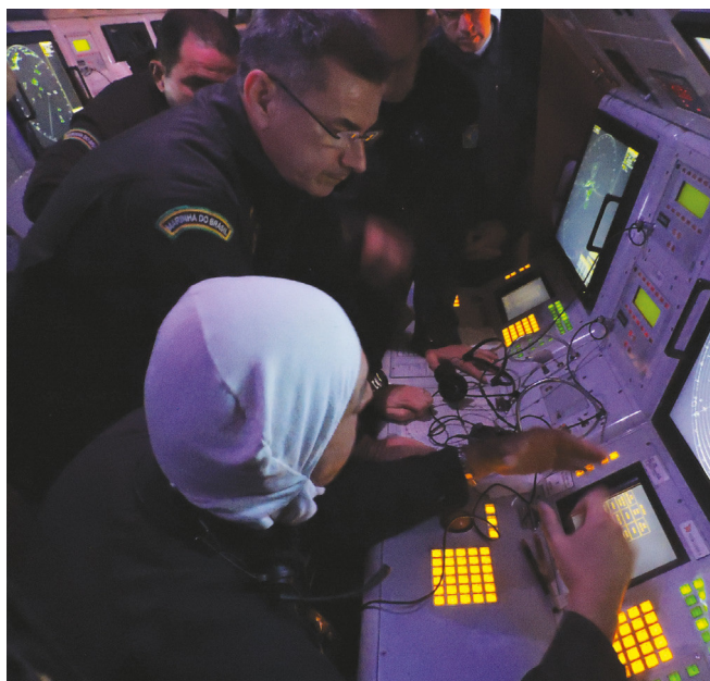
Alte Esq Caroli no Centro de Operações de Combate da Corveta "Barroso"

múltiplas ameaças, com ênfase no emprego em missões de escolta a forças navais e a comboios.