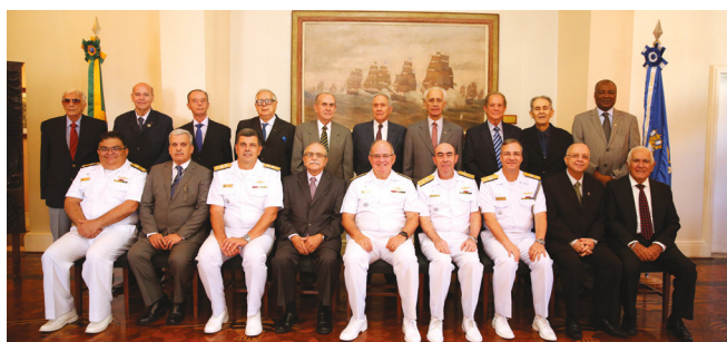
Foto oficial do evento