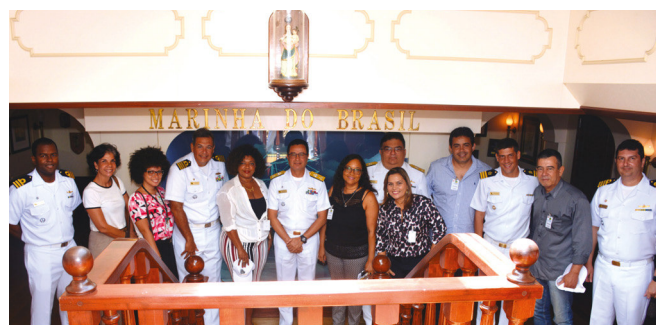
Autoridades militares e imprensa baiana no NVe "Cisne Branco"

Nos dias 20 e 22 de abril, o "Cisne Branco" ficou aberto à visitação pública, recebendo nove mil pessoas.