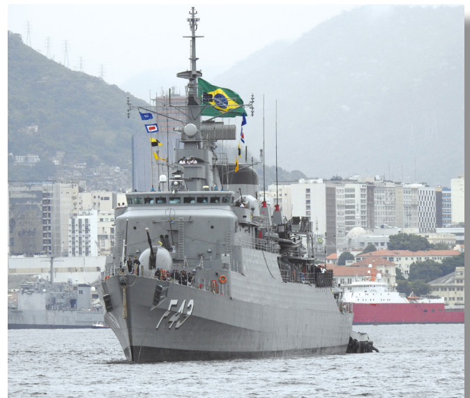
Fragata "Liberal" em sua chegada ao Rio de Janeiro (RJ)

Las Palmas (Espanha) e Natal (RN), antes de chegar ao destino final, no estado do Rio de Janeiro.