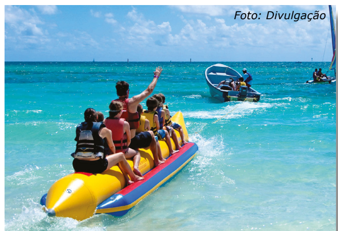
Novas regras foram estabelecidas para uso de dispositivos flutuantes

estejam posicionadas entre dois adultos, de modo a manterem-se seguras e equilibradas. O número de passageiros está limitado a cinco pessoas por dispositivo.