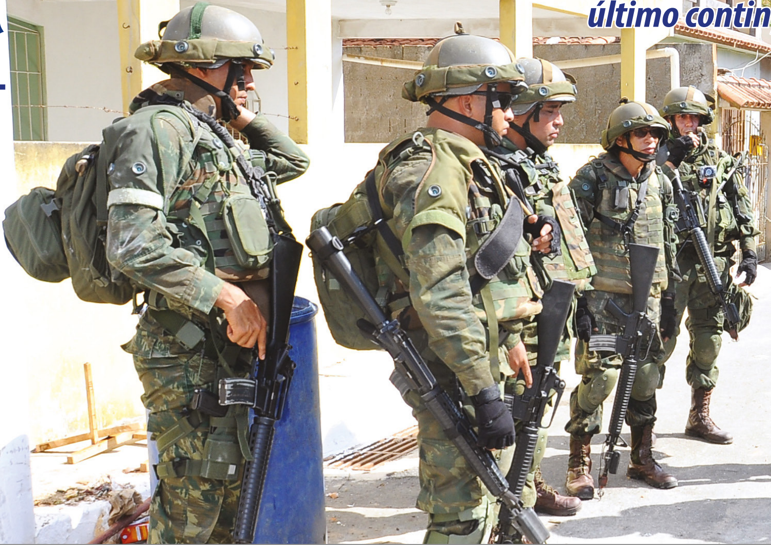
Exercício em Itaóca (ES)

Foi em Itaóca, no Espírito Santo, que 175 componentes que integrarão o 26º Grupamento Operativo de Fuzileiros Navais da Missão das Nações Unidas para a Estabilização do Haiti (MINUSTAH) encerraram a preparação para a última missão naquele país, com o treinamento "Adest Batalhão de Proteção I - 2017".