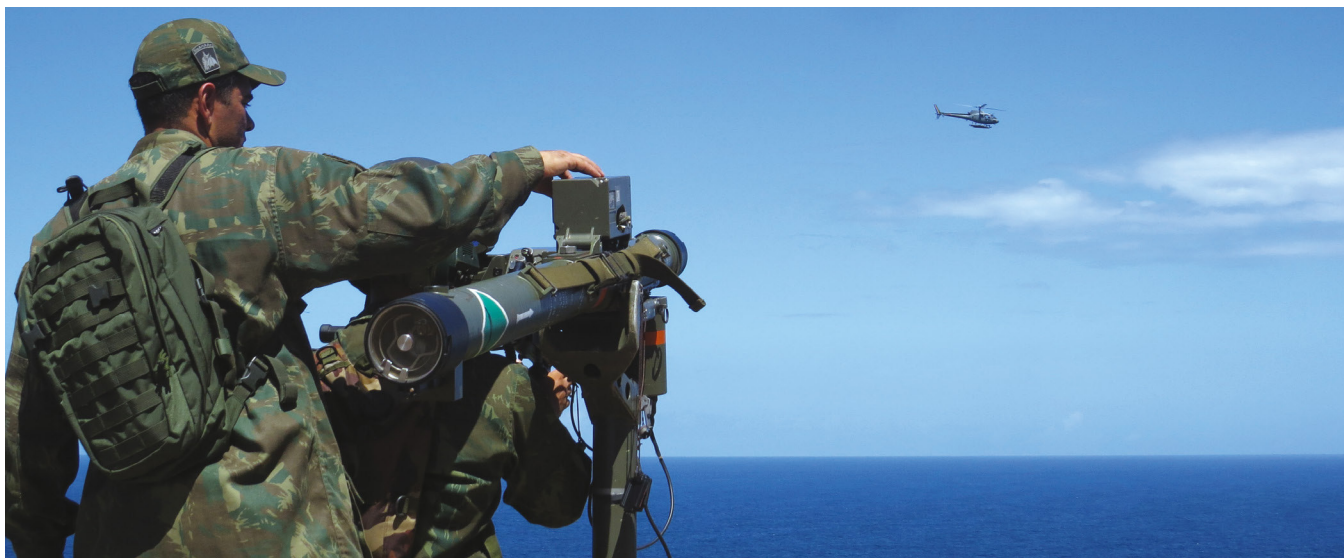
Militares durante exercício

O Batalhão de Controle Aerotático e Defesa Antiaérea (BtlCtAetatDAAe) realizou, de março a abril, um exercício intitulado "Adestramento de Equipes do Componente de Combate Aéreo", que reuniu aproximadamente 120 militares na região de São Pedro da Aldeia (RJ).