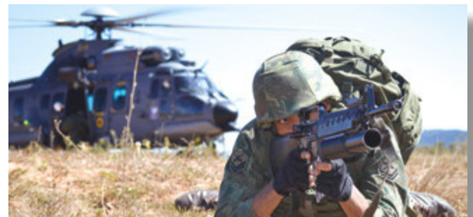
Adestramento de tiro

A terceira fase ocorreu de 29 de julho a 1º de agosto e consistiu na condução do tema tático, quando um exercício simulado colocou em prática os ensinamentos da fase anterior.