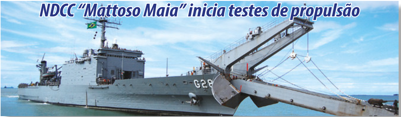
NDCC "Mattoso Maia"

Entre os dias 4 e 10 de agosto, o Navio de Desembarque de Carros de Combate (NDCC) "Mattoso Maia" iniciou os testes de funcionamento de dois dos seus motores de propulsão. Os seis motores propulsores foram submetidos à extensa revisão geral, como parte do projeto de revitalização do navio, e serão comissionados progressivamente, ao longo do segundo semestre de 2017. Os testes com os motores permitirão o início dos ajustes e testes de aceitação do novo sistema de controle da propulsão, desenvolvido integralmente por uma empresa nacional.