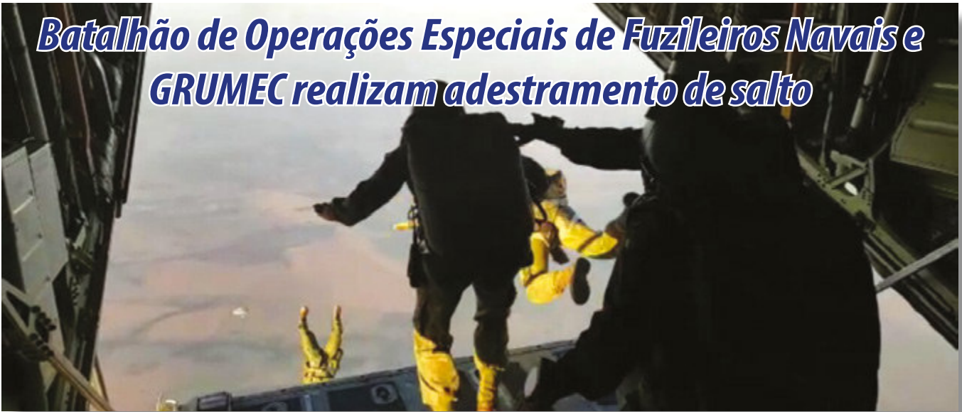
Militares durante exercício

Entre os dias 23 e 28 de julho, na cidade de Campo Grande (MS), o Batalhão de Operações Especiais de Fuzileiros Navais, juntamente com o Grupamento de Mergulhadores de Combate (GRUMEC), realizou o adestramento de salto livre operacional a grande altitude.