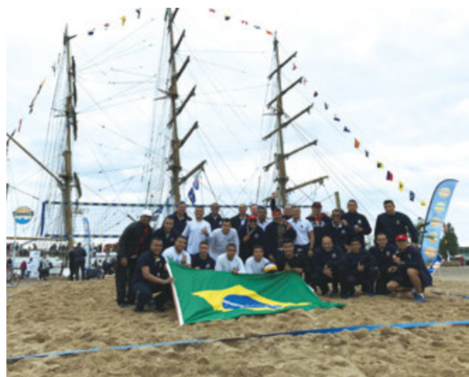
Tripulação do NVe “Cisne Branco” representa o Brasil e a Marinha em competições esportivas durante a Tall Ships Races 2017

Por último, atracou na cidade finlandesa de Kotka e recebeu aproximadamente nove mil moradores locais durante a visita pública. Nessa ocasião, a tripulação teve a oportunidade de conhecer as tripulações dos outros veleiros presentes e de divulgar um pouco da cultura brasileira e aspectos relevantes da Marinha do Brasil.