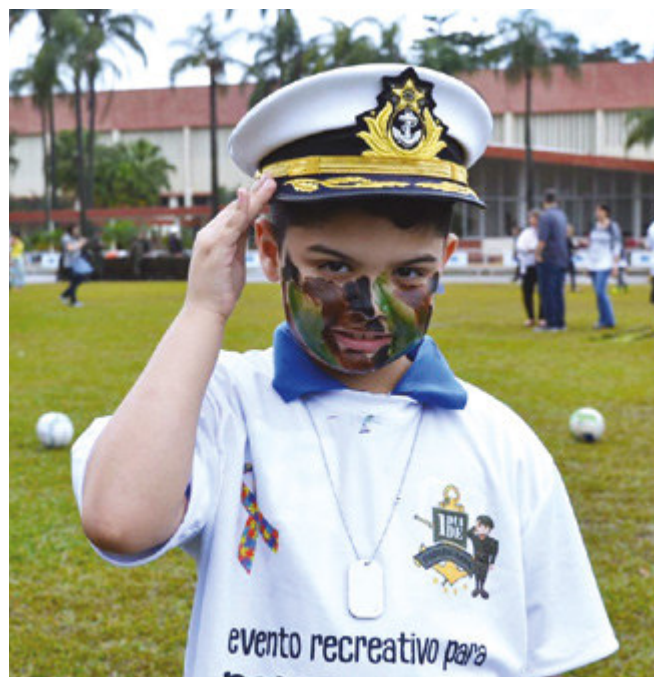
Criança participa do evento “Um dia de Fuzileiro Naval”

O evento foi encerrado com um cerimonial à Bandeira, seguido de um desfile militar com a Banda Marcial do Corpo de Fuzileiros Navais, a qual os participantes foram incorporados.