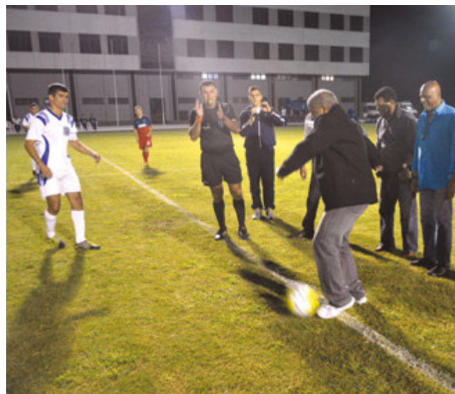
Do ex-jogador Jairzinho deu o pontapé inicial no primeiro jogo de futebol da Navamaer