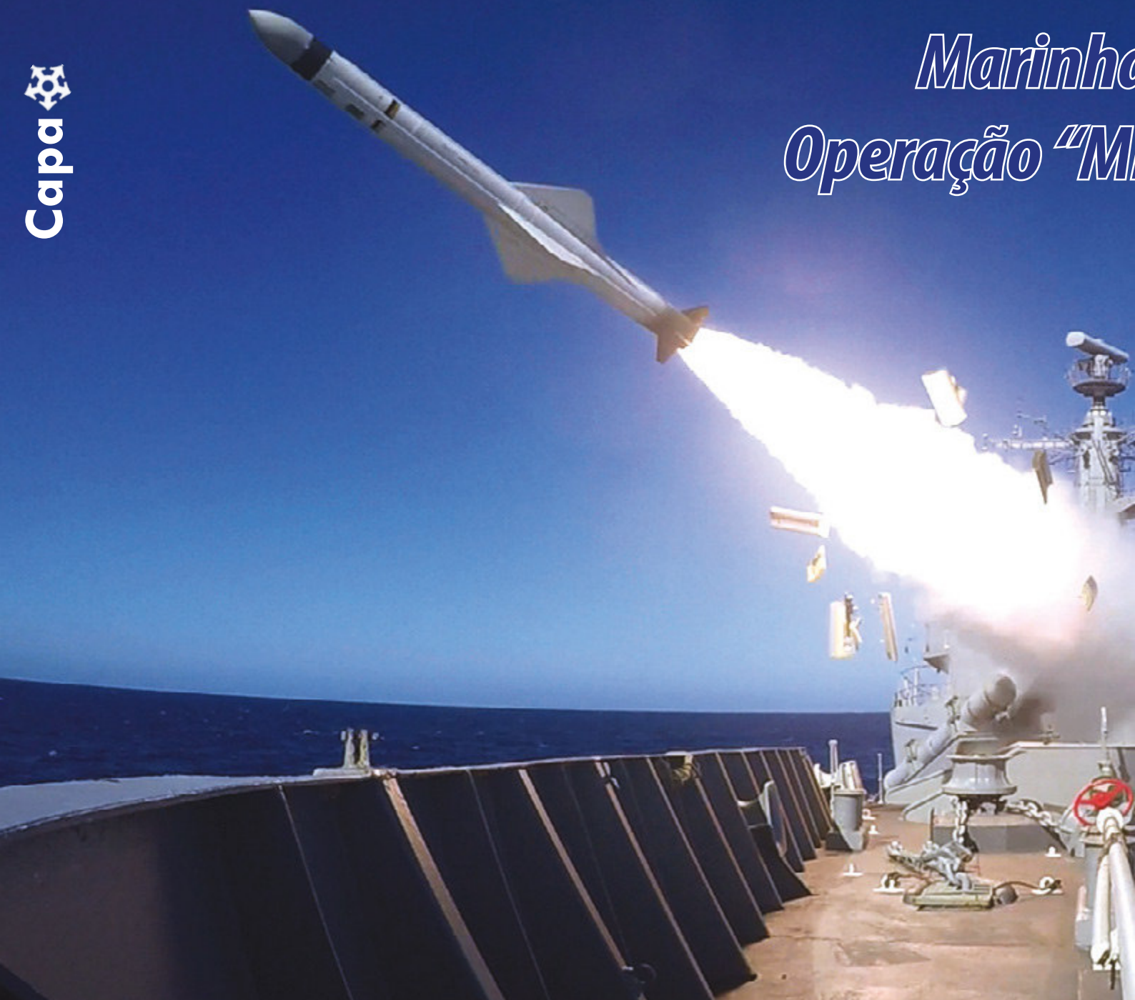
Lançamento do míssil Exocet MM40 pela Fragata "Rademaker"

Foi no período de 24 a 28 de julho, ao sul da Ilha de Cabo Frio, no Rio de Janeiro, que ocorreu a Operação "MISSILEX 2017", marcada pelo ineditismo de alguns procedimentos de combate.