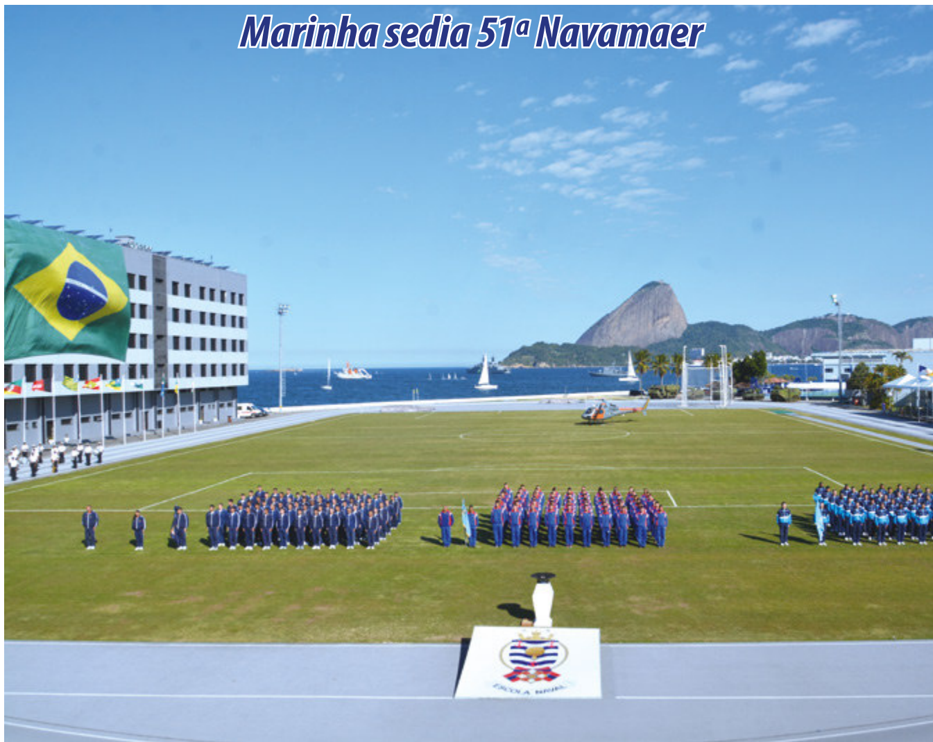
Cerimônia de abertura da 51ª Navamaer

A tradicional competição esportiva realizada entre as Academias Militares, Navamaer, teve sua 51ª edição realizada na Escola Naval, no período de 21 e 28 de julho. Cerca de 600 atletas, entre cadetes da Academia Militar das Agulhas Negras (AMAN), da Academia da Força Aérea (AFA) e aspirantes da Escola Naval, disputaram mais de 400 medalhas em 13 modalidades esportivas.