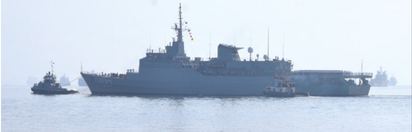
NE “Brasil” inicia viagem de instrução de Guardas-Marinha

No dia 23 de julho, o Navio Escola (NE) “Brasil” desatracou da Base Naval do Rio de Janeiro (BNRJ) para realizar a XXXI Viagem de Instrução de Guardas-Marinha (VIGM). Na ocasião, o Comandante da Força de Superfície, C Alte Wladmilson Borges de Aguiar, familiares e amigos dos tripulantes fizeram-se presentes para a despedida.