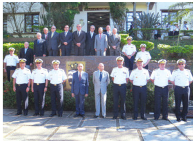
Autoridades presentes à cerimônia

A Força de Submarinos foi criada, em 17 de julho de 1914, por decreto do Almirante Alexandrino de Alencar, e na época era chamada de "Flotilha de Submersíveis", ficando subordinada administrativamente ao então Comando da Defesa Móvel do Porto do Rio de Janeiro. Em 1928, foi alterado o seu nome para "Flotilha de Submarinos" e, por fim, no ano de 1963, denominada Força de Submarinos.