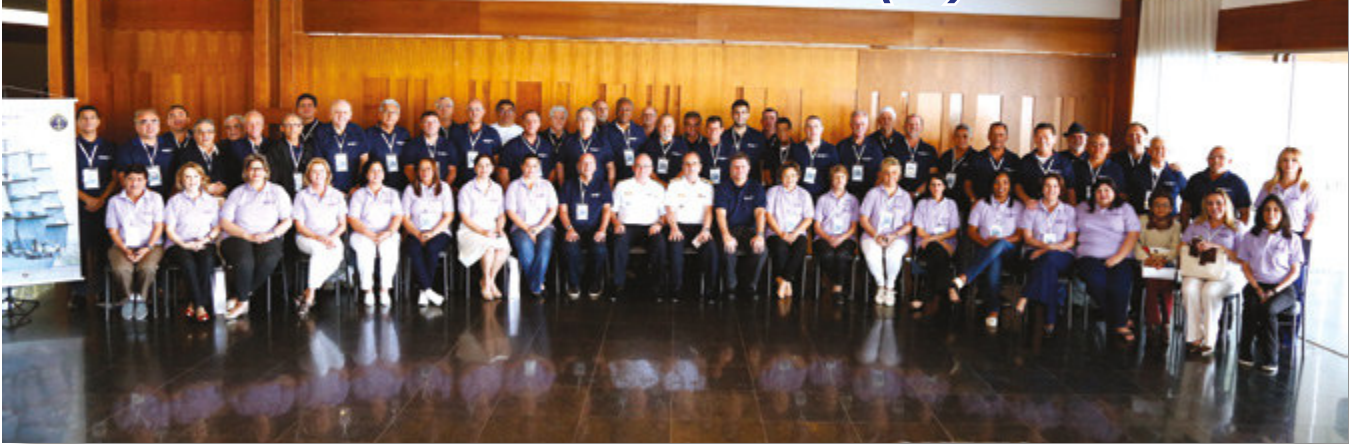
Comandante da Marinha, militares e representantes de SOAMAR de diversas regiões do Brasil

No período de 27 a 29 de julho aconteceu, em Brasília (DF), o III Encontro de Presidentes de SOAMAR (Sociedade Amigos da Marinha). Mais de 60 representantes, vindos de todas as partes do País, reuniram-se para dialogar sobre projetos e trocar experiências sobre temas relacionados à sociedade civil e à Marinha do Brasil.