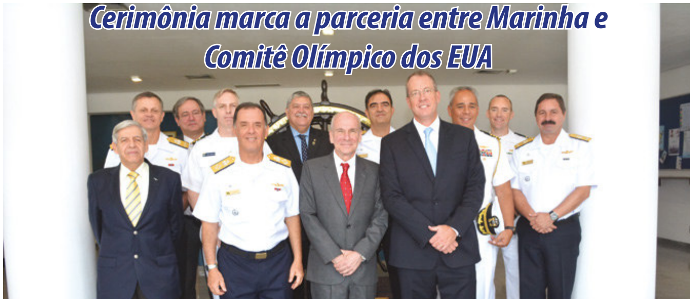
Autoridades americanas e brasileiras

No dia 3 de agosto, foi realizada uma cerimônia alusiva à cooperação firmada entre a Marinha do Brasil (MB) e o Comitê Olímpico Norte-Americano, por ocasião dos Jogos Olímpicos Rio 2016, presidida pelo Diretor-Geral do Pessoal da Marinha, Alte Esq Ilques Barbosa Júnior, na Escola Naval, no Rio de Janeiro (RJ).