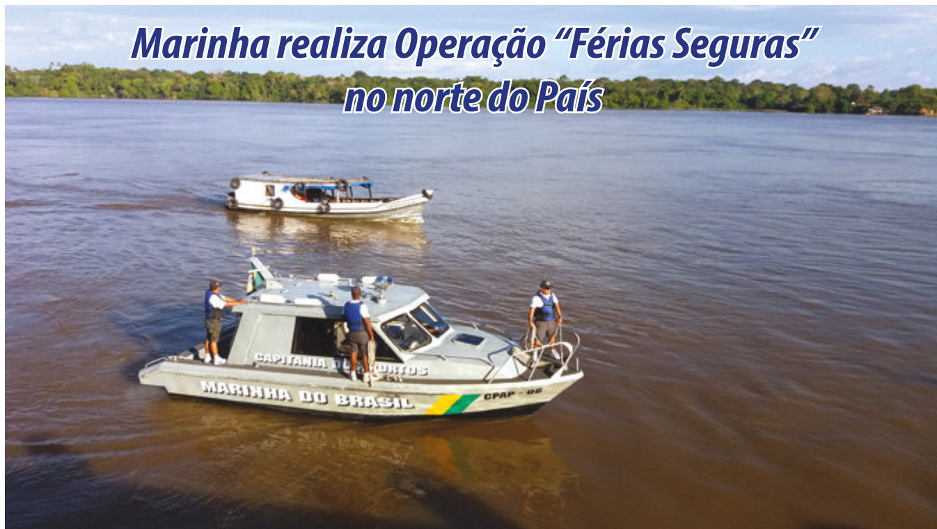
Militares da Marinha realizam fiscalização em embarcação

O Comando do 4º Distrito Naval (Com4ºDN), por meio das Capitânicas dos Portos da Amazônia Oriental, do Maranhão, do Amapá, do Piauí e de Santarém, realizou a Operação "Férias Seguras". A ação, que aconteceu durante todo o mês de julho, inspecionou 3.927 embarcações, dentre elas 139 foram notificadas e 66 apreendidas. Ao todo foram mobilizados 334 militares e 37 meios, entre embarcações e viaturas.