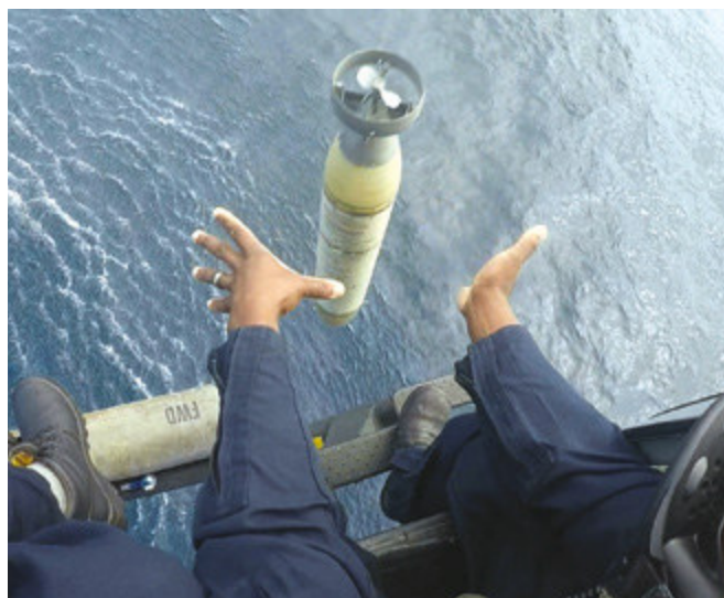
Drone EMMAT lançado pela aeronave UH-12 que simulou um alvo submarino

Foi realizado o lançamento do Míssil Ar-Superfície Penguin pela aeronave SH-16. Pela primeira vez, a aeronave foi armada com esse míssil a bordo de um navio da Esquadra, o Navio Doca Multipropósito "Bahia". As Fragatas "Rademaker" e "Independência" lançaram, ainda, o Míssil Superfície-Superfície Exocet MM40. De forma inédita, a Fragata da classe Greenhalgh realizou o disparo de forma integrada ao seu sistema de armas.