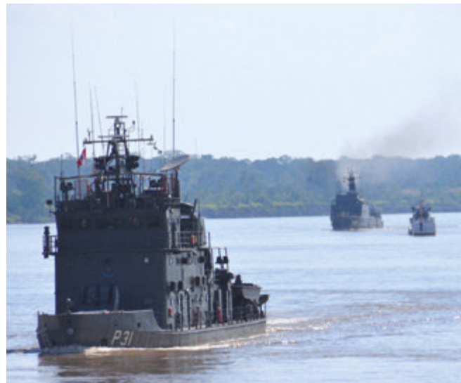
Navios das Marinhas do Brasil, Colômbia e Peru durante Operação "BRACOLPER 2017"

do Brasil, juntamente com os navios da Marinha da Colômbia, "ARC Cotuhe" e "ARC Letícia", e os Navios Patrulha "BAP Castilla" e "BAP Clavero", do Peru.