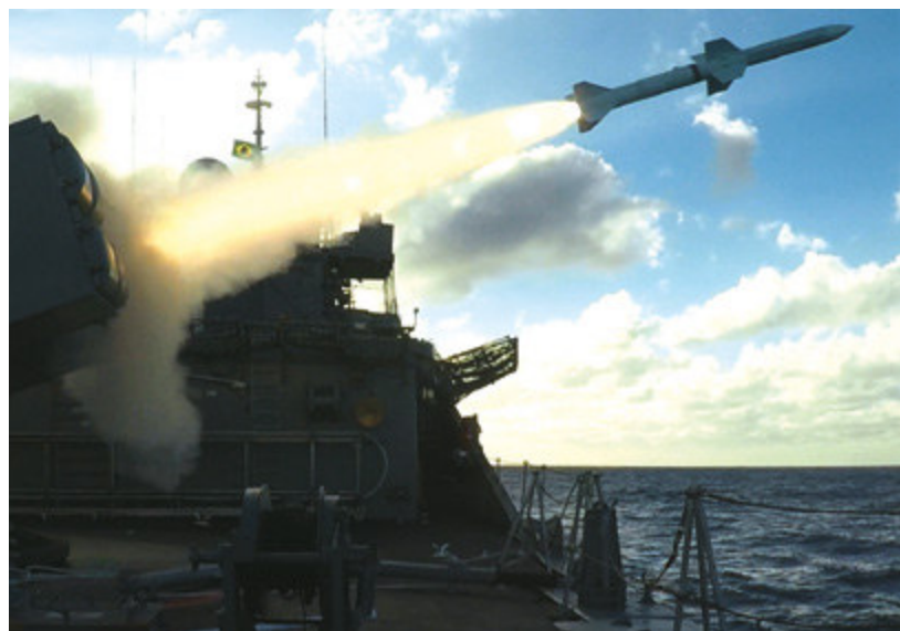
Lançamento do míssil Aspide, pela Fragata "Liberal"

Os tiros de canhão ainda continuaram na manhã do dia 27, quando os navios testaram o pronto emprego dos seus armamentos sobre o alvo Killer Tomato , de superfície, e o alvo aéreo derivante. O término da missão, no dia 28, foi coroado com o lançamento do torpedo MK46 pela aeronave SH-16.