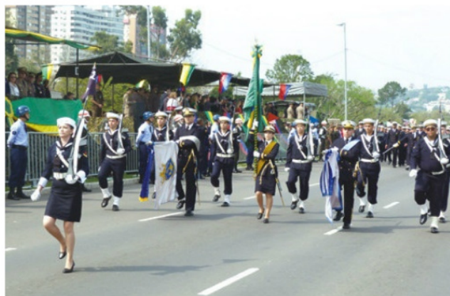
Pelotão desfila em Porto Alegre (RS)

Em Porto Alegre (RS), um público de cerca de quatro mil pessoas prestigiou o desfile que ocorreu na avenida Edvaldo Pereira Paiva. Já em Santa Catarina, a MB representada pelo destacamento da Capitania dos Portos de Santa Catarina e da Escola de Aprendizes Marinheiros de Santa Catarina, que apresentou seu tradicional pelotão feminino Pelotas, Uruguaiana, Tramandaí, Imbé, Osório (RS); Florianópolis, São Francisco do Sul, Laguna, Itajaí (SC); entre outras, também contaram com a participação da MB nas comemorações.