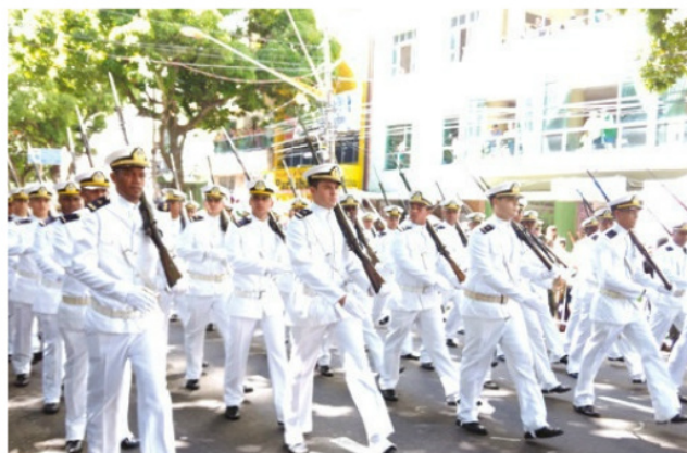
Desfile na avenida Presidente Vargas, em Belém (PA)

O contingente de desfile da Marinha, representado pelo Comando do 4º Distrito Naval, foi constituído por um pelotão de membros da Associação de Veteranos do Corpo de Fuzileiros Navais e quatro companhias, num total de 474 militares, além de cinco meios da Força: uma Lancha de Ação Rápida, uma embarcação de transporte de tropas (ETT), uma moto aquática, uma lancha de sondagem e uma lancha de assistência social.