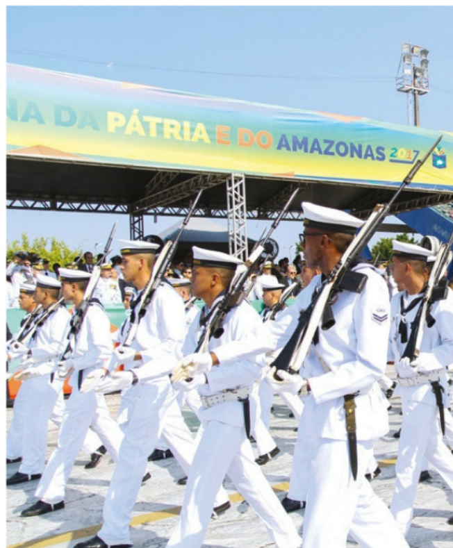
Desfile em Manaus (AM)

Autoridades civis e militares da Colômbia e do Peru prestigiaram o desfile em Tabatinga (AM), que teve a participação de militares e alunos das escolas e instituições públicas dos três países.