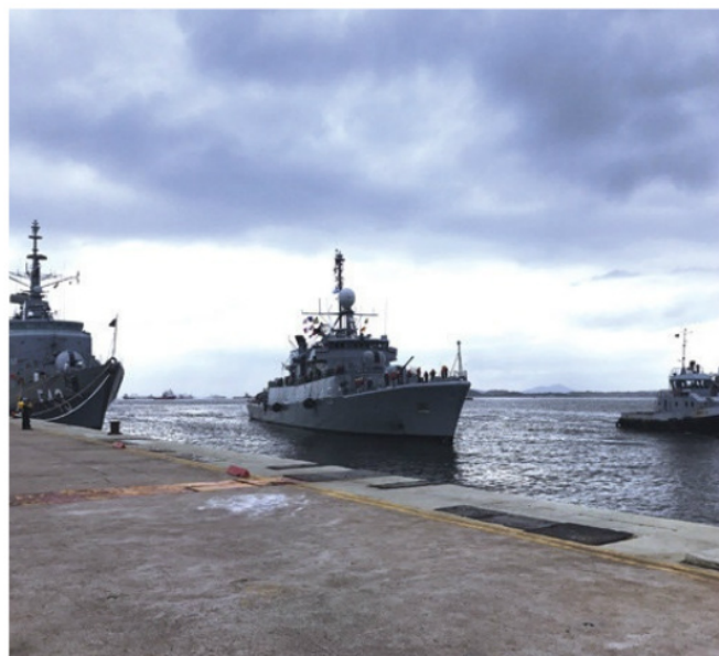
Corveta "Spiro", da Argentina, atracando na Base Naval do Rio de Janeiro (RJ)

Corveta "Spiro" ficaram abertas a visita pública. Durante os dois dias, cerca de 3.500 pessoas passaram pela Delegacia da Capitania dos Portos em Itajaí e pelo Píer Turístico da cidade.