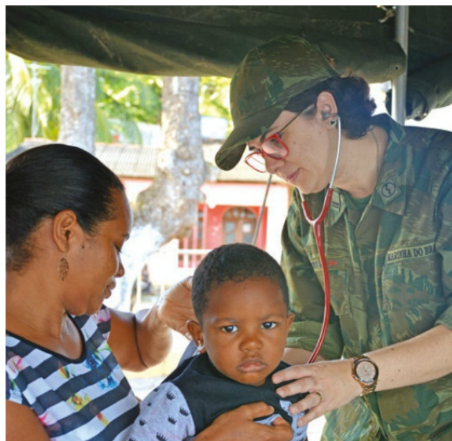
Foram realizados 3.895 procedimentos médicos e odontológicos

tão bem de mim, desde o começo. Muito obrigada!".