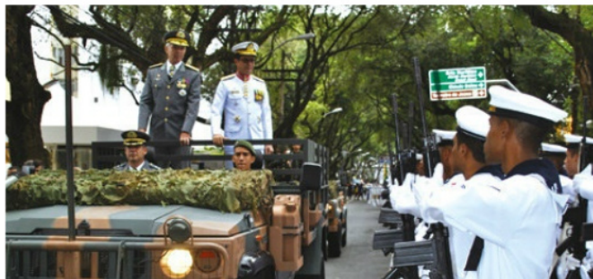
Revista à tropa no desfile em Salvador (BA)

Em Salvador, 373 militares da MB desfilaram entre a avenida 7 de Setembro e a Praça Casto Alves. A novidade foi a presença do pelotão elétrico do Grupamento de Fuzileiros Navais de Salvador, que encantou o público. Os militares executaram a ordem unida silenciosa, quando os movimentos com o fuzil são comandados apenas por sinais. Foram apresentadas viaturas operativas dos Fuzileiros Navais; embarcações da Capitania dos Portos da Bahia e do Serviço de Sinalização Náutica do Leste; além de uma viatura com equipamentos industriais da Base Naval de Aratu.