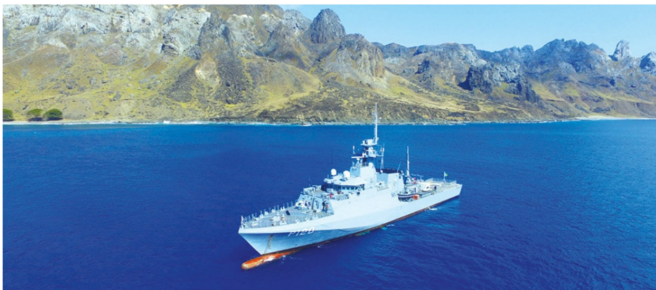
NPaOc "Amazonas" realizou apoio logístico para reabastecer o POIT

O Navio Patrulha Oceânico (NPaOc) "Amazonas" realizou a 15ª operação de reabastecimento do Posto Oceanográfico da Ilha de Trindade (POIT), de 13 a 15 de agosto. Durante a missão, o navio transportou 18 militares para a substituição da tripulação do Posto e de pesquisadores do Programa de Pesquisas Científicas na Ilha da Trindade. A travessia durou três dias e meio.