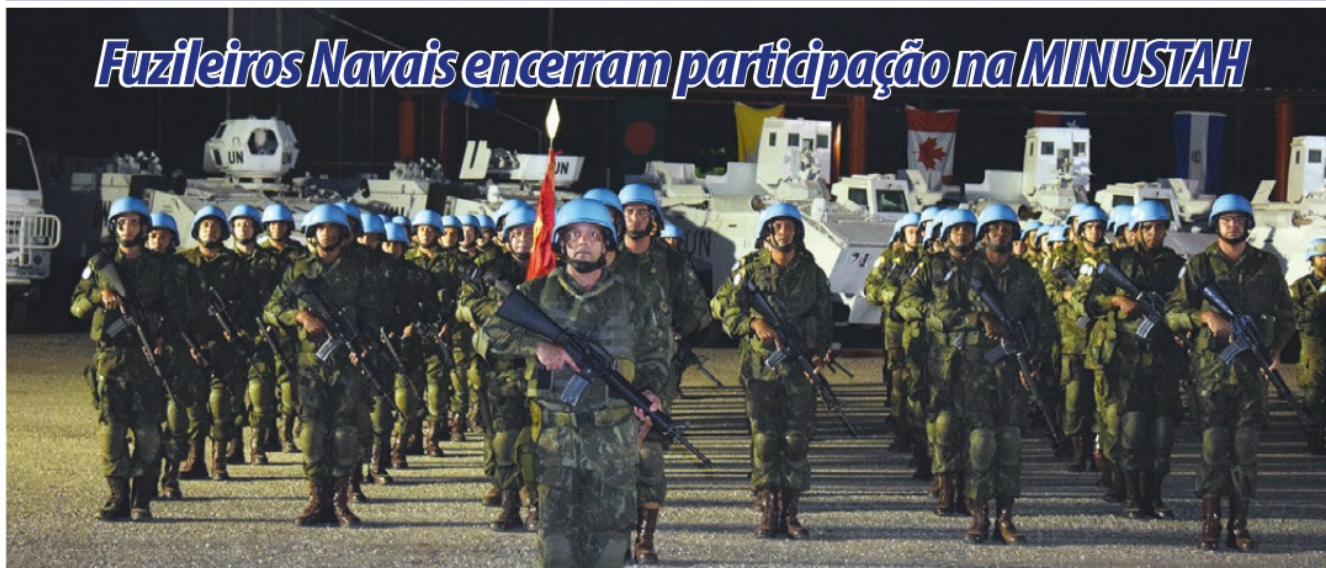
Grupamento Operativo de Fuzileiros Navais durante a cerimônia

Em 31 de agosto, o Contingente Brasileiro de Força de Paz, participante da Missão das Nações Unidas para Estabilização no Haiti (MINUSTAH), concluiu suas operações na capital Porto Príncipe. Nos 13 anos de atuação, a Marinha enviou ao país 26 contingentes de Fuzileiros Navais e, aproximadamente, 37.500 militares capacetes azuis.