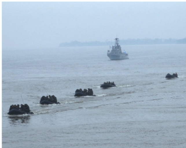
Realização do Assalto Ribeirinho

dos laços de amizade entre as Marinhas do Brasil, da Argentina, da Bolívia, do Paraguai e do Uruguai. O exercício contribuiu, ainda, para o aprestamento dos meios navais, aeronavais e de fuzileiros navais.