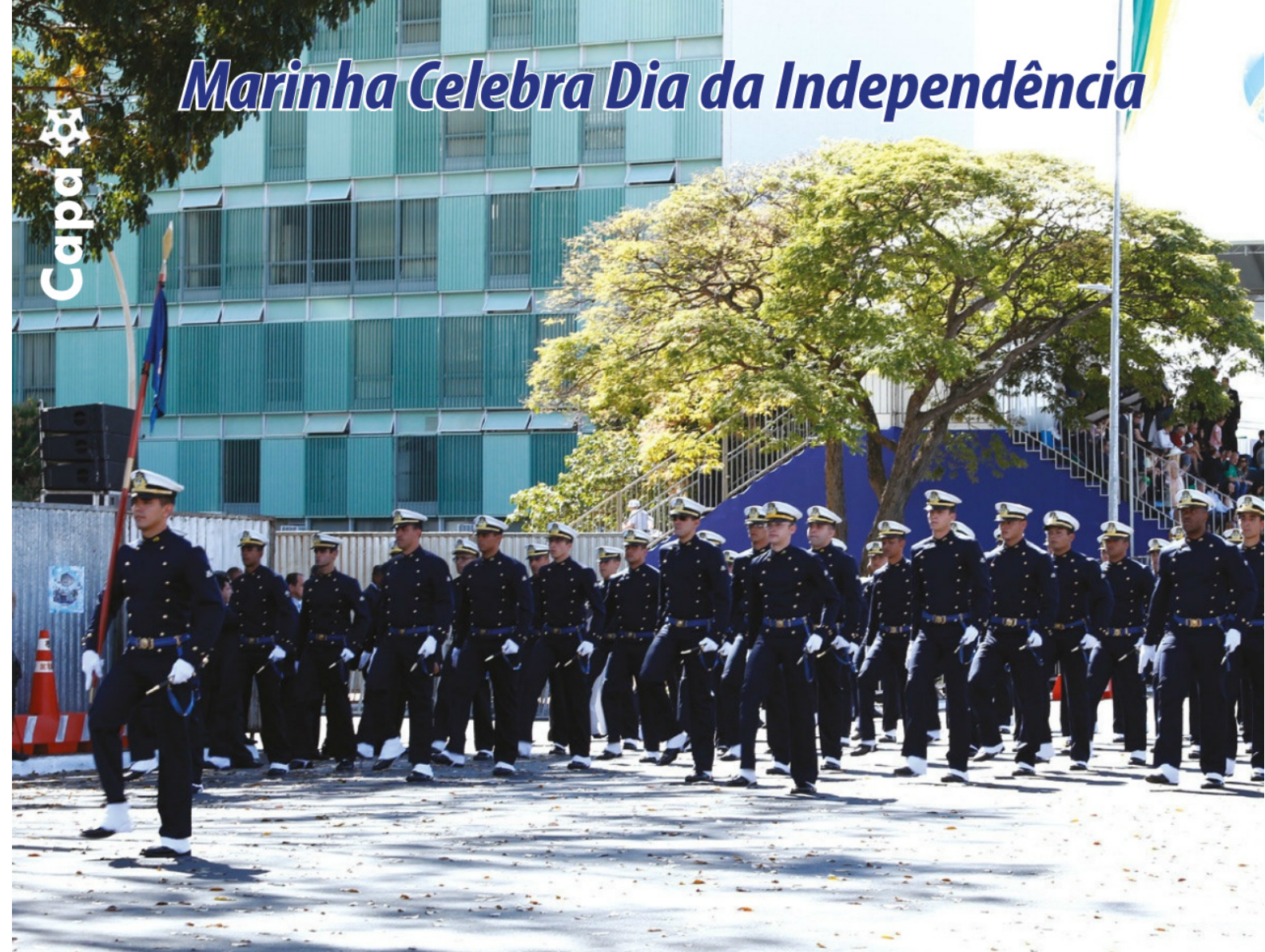
Pelotão de Aspirantes da Escola Naval desfilou em Brasília (DF)

Militares da Marinha do Brasil (MB) marcaram presença nos desfiles cívicos do dia 7 de setembro. De norte a sul, homens e mulheres do mar participaram das solenidades em comemoração aos 195 anos da independência do Brasil, que tiveram como tema e slogan "Viva sua Independência". A Marinha reafirmou o comprometimento da Força Naval em cumprir com o seu dever na defesa dos interesses dos cidadãos e da pátria.