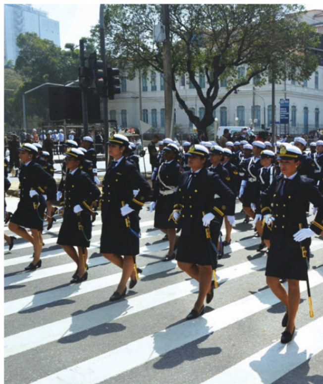
Pelotão feminino em desfile no centro do Rio de Janeiro (RJ)

Cerca de cinco mil pessoas prestigiaram o tradicional desfile no Rio de Janeiro. A solenidade foi realizada na avenida Presidente Vargas, no Centro do Rio de Janeiro. Cerca de 4 mil componentes desfilaram, sendo 3 mil militares. Os 1.020 da Marinha apresentaram o pioneirismo na admissão de mulheres nas Forças Armadas; e a importância das escolas na formação de Oficiais que vão servir nos navios que irão proteger a nossa Amazônia Azul e que trabalharão na Marinha Mercante. Os cariocas também puderam ver as viaturas blindadas empregadas em missões de paz das Nações Unidas. Um dos destaques do evento foi o desfile das viaturas históricas dos ex-combatentes de guerras.