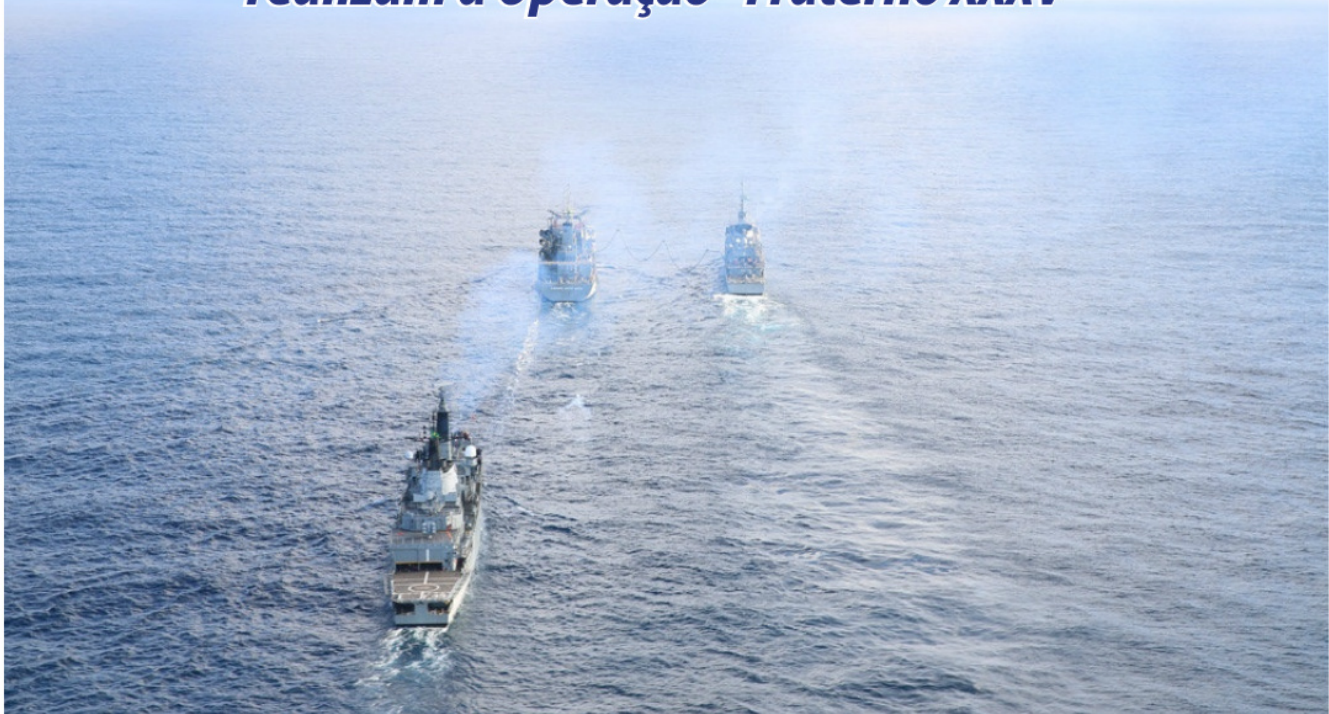
O Navio Tanque (NT) "Almirante Gastão Motta" reabasteceu as Fragatas "Rademaker" e "Constituição" ao mesmo tempo

No período de 10 a 23 de agosto, a Marinha do Brasil e a Armada da República Argentina realizaram a Operação "Fraterno XXXV", na área marítima compreendida entre o Rio de Janeiro (RJ) e Itajaí (SC). A operação, ocorrida no âmbito da América do Sul, objetivou o aperfeiçoamento do nível de adestramento das unidades navais no planejamento e na execução de operações entre as duas Marinhas.