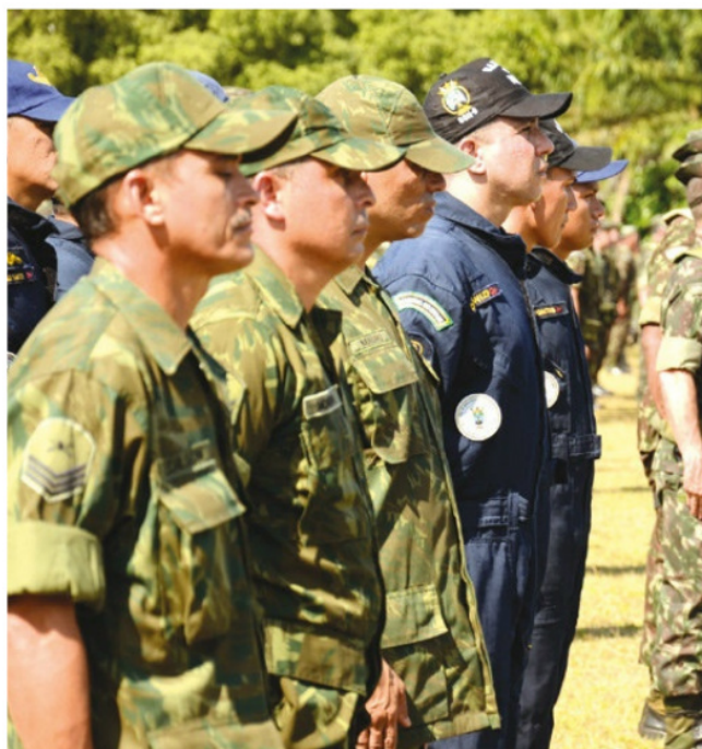
Militares da Marinha e do Exército durante ação em Itacoatiara (AM)

Marinha do Brasil, Exército Brasileiro e Força Aérea Brasileira empregaram aproximadamente 4.550 militares. Ao todo, 459 localidades de votação foram acompanhadas pelas Forças Armadas.