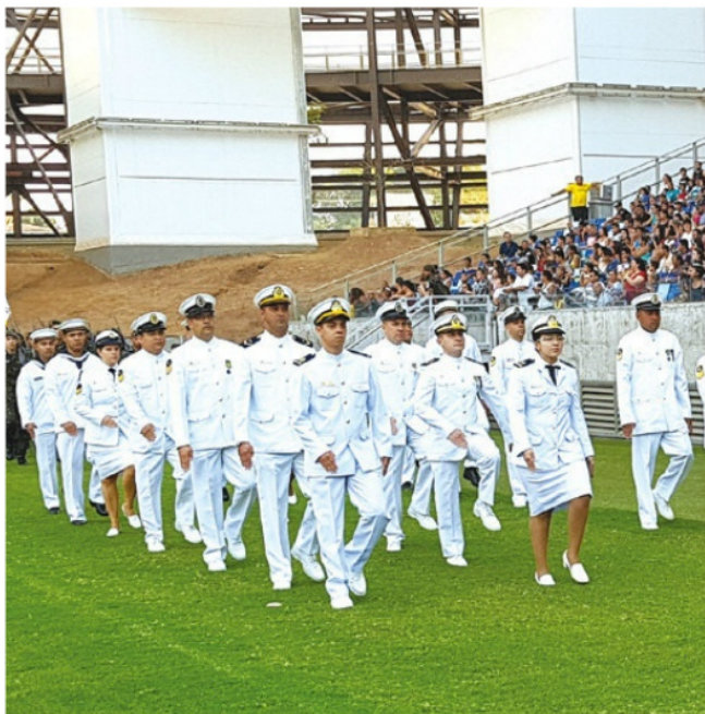
Desfile na Arena Pantanal (MS)

Na área do Com6ºDN, a Marinha do Brasil esteve representada por militares nos desfiles cívicos nas cidades de Campo Grande, Corumbá, Ladário e Porto Murtinho, no estado de Mato Grosso do Sul; e em Cuiabá e Cáceres, no estado de Mato Grosso. Ao todo cerca de 300 militares participaram das comemorações.