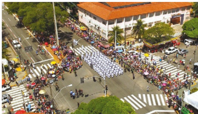
Desfile atrai multidão em Natal (RN)

As Organizações Militares das capitais do Rio Grande do Norte, Paraíba, Pernambuco, Ceará e Alagoas promoveram e participaram dos desfiles em suas áreas de atuação.