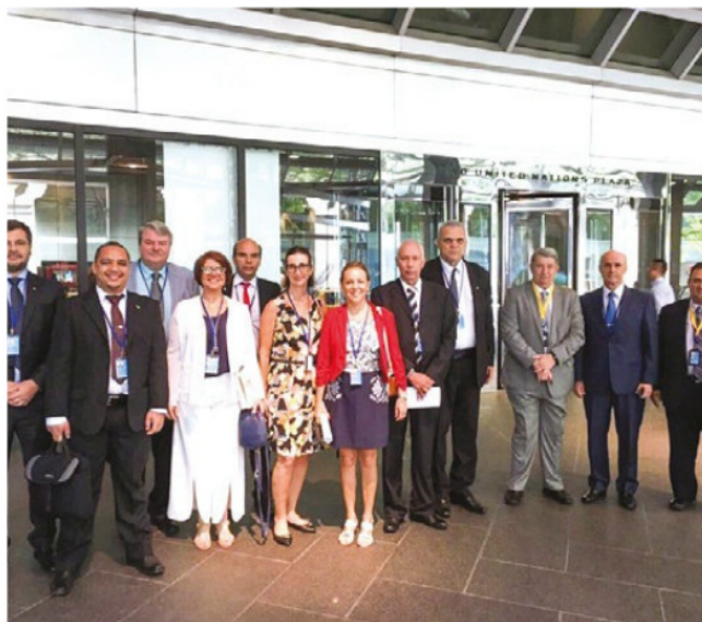
Delegação brasileira na ONU

Interministerial para os Recursos do Mar (CIRM), com o propósito de estabelecer o Limite Exterior da Plataforma Continental Brasileira no seu enfoque jurídico.