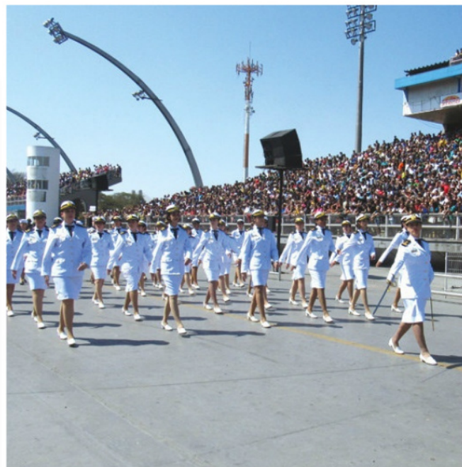
Com8ºDN desfilou com pelotão feminino em São Paulo (SP)

Militares do Com8ºDN participaram também dos desfiles em Santos, Caçapava, Presidente Epitácio, Barra Bonita (SP); e em Curitiba e Foz do Iguaçu (PR).