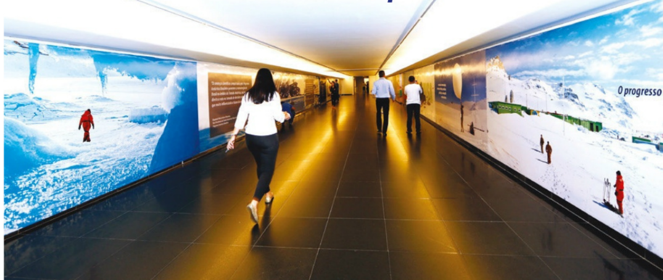
Exposição sobre o PROANTAR na Câmara dos Deputados

Em parceria com a Frente Parlamentar Mista do Programa Antártico Brasileiro, a Marinha do Brasil realizou em setembro, no corredor central da Câmara dos Deputados, a exposição "O Brasil no Continente Antártico".