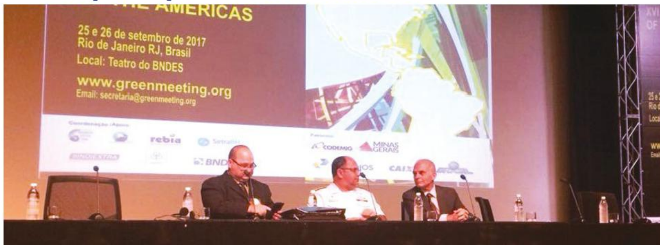
“XVI Encontro Verde das Américas”

A Marinha do Brasil, representada pela Diretoria de Portos e Costas (DPC), participou do “XVI Encontro Verde das Américas”, realizado no Rio de Janeiro, nos dias 25 e 26 de setembro. Também denominado “Greenmeeting Rio 2017”, o fórum reuniu autoridades nacionais e internacionais das áreas de meio ambiente e de desenvolvimento sustentável, que discutiram sobre soluções para problemas socioambientais e econômicos com o objetivo de propor melhorias à qualidade de vida das comunidades locais e globais.