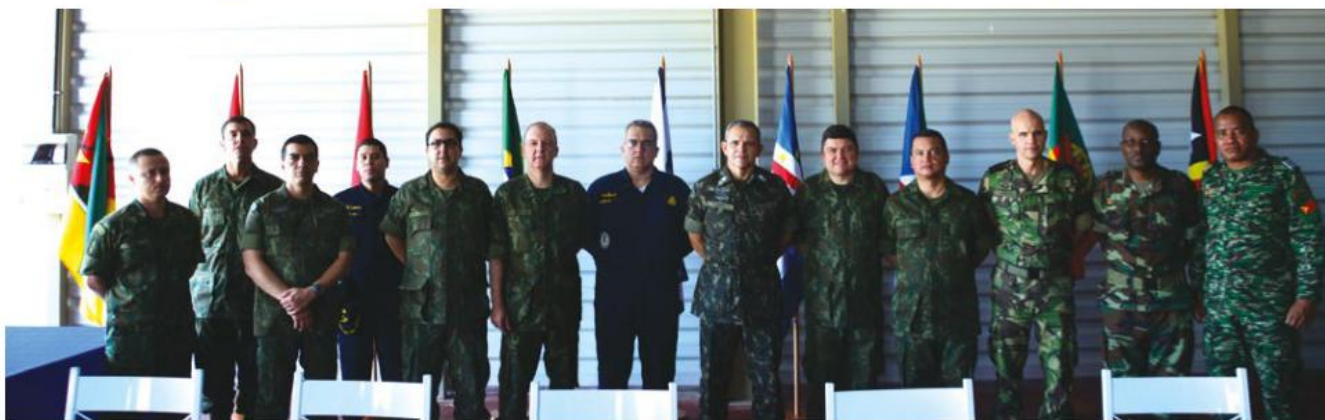
Representantes da FTCC

Sob a coordenação do Ministério da Defesa, foi realizada, em setembro, a Operação Felino 2017, que reúne a Força Tarefa Conjunta e Combinada (FTCC). Representantes da Marinha do Brasil, do Exército Brasileiro, da Força Aérea Brasileira, bem como de militares oriundos de Angola, Cabo Verde, Guiné-Bissau, Guiné Equatorial, Moçambique, Portugal, São Tomé e Príncipe e Timor-Leste compõem a FTCC.