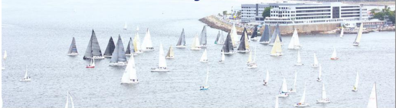
Veleiros durante a 72ª Regata Escola Naval

Em um domingo com clima típico de primavera, 8 de outubro, a Ilha de Villegagnon foi cenário da 72ª Regata Escola Naval, a maior prova náutica da América Latina, realizada na Baía de Guanabara.