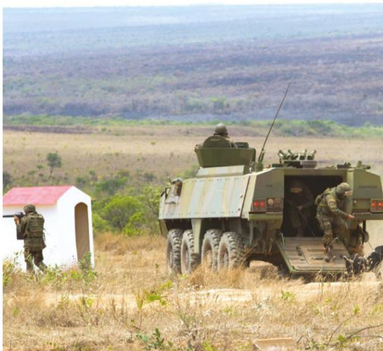
Viatura blindada do CFN