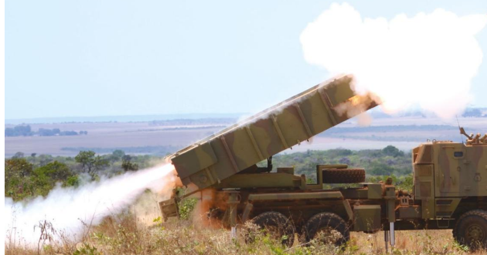
Lançamento de foguete pelo LMF ASTROS

Considerado o maior exercício realizado pela Força de Fuzileiros da Esquadra (FFE) da Marinha do Brasil (MB no Planalto Central), a Operação Formosa 2017 aconteceu entre os dias 4 e 16 de outubro, no Campo de Instrução de Formosa (CIF), pertencente ao Exército Brasileiro, em Goiás. O objetivo da operação foi aprimorar o treinamento e manter as condições de pronto emprego dos fuzileiros navais em diversos ambientes operacionais, entre eles o cerrado.