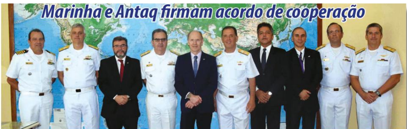
Autoridades que participaram do evento de assinatura do acordo de cooperação

A Marinha do Brasil (MB) e a Agência Nacional de Transportes Aquaviários (Antaq) assinaram, em 9 de outubro, acordo de cooperação que tem como propósito a execução de atividades em prol do transporte e da segurança do tráfego aquaviário. O documento foi assinado pelo Chefe do Estado-Maior da Armada, Alte Esq Ilques e pelo Diretor-Geral da Antaq, Adalberto Tokarski, em Brasília (DF).