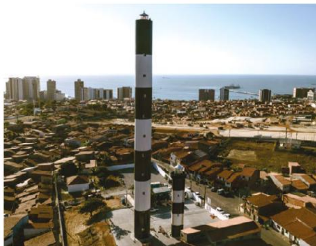
O farol recém-inaugurado (esquerda) e o antigo