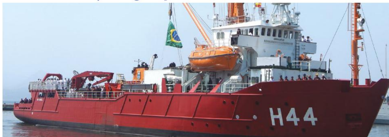
NApOc "Ary Rongel" partiu para a OPERANTAR XXXVI

A Marinha do Brasil, em continuidade às ações que visam dar suporte ao Programa Antártico Brasileiro, enviou ao continente antártico, no dia 13 de outubro, o Navio de Apoio Oceanográfico (NApOc) "Ary Rongel", iniciando a 36ª Operação Antártica, desatracando no Arsenal de Marinha do Rio de Janeiro.