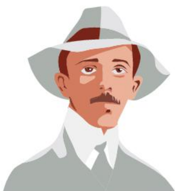
Ilustração: Gabriel Loureiro

A FHE e a POUPEX saúdam todos aqueles que compõem a Aeronáutica brasileira pelo Dia do Aviador, 23 de outubro. ■