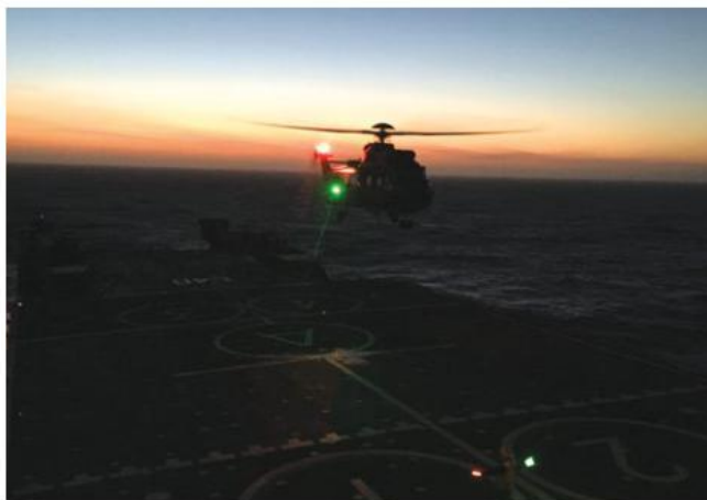
Aeronave AH-11A Super Lynx sobrevoa o NDM "Bahia"