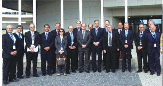
Representantes da Amazul e participantes da conferência