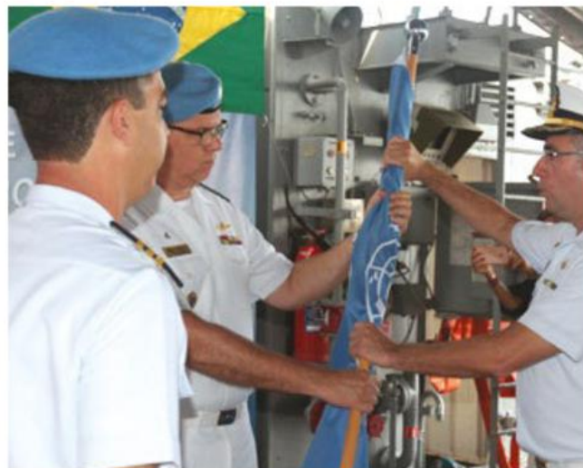
Corveta "Barroso" é o novo capitânia da Força-Tarefa Marítima da UNIFIL