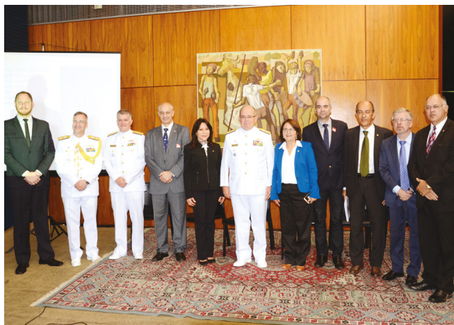
Comandante da Marinha (centro) e representantes da Frente Parlamentar do Proantar

Tratado – Atualmente, 53 países integram o Tratado da Antártica. Desses, apenas 29, inclusive o Brasil, são membros consultivos, ou seja, que têm direito a votar e opinar sobre diretrizes dos programas relacionados às atividades na Antártica. Criado em 1982, o Proantar contribui para o desenvolvimento de pesquisas feitas por cientistas brasileiros na Antártica.