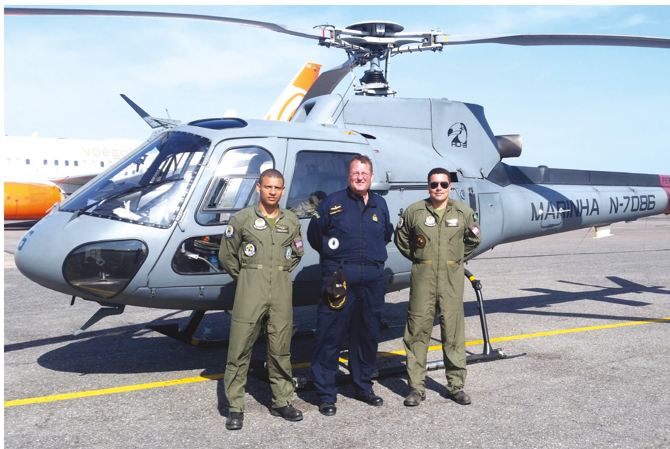
Aeronave AS350 'Esquilo' que realizou ação de presença e reconhecimento

No período de 12 a 15 de outubro, o 3º Esquadrão de Helicópteros de Emprego Geral (EsqdHU-3) realizou deslocamento aéreo de reconhecimento sobre o rio Amazonas, entre as cidades de Manaus (AM) e Santarém (PA).