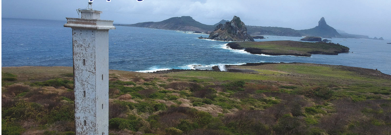
Arquipélago de Fernando de Noronha

Com apoio logístico do Navio Patrulha Oceânico (NPaOc) "Araguari", subordinado ao Comando do 3º Distrito Naval, foi realizada, entre os dias 17 e 27 de outubro, a Comissão de Apoio à Estação Científica do Arquipélago de São Pedro e São Paulo (Apoiex ECASPSP). A missão foi coordenada pela Secretaria da Comissão Interministerial para os Recursos do Mar (Secirm).