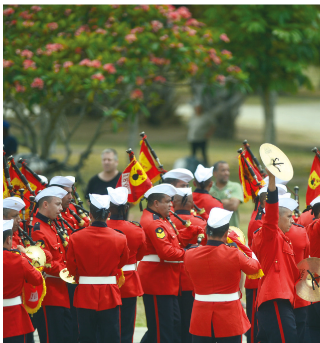
Banda Marcial do Corpo de Fuzileiros Navais durante apresentação