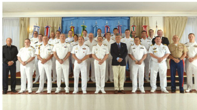
Delegações participantes da XI CNIE-T

A RNIT foi criada em março de 1962 com o propósito de manter o intercâmbio de comunicações entre os comandos navais dos países participantes. A Estação Rádio da Marinha em Brasília (ERMB) é um de seus integrantes, sendo a atual detentora do Prêmio "Melhor Estação" da Rede.