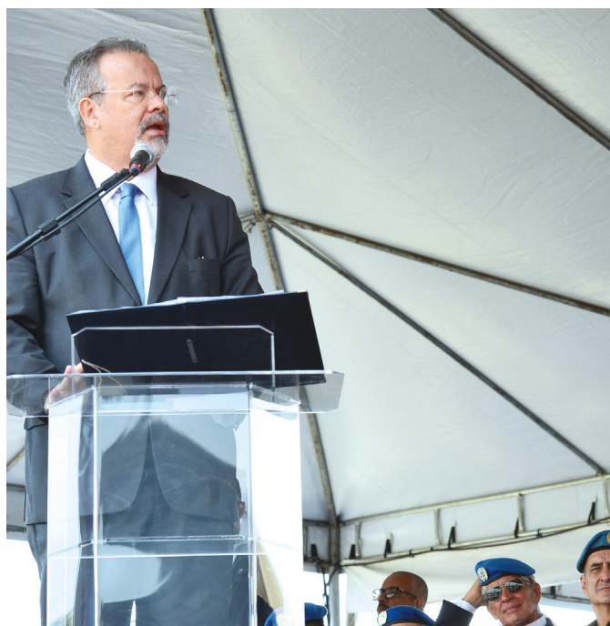
Ministro da Defesa falou sobre o importante papel da participação brasileira na Missão

Fonte: Com informações do Ministério da Defesa