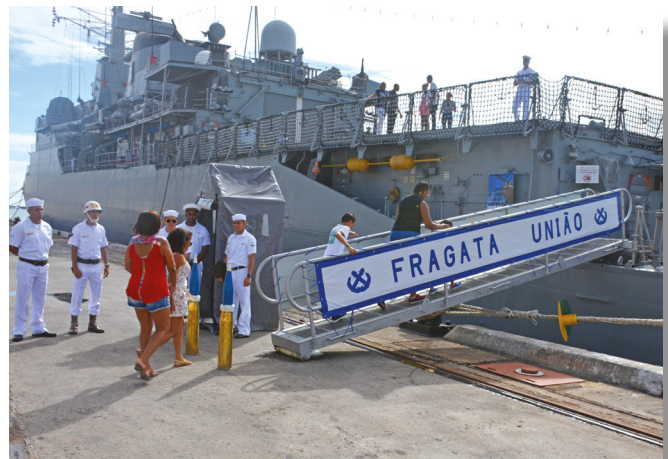
Visita à Fragata “União” entrou na programação do fim de semana do soteropolitano

o meu pai para vir porque quero entrar para a Marinha quando eu terminar o colégio” declarou.