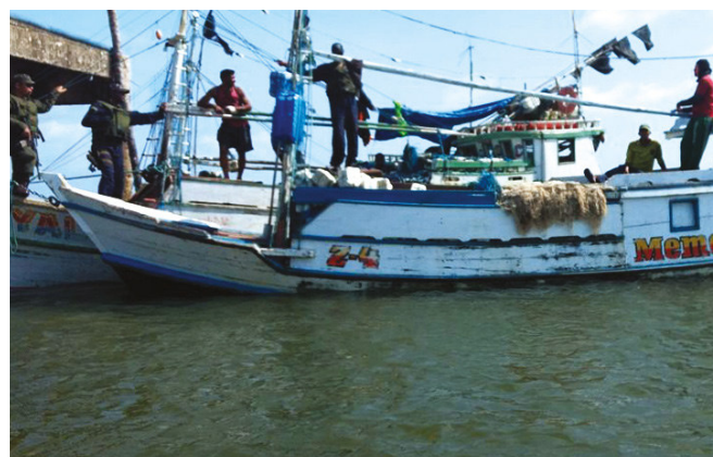
Embarcação irregular apreendida na Baía de Marajó

A Marinha do Brasil encaminhou os casos ao Grupamento Fluvial de Segurança Pública.