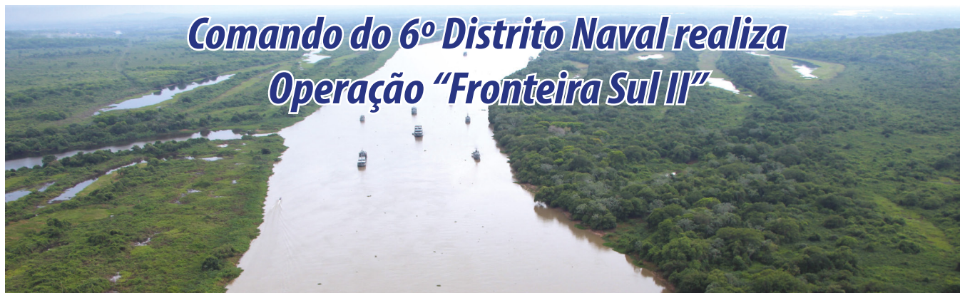
Meios empregados na Operação "Fronteira Sul II"

O Comando do 6º Distrito Naval realizou, entre os dias 23 e 28 de outubro, a Operação "Fronteira Sul II". A comissão contou com a participação de nove navios militares e de uma aeronave do 4º Esquadrão de Helicópteros de Emprego Geral (EsqdHU-4).