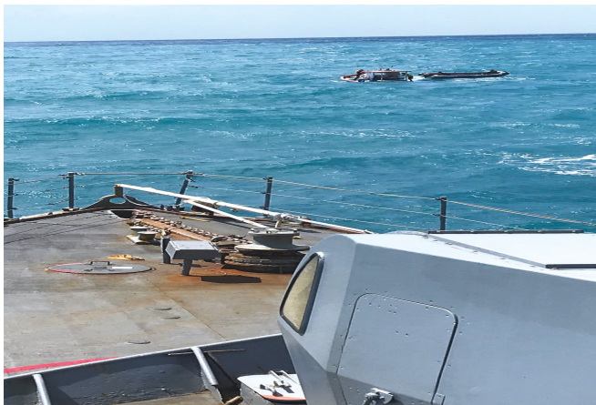
Atividade de Inspeção Naval

Na travessia de Recife (PE) para Natal (RN), esteve embarcado no NPa “Goiana” um oficial da FAB, que conheceu a rotina e peculiaridades de um navio da MB, além das atividades de patrulha naval e inspeção naval desenvolvidas durante a comissão.