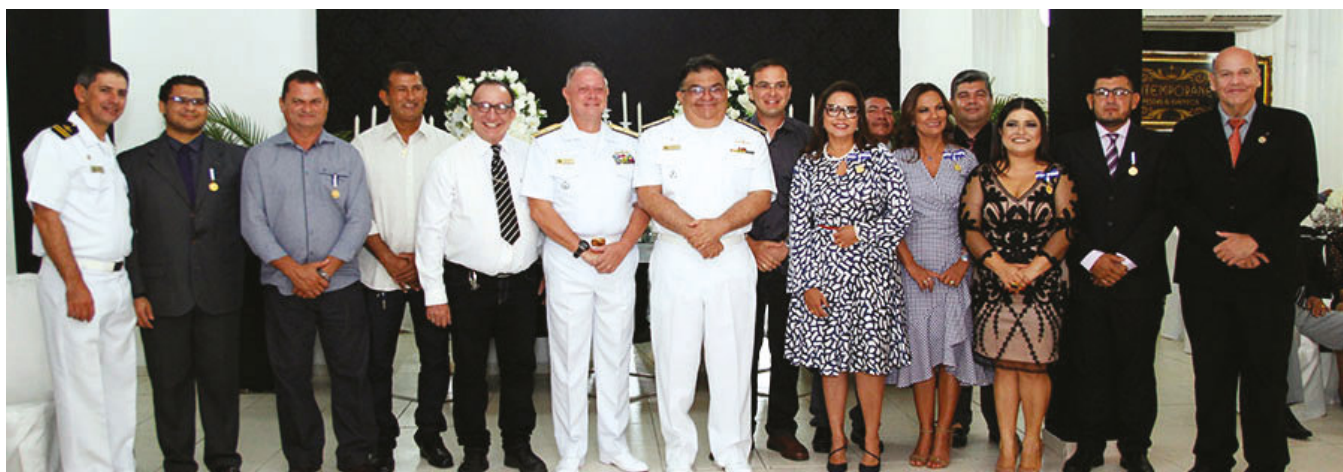
Cerimônia de inauguração da Soamar realizada em Parintins (AM)

A Soamar é uma sociedade civil organizada que atua no desenvolvimento e na integração da Marinha do Brasil com a sociedade, sem fins lucrativos. Com mais de 70 mil sócios convidados e participantes, a Soamar realiza atividades por meio de ações regionais e nacionais, promovendo a aproximação e a união entre as classes.