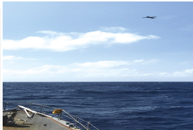
Aeronave da FAB em exercício conjunto