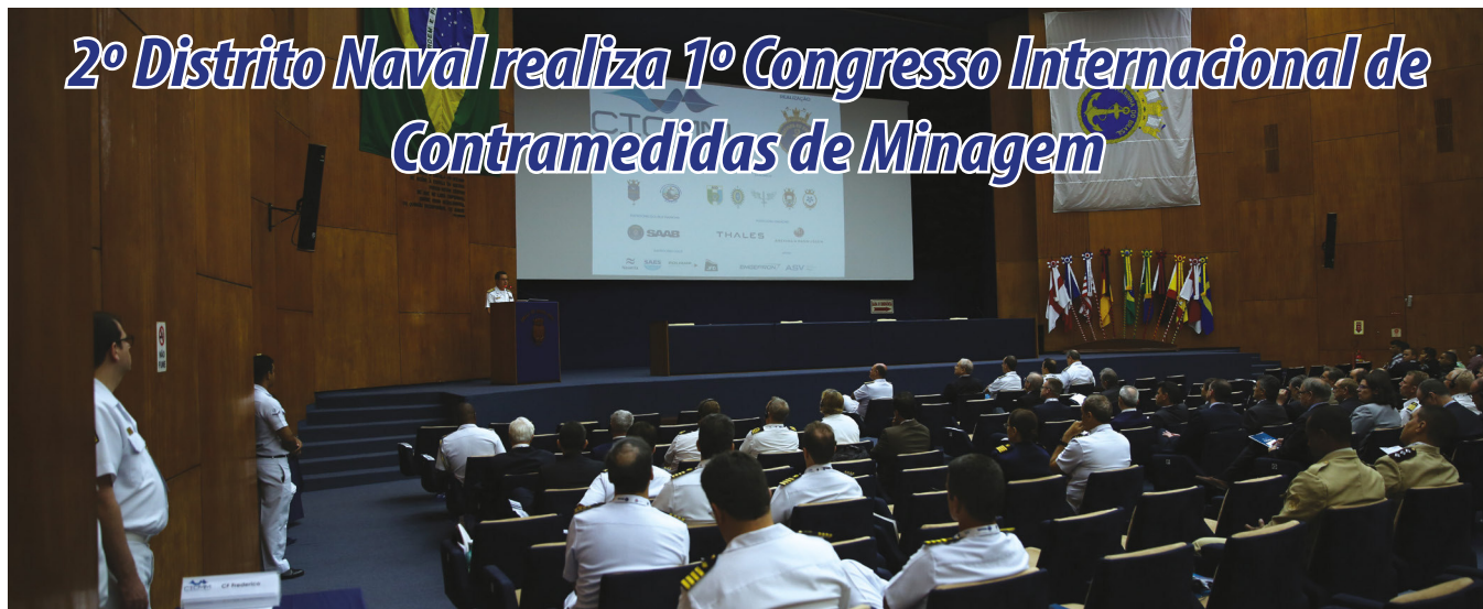
Participantes conheceram as novidades no setor de contramedidas de minagem

Nos dias 17 e 18 de outubro, a Marinha do Brasil, sob a coordenação do Comando do 2º Distrito Naval (Com2ºDN), realizou o “1º Congresso Internacional de Contramedidas de Minagem”, na Escola de Guerra Naval, no Rio de Janeiro (RJ).