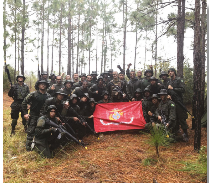
Instrução de procedimentos em ambiente de selva

de uma pequena cidade onde os marines treinam situações de combate urbano.