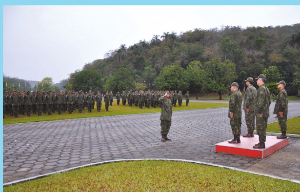
Após a troca do gorro azul pelo gorro camuflado, o Comandante do 26º GptOpFuzNav-Haiti apresentou os militares ao Comandante da FFE para mostra de pessoal

Este foi o último destacamento de fuzileiros navais a regressar do Haiti após 13 anos de serviços prestados à Organização das Nações Unidas (ONU). Durante a solenidade, os militares realizaram a troca do gorro azul, símbolo dos mantenedores da paz da ONU, pelo gorro camuflado, ato que marca oficialmente o retorno da tropa ao Brasil.