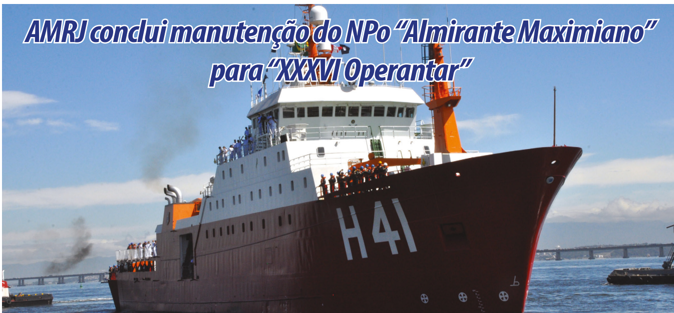
NPo “Almirante Maximiano” parte rumo à “XXXVI Operantar”

O Navio Polar “Almirante Maximiano” desatracou, no dia 10 de novembro, do Arsenal de Marinha do Rio de Janeiro (AMRJ), com destino ao Continente Antártico, após o término do Período de Manutenção Geral (PMG) e realização de prova de mar.