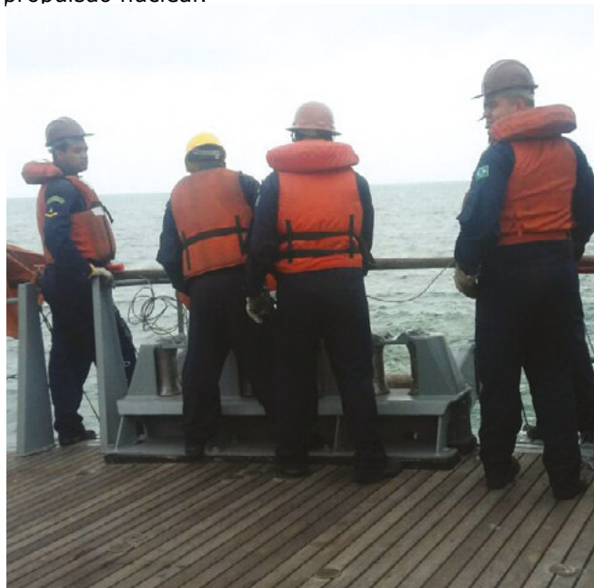
Preparação para o lançamento de boia de demarcação de canal varrido na popa do navio varredor

suprimento desta demanda operativa dos futuros submarinos do Programa de Desenvolvimento de Submarinos (Prosub). As operações de CMM são consideradas essenciais por todas as marinhas do mundo que possuem submarinos nucleares ou com propulsão nuclear.