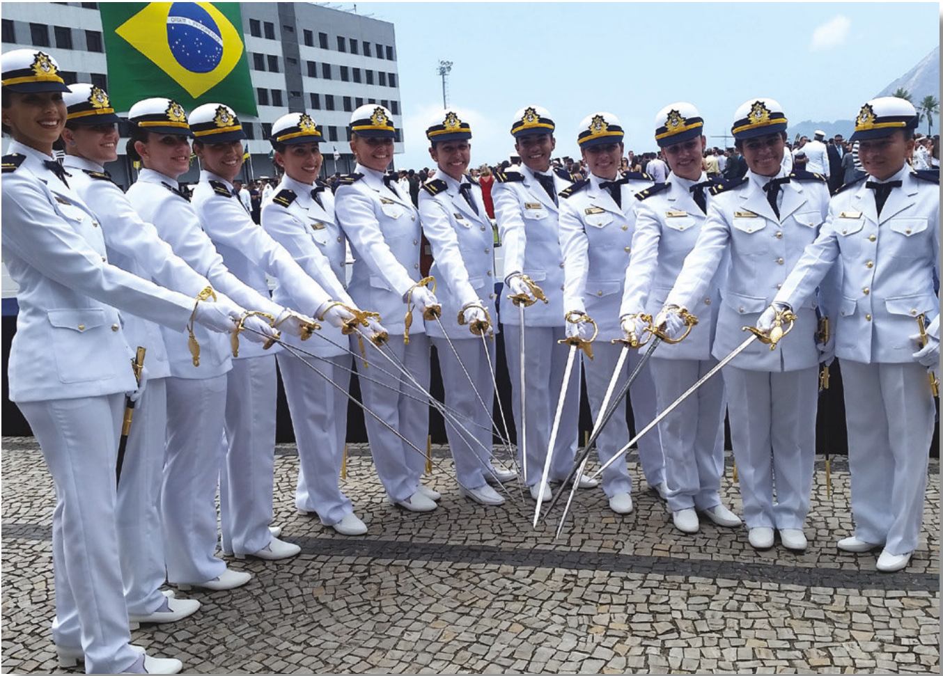
As 12 Guardas-Marinha formadas pela Escola Naval

Em 9 de dezembro, os 209 Aspirantes integrantes da Turma "Almirante Gastão Motta" receberam suas espadas, símbolo do Oficial da Marinha do Brasil (MB), em cerimônia marcada pelo ineditismo da formatura de 12 Guardas-Marinha (GM) mulheres para o Corpo de Intendentes da MB.