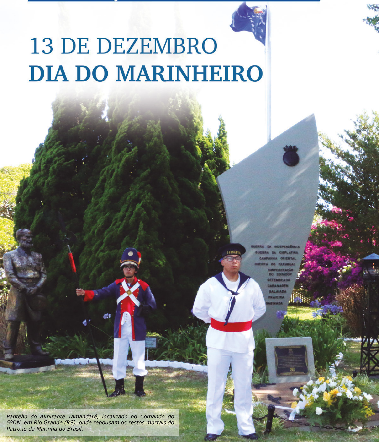
Panteão do Almirante Tamandaré, localizado no Comando do 5ºDN, em Rio Grande (RS), onde repousam os restos mortais do Patrono da Marinha do Brasil.