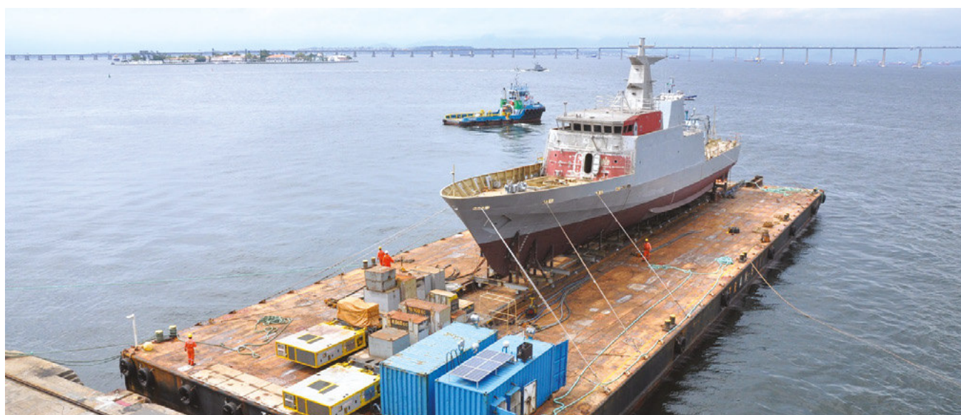
Casco do NPa "Maracanã" chega ao AMRJ

O Arsenal de Marinha do Rio de Janeiro (AMRJ) recebeu, em 27 de novembro, o casco do futuro Navio Patrulha (NPa) "Maracanã", proveniente do Estaleiro Ilha S.A (Eisa). A operação de traslado do NPa teve início com o Load Out do casco e durou cinco dias. O casco foi transportado por via marítima até o AMRJ.