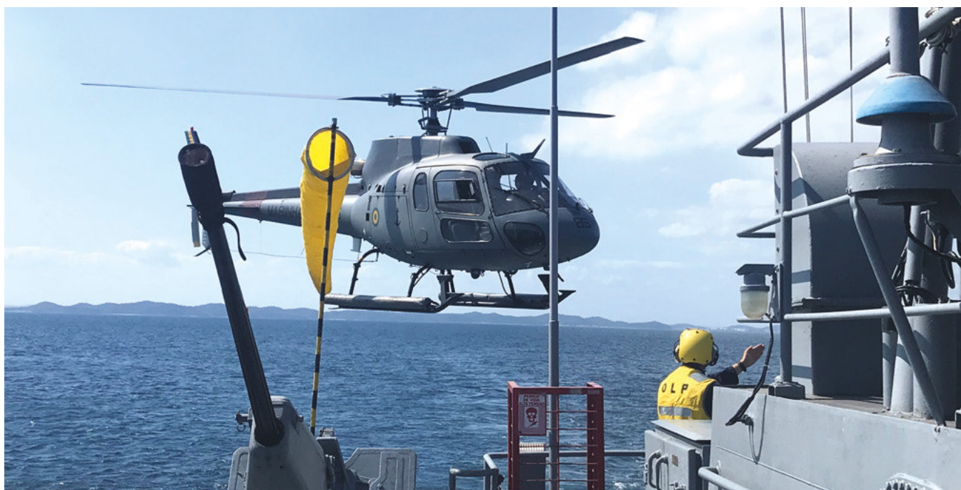
Aeronave UH-12 (Esquilo) em aproximação ao NPa “Guaratuba”

Nos dias 20 e 23 de novembro, o Comando do 2º Distrito Naval (Com2ºDN) realizou o exercício EQMAN LE-III, em que o Navio Patrulha (NPa) “Guaratuba” (P50) operou com a aeronave UH-12 (Esquilo) do 1º Esquadrão de Helicópteros de Emprego Geral (EsqdHU-1).