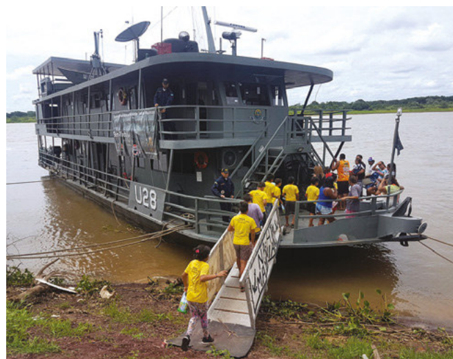
População embarcando no NASH para atendimento

O NASH “Tenente Maximiano”, subordinado ao Comando da Flotilha de Mato Grosso, contou com uma tripulação de 29 militares, sendo três enfermeiros, dois médicos, um dentista e um técnico em higiene dental.