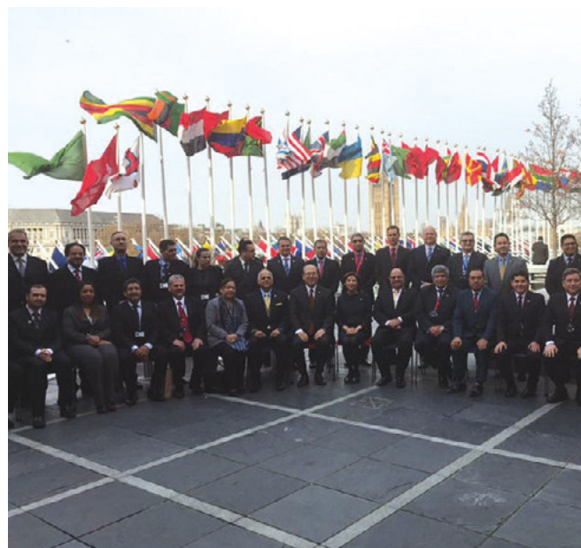
Participantes e representantes da Rocram

Representantes das Autoridades Marítimas e integrantes das delegações.