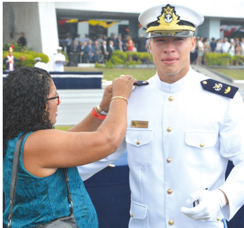
Familiar de formando faz troca de platinas

Durante a cerimônia, o Grupamento Escolar desfilou cantando a canção "Sentinela dos Mares".