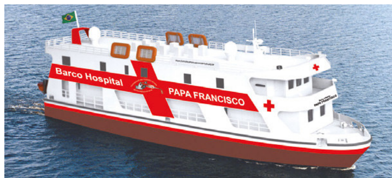
Projeto do barco hospital

A embarcação, que deverá entrar em serviço no final de 2018, prestará serviços de saúde e atendimento odontológico na Bacia Amazônica do Pará para cerca de 700 mil residentes de comunidades ribeirinhas dos municípios de Alenquer, Almerim, Belterra, Curruá, Faro, Juruti, Monte Alegre, Óbidos, Oriximiná, Prainha, Santarém e Terra Santa.