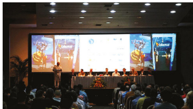
Diretor de Hidrografia e Navegação marca presença no COLACMAR 2017

O COLACMAR é um congresso bienal, de iniciativa da Associação Latino-Americana de Investigadores em Ciências do Mar (ALICMAR). A edição de 2017 foi promovida em parceria com a Associação Brasileira de Oceanografia (AOCEANO), a Universidade Federal de Santa Catarina (UFSC) e a Universidade do Vale do Itajaí (UNIVALI), com apoio de importantes instituições, entre elas, a Marinha do Brasil, por meio da DHN.