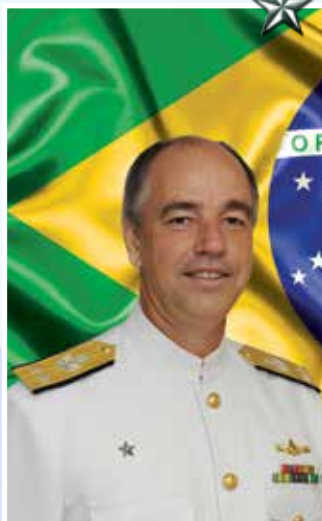
Contra-Almirante Valter Citavicius Filho

Subchefe de Inteligência Operacional do Comando de Operações Navais.