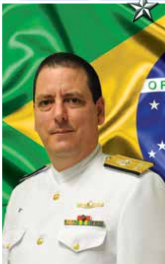
Contra-Almirante Claudio Henrique Mello de Almeida

★ ★ O Contra-Almirante Newton Calvoso Pinto Homem é natural do Rio de Janeiro. Foi declarado Guarda-Marinha em 13 de dezembro de 1985.