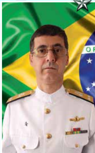
Contra-Almirante Luiz Octávio Barros Coutinho

O Contra-Almirante Luiz Octávio Barros Coutinho é natural do Rio de Janeiro. Foi declarado Guarda-Marinha em 13 de dezembro 1985.