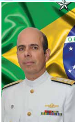
Contra-Almirante (EN) Álvaro Luís de Souza Alves Pinto

★ ★ O Contra-Almirante (EN) Álvaro Luís de Souza Alves Pinto é natural do Rio de Janeiro. Foi declarado Guarda-Marinha em 11 de março de 1985.